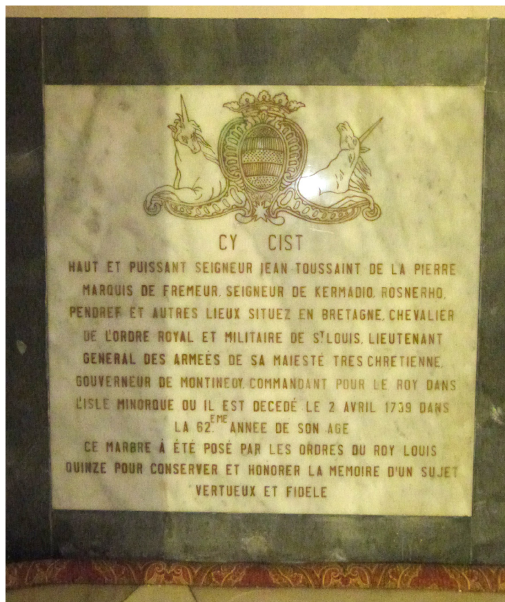
Figura 1. Tumba del marqués de Frémeur, iglesia de Santa María, Mahón, 1759 © Isabelle Langlade.

Tras el fallecimiento del marqués de Frémeur, el gobierno militar de la isla quedó por segunda vez en manos de Hyacinthe Gaëtan, conde de Lannion (1719-1762). Este último, que se había destacado en el ataque al castillo de San Felipe, también procedía de la nobleza bretona y ante-