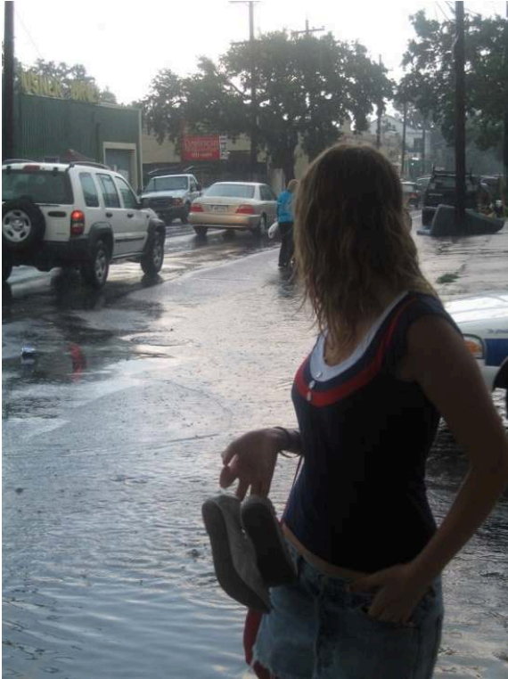
Typique journée d'été dans la ville acqueuse, La Nouvelle-Orléans, 2006

- mon grand-père - a travaillé au début des années 1900, faisant flotter ses troncs depuis les marigots jusqu'au lac puis au Mississippi. Cette parentèle pouvait lire le fleuve et ses affluents, les lacs et les bayous, aussi bien que le niveau de leurs eaux, bien mieux que je n'ai jamais été capable de lire quelque livre que ce soit.