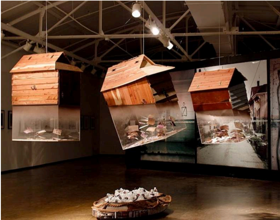
Things that Float (Des choses qui flottent), Rontherin Ratliff, La Nouvelle-Orléans, 2010

© RONTHERIN RATLIFF – avec l'aimable autorisation de DIVERSE WORKS