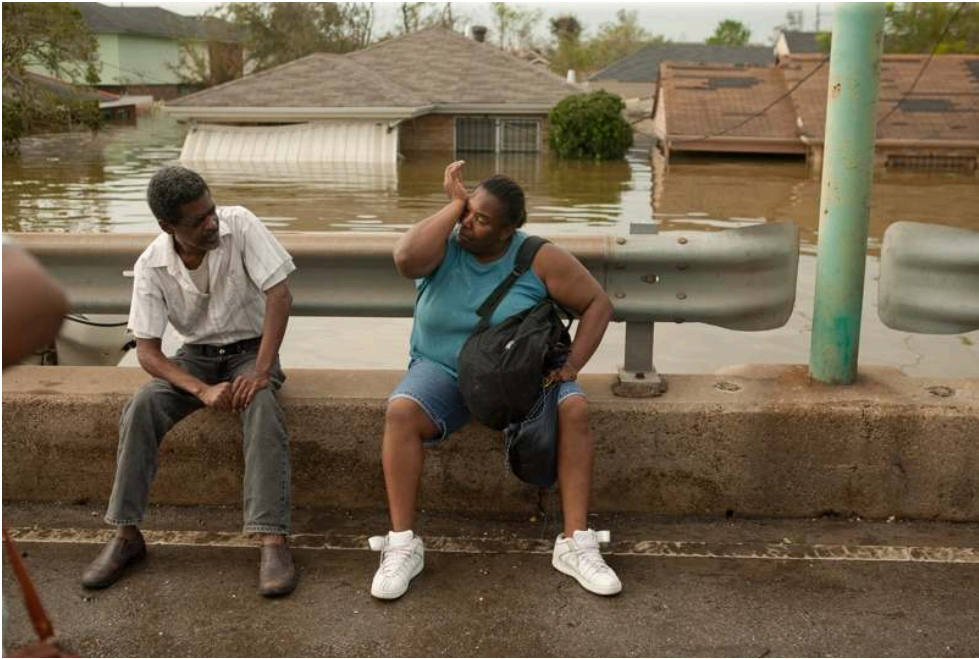
Untitled , Neal Alexander, La Nouvelle-Orléans, septembre 2005