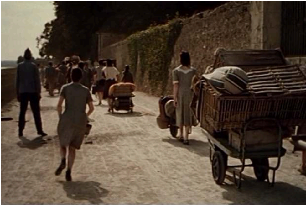
Les internés de l'asile rejoignent l'évacuation devant l'invasion allemande, Folle embellie , Dominique Cabrera, 2002.