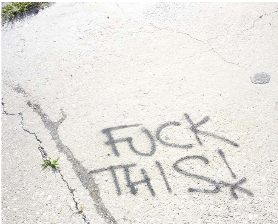
Détail. Clinique abandonnée de Desire, « Upper Ninth Ward », La Nouvelle-Orléans, 2008