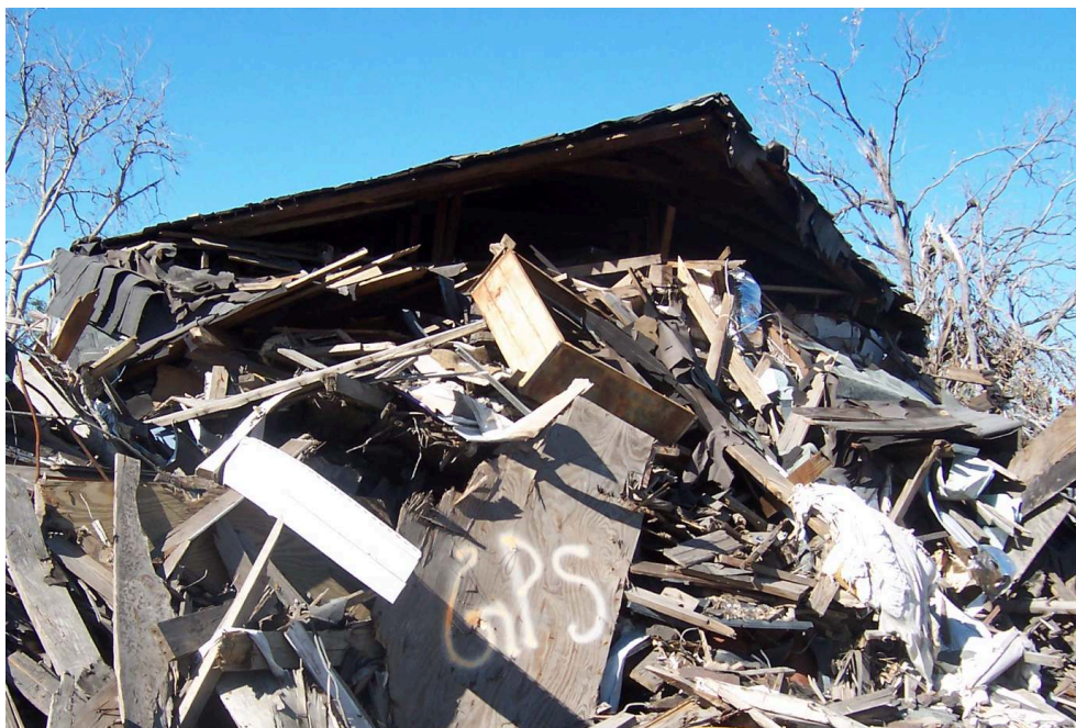
Bris et maison effondrée, La Nouvelle-Orléans, Février 2006