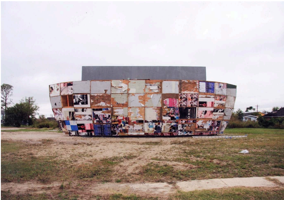
Mithra , Mark Bradford, 2008

Vue de l'installation « Prospect.1 », La Nouvelle-Orléans, 2008