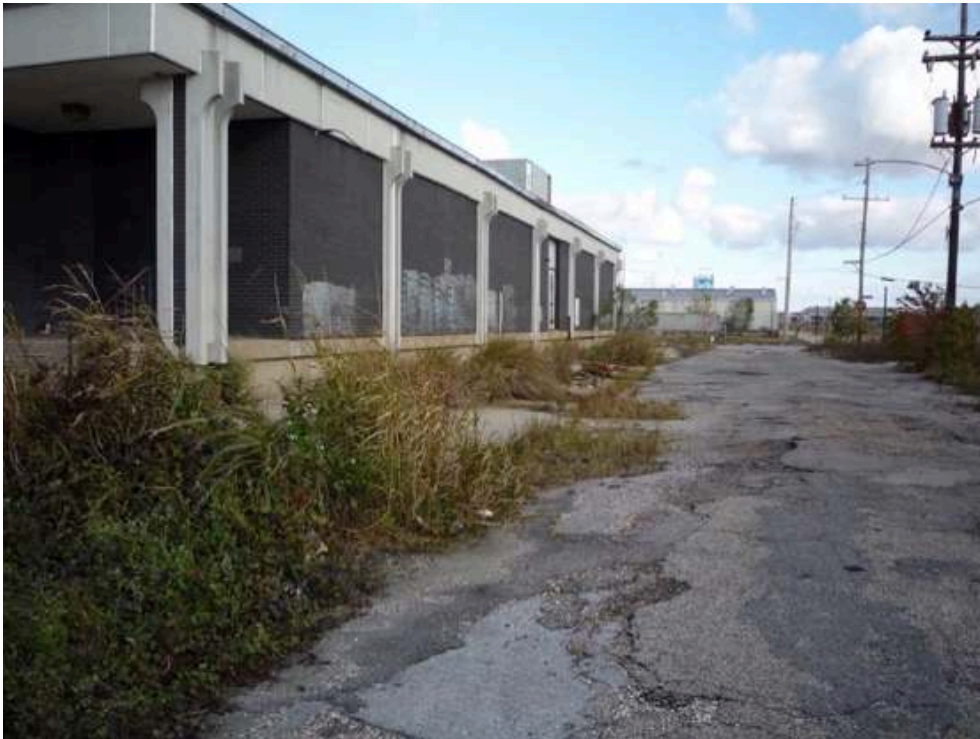
La clinique abandonnée de Desire, « Upper Ninth Ward », La Nouvelle-Orléans, 2008