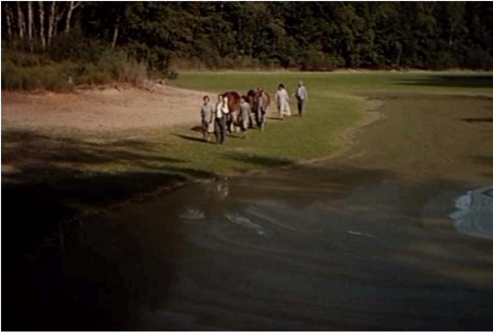
Les internés de l'asile « dans la nature » pendant l'invasion allemande, Folle embellie , Dominique Cabrera, 2002.