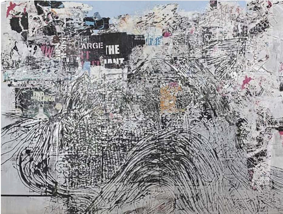
Noah's Third Day (L'Arche de Noé, Jour 3) , Mark Bradford, 2007

solutions ad-hoc à partir de ce qu'ils ont sous la main ; bref, naviguant sans destination finale 16 .