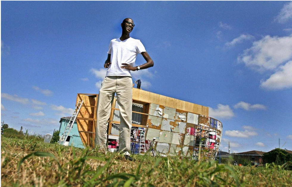
Mark Bradford devant l'assemblage de Mithra, Lower Ninth, lors de Prospect 1, La Nouvelle-Orléans.