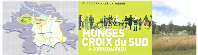
FAIRE DE LA VILLE UN JARDIN = UN OBJECTIF. Le terme de cité-jardin fut rejeté car jugé trop péjoratif. Dans la publicité, les habitants s'incorporent dans la trame paysagère avec un fond et arrière plan vert. La forêt toute proche et le relief offrent indéniablement des possibilités de perspectives.

Introduction: Avec «Constellation», un projet d'aménagement dans le périurbain nord-ouest de la Communauté Urbaine de Toulouse, se projette une opération devant satisfaire aux besoins de logements, de déplacements et de respect de la trame paysagère sous forte pression immobilière. Sur les communes de Blagnac, Beauzelle et Cornebarrieu s'articulent deux ZAC : Andromède et Monges-Croix du Sud dont la réalisation est confiée à la SEM Constellation (Oppidea). L'initiative revient au Grand Toulouse, révisant son PLU en juin 2004 pour confier le projet à l'équipe dirigée par Bruno Forestier, urbaniste, avec Michel Desvignes, paysagiste, et Frédéric Bonnet & Marc Bigamet, architectes. Le récent quartier de Monges-Croix du Sud s'étend sur 54 ha, comportant 12 ha d'espaces verts dont l'objectif est d'accueillir 850 logements, une vingtaine de commerces et services de proximité ainsi que des équipements publics sur la commune de Cornebarrieu.