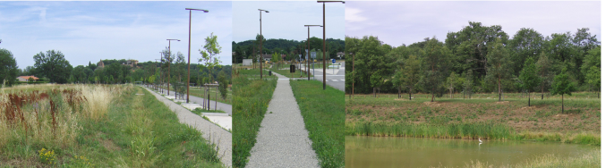
Monges-Croix du Sud en 2011, gestion des eaux pluviales, ruisseaux, étangs et faible goudronnage.

Le projet a pour objectif d'être le premier écoquartier de la région avec une visée de promotion et de sensibilisation au développement durable. Cet écoquartier dans le périurbain proche base sa réalisation sur la contractualisation par une certification en amont entre la SEM et le CERQUAL. Les acteurs désirent mettre en avant des opérations d'aménagement du relief dont l'imperméabilisation minimum des sols, gestion naturelle des eaux pluviales et économies d'énergies concernant l'éclairage public. Le parc central joue un rôle primordial dans le traitement des eaux et la protection des zones humides (ruisseaux et étangs) présentant ainsi des réponses tangibles aux enjeux environnementaux. Le système des trois strates paysagères privilégie les essences persistantes et caduques, pionnières et pérennes (Arbre, haie, cordon).