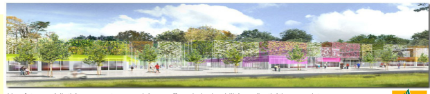
Une future médiathèque ayant succombé aux affres de la durabilité par l'esthétique, projet.

La création d'une nouvelle ambiance paysagère est l'objectif surtout dans un contexte toulousain où depuis plus d'une vingtaine d'années les communautés fermées ont proliférées. Le simple verdissement marketing et de vente du projet n'est pas suffisant, il faudra prendre en compte les retours des habitants voulant ou non adhérer à ce projet de vie et faire sienne la philosophie du lieu.