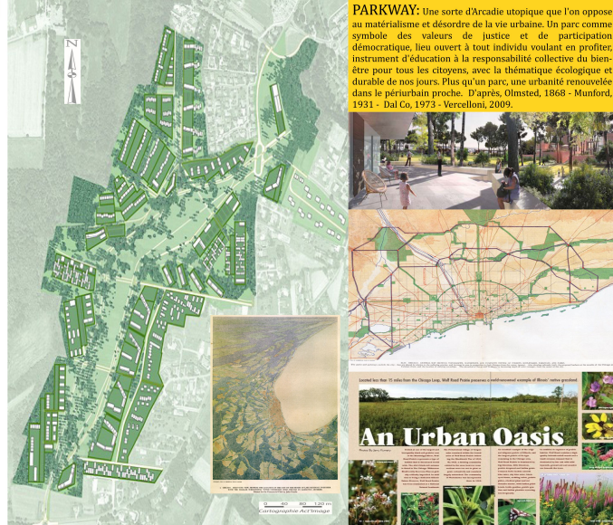
Le parkway de Monges-Croix, en parallèle, le Chicago de 1909, représentation d'artiste montrant la volonté de maîtriser la croissance de la ville par la nature environnante. Représentation/infographie d'une perspective avec vue sur le grand Toulouse depuis un équipement public, 2008. 1909/2009, penser les marges de la ville et son périurbain proche par des systèmes de parcs tout en embellissant le cadre de vie et proposant une relation de santé/bien-être avec la biodiversité et la médiation paysagère.

Pour tous les bâtiments, le règlement de construction demande aux promoteurs et architectes de prendre en considération la qualité particulière du site, les perspectives et végétation locale. Les choix de l'orientation des logements, des matériaux, des jardins en copropriété et la pondération-mesure des volumes et hauteurs des immeubles s'expliquent par la présence du parkway et sa volonté de développer un nouveau cadre de vie. L'enjeu est de lier l'intégration des constructions et réceptions du parkway par les habitants ou visiteurs. Actuellement, d'autres métropoles mondiales se remémorent leurs héritages paysagères comme à l'occasion du centenaire du Plan of Chicago - 1909/2009. Burnham pensait déjà à construire sur les marges de la nature environnante de la grande ville, un système de parcs et de cité-jardin. Sans tomber dans l'anachronisme ni oublier les particularismes locaux, il s'opère actuellement une tendance à la construction de grand ensemble ou le parkway devient la colonne vertébrale du projet périurbain. L'aspect écologique est important dans l'incorporation de la nature en plein centre des habitations comme un oasis, une mise en scène-récit et spectacle par des perspectives et jeux de végétations/plans d'eaux variés.