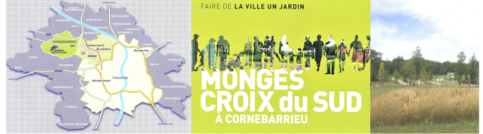
FAIRE DE LA VILLE UN JARDIN = UN OBJECTIF. Le terme de cité-jardin fut rejeté car jugé trop péjoratif. Dans la publicité, les habitants s'incorporent dans la trame paysagère avec un fond et arrière plan vert. La forêt toute proche et le relief offrent indéniablement des possibilités de perspectives.

Introduction: Avec «Constellation», un projet d'aménagement dans le périurbain nord-ouest de la Communauté Urbaine de Toulouse, se projette une opération devant satisfaire aux besoins de logements, de déplacements et de respect de la trame paysagère sous forte pression immobilière. Sur les communes de Blagnac, Beauzelle et Cornebarrieu s'articulent deux ZAC : Andromède et Monges-Croix du Sud dont la réalisation est confiée à la SEM Constellation (Oppidea). L'initiative revient au Grand Toulouse, révisant son PLU en juin 2004 pour confier le projet à l'équipe dirigée par Bruno Forestier, urbaniste, avec Michel Desvignes, paysagiste, et Frédéric Bonnet & Marc Bigamet, architectes. Le récent quartier de Monges-Croix du Sud s'étend sur 54 ha, comportant 12 ha d'espaces verts dont l'objectif est d'accueillir 850 logements, une vingtaine de commerces et services de proximité ainsi que des équipements publics sur la commune de Cornebarrieu.