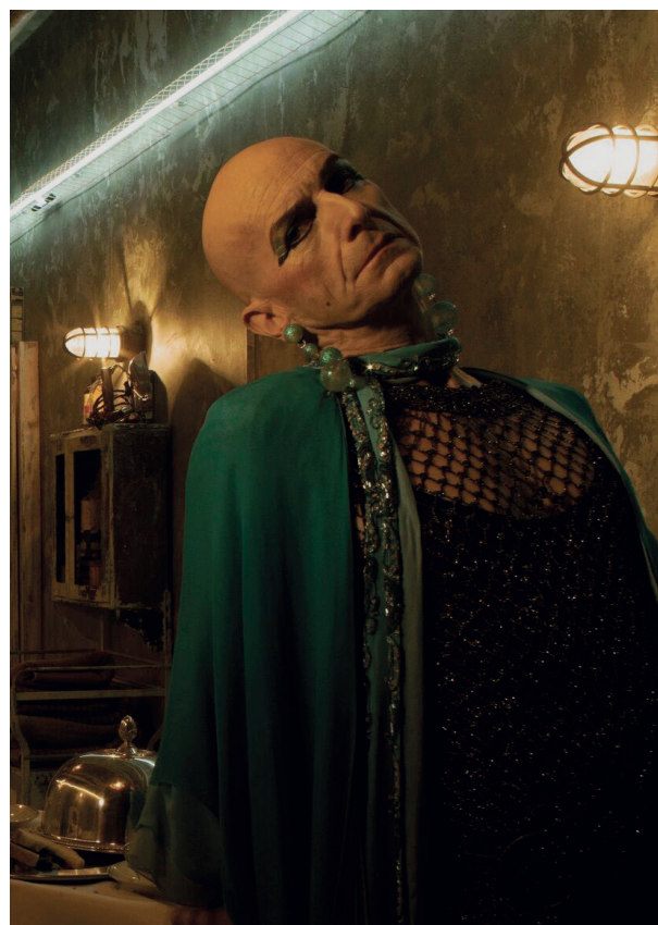
Fig. 3. Le personnage de « Liz Taylor » dans la série American Horror Story: Hostel (20th Century Fox Television, 2015-2016)

Ces aspects positifs sont néanmoins contrecarrés par l'image de la femme dépensière et mégalomane. Le maquillage, les tenues, les bijoux et les perruques extravagantes de Liz Taylor ont laissé leur trace sur toutes les représentations de reines égyptiennes, notamment dans le cas de la dépouille de vautour en or et du lourd trait de khôl qui orne leurs yeux: l'entrée de Madonna au Superbowl en 2012 ou les chars de Monica Bellucci dans Astérix & Obélix: Mission Cléopâtre en 2002 en sont les caricatures les plus représentatives. Le modèle est tel que dans le comics et le film 300 , le roi perse Xerxès a lui aussi droit à son char exubérant, soulignant sa folie et sa féminité. Aujourd'hui, s'habiller en Égyptienne, c'est se couvrir de bijoux kitsch et se déguiser en Elizabeth Taylor