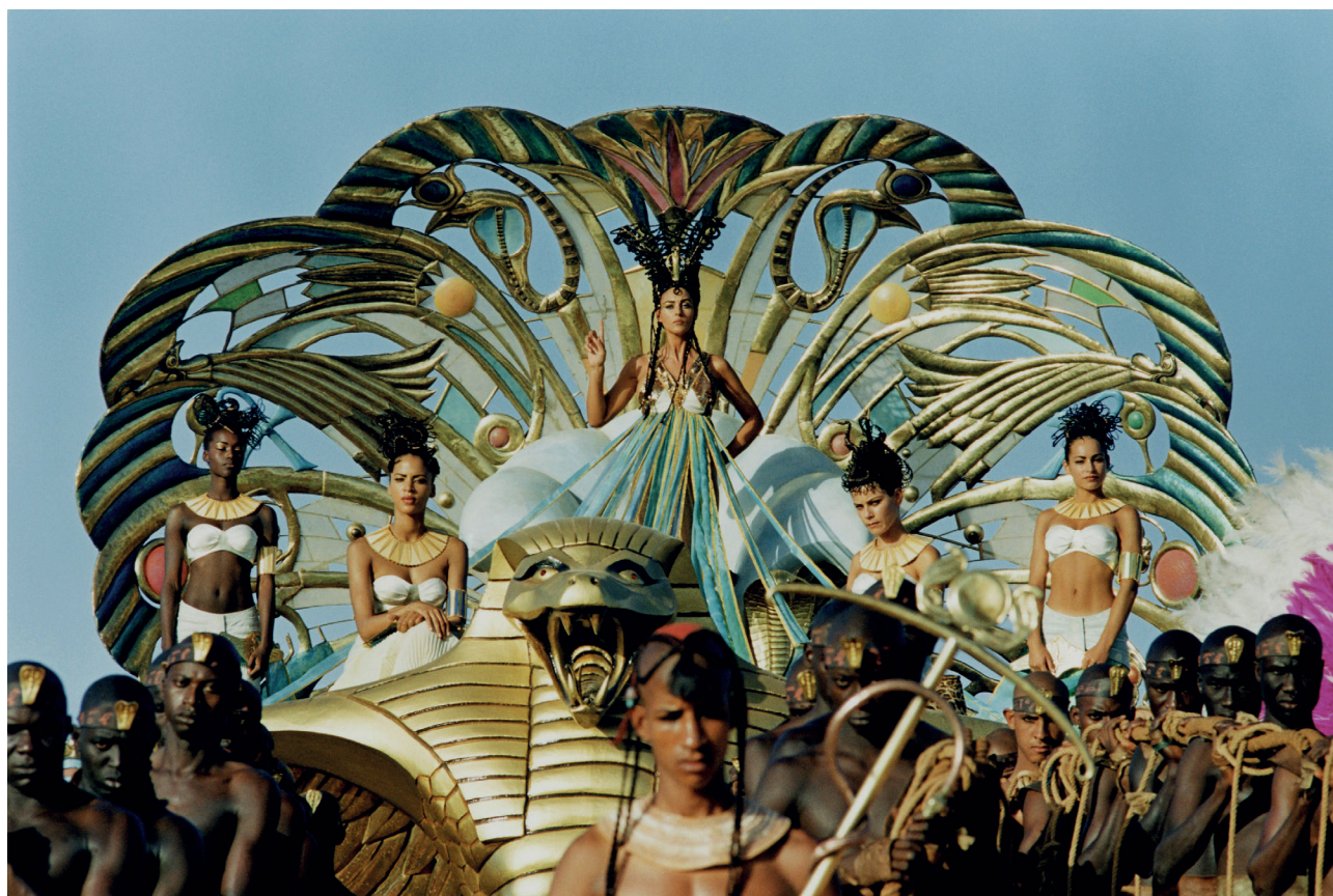
Fig. 5. Cléopâtre et ses servantes/esclaves dans Astérix: Mission Cléopâtre (Alain Chabat, 2002)

une grande femme africaine et noire, qui préférerait mourir que se soumettre à l'Occident. Ici le discours académique et les réappropriations diffèrent fortement largement, le consensus scientifique n'ayant que peu à voir avec les représentations.