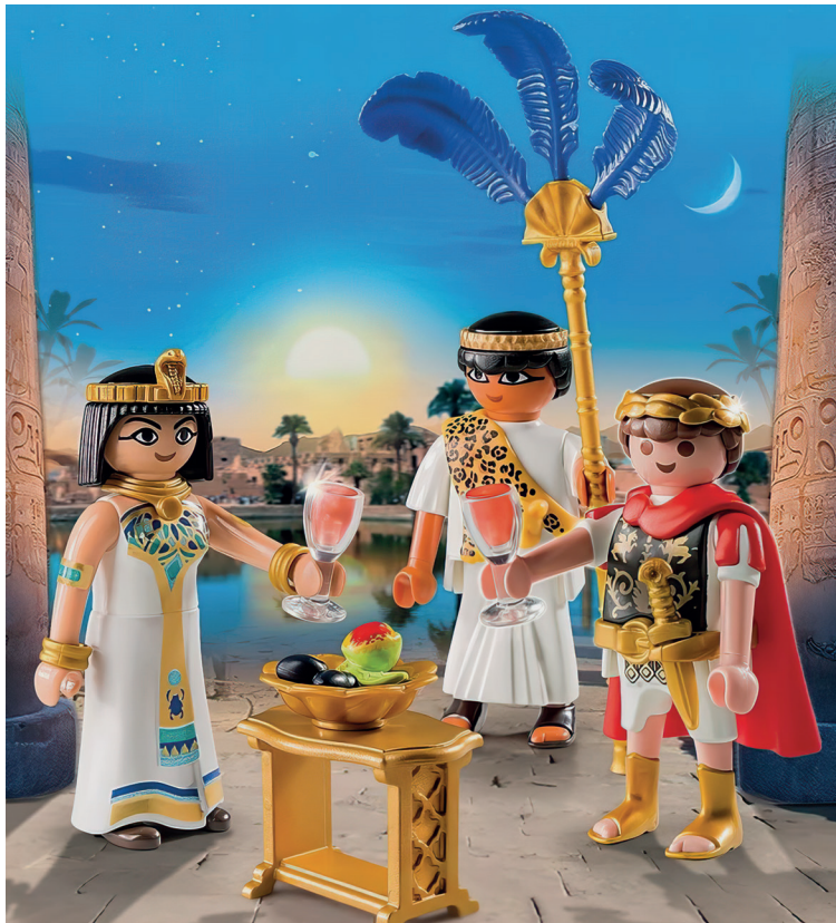
Fig. 4. Playmobil® History, boîte 5394, 2017

La Cléopâtre incarnée par Lyndsey Marshal dans la série Rome (2005-2007) détonne dans cette galerie de portraits: le crâne rasé pour pouvoir mettre ses perruques, des tenues simples, une beauté atypique et une certaine spontanéité étaient censés offrir une image plus modérée et fiable de Cléopâtre, débarrassée de ses atours pharaoniques... oui, mais comme dans le jeu vidéo Assassin's Creed: Origins en 2017, cette prétention historique s'est arrêtée aux apparences, le caractère de la reine demeurant très caricatural et le décor de certaines scènes révélant la puissance évocatrice des modèles précédents. Le cadre dans lequel évoluent nos reines égyptiennes est en effet très uniforme; quelle que soit la période concernée, il évoque presque systématiquement les fastes de la période pharaonique, vue comme un ensemble homogène, et fait fréquemment intervenir les pyramides, certes visibles pour une très vaste partie de l'Antiquité égyptienne, mais bien antérieures et éloignées des palais. Cléopâtre remportant haut la main la palme des reines égyptiennes les plus citées, l'anachronisme est quasiment permanent, et ce même dans des productions qui ont fait le pari du réalisme et de l'enquête historique.