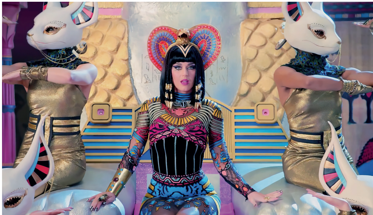
Fig. 2. Katy Perry, dans le clip Dark Horse (Capitol, Universal Music, 2013)

en 2014, Katy Perry rejoue toute l'histoire des représentations de la reine et s'approprie les critiques faites à son modèle dans un sketch cynique au cours duquel elle détruit un à un ses prétendants pour les dépouiller de leurs richesses (fig. 2). Cette image de femme dangereuse et agressive existe par ailleurs dans la culture populaire, probablement en lien avec l'imaginaire terrifiant de la momie égyptienne : dans les livres d'Ann Rice et les films qui en ont été tirés, la première femme vampire, Akasha, est l'épouse d'un roi égyptien, une femme dangereuse et ambiguë qui a inspiré diverses réinterprétations, notamment par la chanteuse FKA Twigs. La multiplication progressive des fauves autour des reines égyptiennes participe d'un certain ensauvagement de ces femmes : elles se sont affranchies des hommes et sont plus volontiers entourées de félins que d'amants. En plus d'être manipulatrices, elles sont souvent farouches et cruelles, avec une prédilection certaine pour l'usage des poisons.