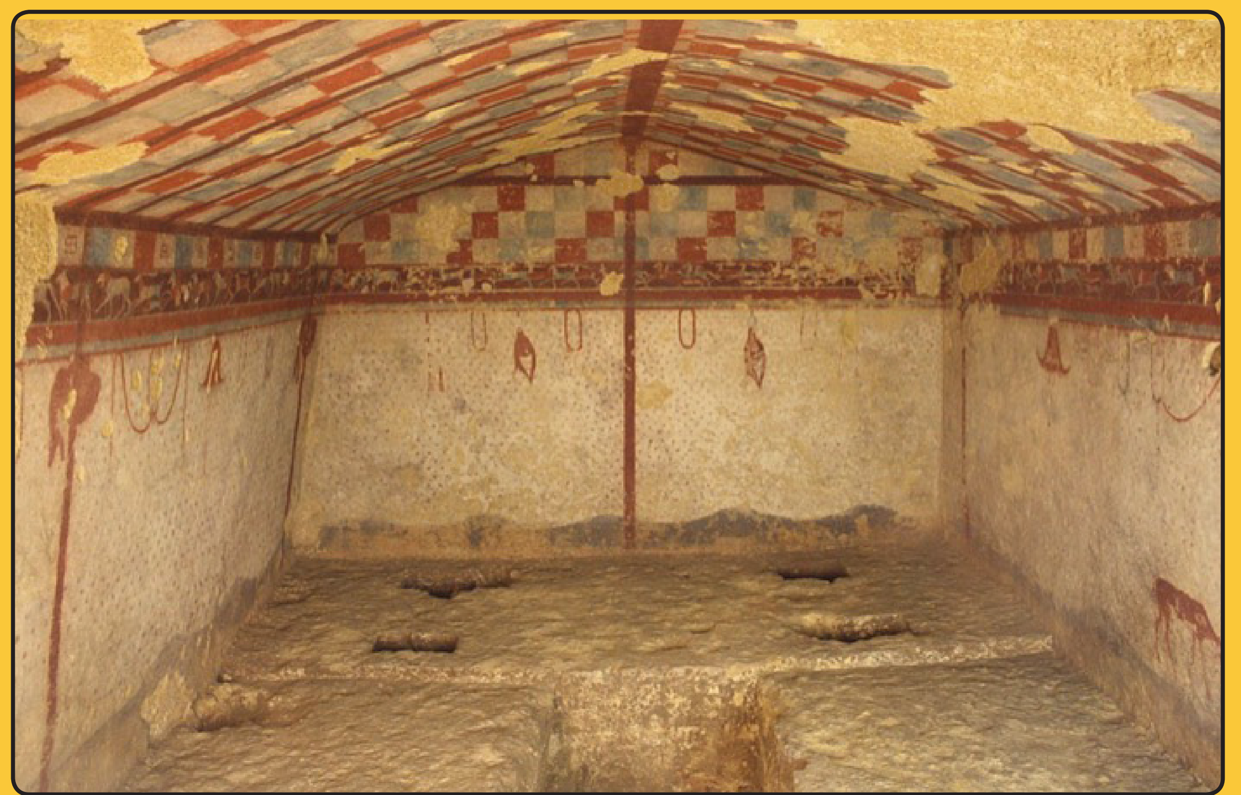
Fig. 2. Tarquinia, tomba del Cacciatore Vista generale e dettagli : preda vivi e macellati D'après M. Moretti, Nuovi monumenti della pittura etrusca, Milan, 1966.

Questa giustapposizione nello stesso programma dell'animale vivo e dell'animale morto è già presente nella scena del ritorno dalla caccia associata a un inseguimento, dove la lepre ancora libera precede i cacciatori e gira la testa verso i suoi inseguitori mentre uno dei suoi congeneri al lato opposto fa parte della selvaggina catturata ( Fig.1 ). L'intera campagna di caccia è quindi evocata da questa ellisse temporale, che associa animali selvatici e animali macellati.