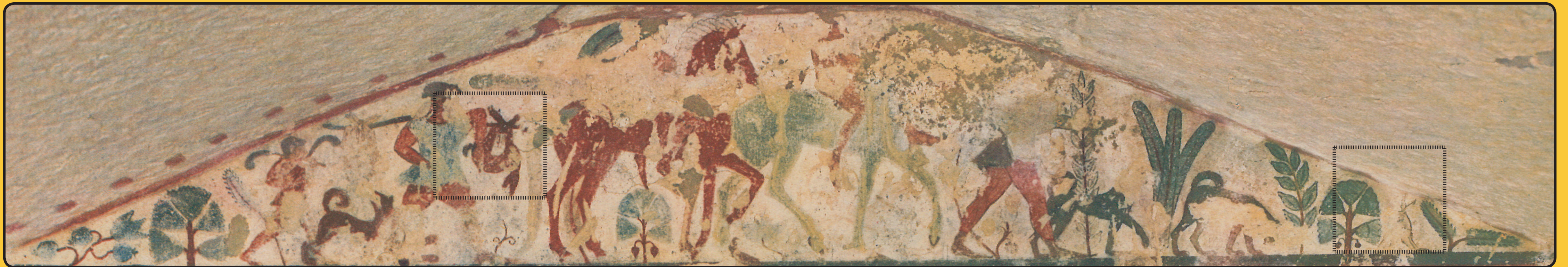
Fig. 1. Tarquinia, tomba della Caccia e della Pesca, prima camera, parete di fondo, timpano. D'après P. Romanelli, Tarquinia, Le pitture della tomba della Caccia e Pesca, Rome, 1938.

La caccia occupa un posto importante nella pittura funeraria etrusca della fine del VI sec. a.C., in modo esplicito nella rappresentazione delle diverse fasi della caccia, dall'inseguimento al ritorno dalla caccia, ma anche in modo più implicito nella rappresentazione dei resti di animali macellati. Essi appaiono in una delle più antiche rappresentazioni di caccia delle tombe di Tarquinia come nella scena della caccia alla lepre situata nella prima camera della tomba della Caccia e della Pesca ( Fig.1 ), databile intorno al 510 a.C. Benché lo schema riprenda i ritorni di caccia rappresentati nello stesso periodo sulla ceramica attica, il modo di attaccare i resti dell'animale al bastone, con quattro invece che due zampe, è per G. Camporeale, una specificità etrusca.