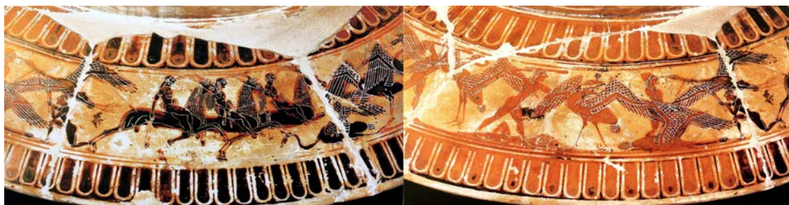
Figure 7. Vase François, provenant de Chiusi, conservé à Florence, Musée archéologique, Détail du pied. D'après H. A. Shapiro, M. Iozzo, A. Lezzi-Hafter (éd.), The François Vase: new perspectives. Papers of the International Symposium, Villa Spelman, Florence, 23-24 May, 2003 , vol. 2, The Photographs , Zurich, 2013, p.46-47.

Le vase François présente sur son pied un registre continu comprenant une série de combats opposant les grues aux Pygmées, à pied ou chevauchant des chèvres (Figure 7). Le motif de la cavalcade sur l'animal miniature s'inscrirait, pour M. Torelli 24 , dans le même registre que certaines chevauchées de Satyres, représentées par les céramistes attiques au VI e et au début du V e siècle av. J.-C. et adoptant un traitement théâtral. Pour V. Dasen 25 la géranomachie du vase François fonctionne comme une parodie de combat guerrier, faisant contrepoint aux scènes héroïques développées sur le haut du support (la Centauiromachie, les épisodes des gestes d'Achille et de Thésée).