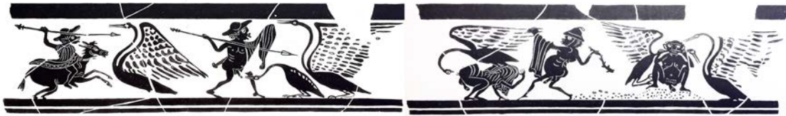
Figure 10. Canthare cabirique conservé à Berlin, Staatliche Museum inv. V.I. 3159, deuxième quart du IV e siècle av. J.-C. D'après V. Dasen, Dwarfs in Ancient Egypt and Greece , Oxford, 1993, fig. 13.1.

La géranomachie tarquinienne renseigne donc sur l'introduction de schémas mythologiques plus aisément identifiables, qui s'inspirent sans doute eux-mêmes de procédés de mise en scène comique, réemployés à des fins eschatologiques. Il est en effet intéressant d'observer que si le sujet et le schéma employés ici sont inédits au sein du corpus des fresques de Tarquinia, ses relations avec le programme général de la tombe, et en particulier avec la scène de cortège à cheval identifié au thème de l'arrivée dans l'au-delà, semblent relever du même réseau symbolique que celui mis en lumière pour les tombes antérieures. Ce ne sont plus les scènes relevant des realia des performances irrévérencieuses qui seraient ici illustrées ici, mais un épisode emprunté au mythe grec, comportant à la fois une forme de transgression morale et une dimension théâtrale comique. Cet élément du décor fait en outre pendant à une autre scène peinte au-dessus de loculus de la