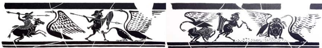
Figure 10. Canthare cabirique conservé à Berlin, Staatliche Museum inv. V.I. 3159, deuxième quart du IV e siècle av. J.-C. D'après V. Dasen, Dwarfs in Ancient Egypt and Greece , Oxford, 1993, fig. 13.1.

La géranomachie tarquinienne renseigne donc sur l'introduction de schémas mythologiques plus aisément identifiables, qui s'inspirent sans doute eux-mêmes de procédés de mise en scène comique, réemployés à des fins eschatologiques. Il est en effet intéressant d'observer que si le sujet et le schéma employés ici sont inédits au sein du corpus des fresques de Tarquinia, ses relations avec le programme général de la tombe, et en particulier avec la scène de cortège à cheval identifié au thème de l'arrivée dans l'au-delà, semblent relever du même réseau symbolique que celui mis en lumière pour les tombes antérieures. Ce ne sont plus les scènes relevant des realia des performances irrévérencieuses qui seraient ici illustrées ici, mais un épisode emprunté au mythe grec, comportant à la fois une forme de transgression morale et une dimension théâtrale comique. Cet élément du décor fait en outre pendant à une autre scène peinte au-dessus de loculus de la