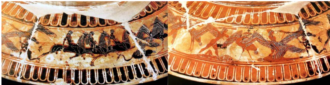
Figure 7. Vase François, provenant de Chiusi, conservé à Florence, Musée archéologique, Détail du pied. D'après H. A. Shapiro, M. Iozzo, A. Lezzi-Hafter (éd.), The François Vase: new perspectives. Papers of the International Symposium, Villa Spelman, Florence, 23-24 May, 2003 , vol. 2, The Photographs , Zurich, 2013, p.46-47.

Le vase François présente sur son pied un registre continu comprenant une série de combats opposant les grues aux Pygmées, à pied ou chevauchant des chèvres (Figure 7). Le motif de la cavalcade sur l'animal miniature s'inscrirait, pour M. Torelli 24 , dans le même registre que certaines chevauchées de Satyres, représentées par les céramistes attiques au VI e et au début du V e siècle av. J.-C. et adoptant un traitement théâtral. Pour V. Dasen 25 la géranomachie du vase François fonctionne comme une parodie de combat guerrier, faisant contrepoint aux scènes héroïques développées sur le haut du support (la Centauiromachie, les épisodes des gestes d'Achille et de Thésée).