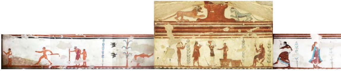
Figure 4. Tarquinia, nécropole de Monterozzi, tombe des Jongleurs, vers 520 av. J.-C., in situ, parois de gauche, du fond et de droite, d'après M. Moretti, Nuovi monumenti della pittura etrusca , Milan, 1966, p. 22 et 26-27.

Le vieillard de la scène de départ a été identifié par certains exégètes comme l'organisateur des jeux funèbres 12 , en raison du programme iconographique général dévolu aux jeux scéniques et sportifs : une scène de jonglerie sur la paroi du fond, danseuses et musiciens sur celle de droite. Il pourrait s'agir d'un pédagogue, d'un initiateur accompagnant le départ du jeune chasseur sous les yeux d'un plus jeune élève. La paroi du fond est occupée par une scène de danse et de jonglerie, représentation donnée sous les yeux d'un magistrat assis sur un siège curule, symbolisant sans doute la présence du défunt. Un orant lui fait pendant à l'extrémité gauche de la paroi. Sur la paroi droite se déroule une scène de musique et de danse.