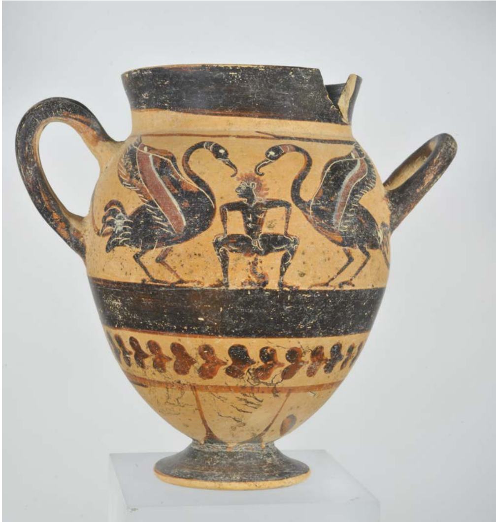
Figure 9. Kyathos provenant de Vulci, nécropole de l'Osteria, attribuée au peintre du Silène, Rome, Musée National Etrusque de la Villa Giulia. CC BY-SA 4.0

Sur le kyathos plus récent de la fin du VI e siècle av. J.-C. attribué au peintre du Silène (Figure 9), découvert en novembre 1995 dans une tombe vulcienne de la nécropole de l'Osteria et conservé à Rome au Musée de la Villa Giulia, un personnage nu et hirsute est figuré en train de déféquer. Il est encadré par deux oiseaux échassiers touchant sa tête de leur bec. Le schéma fonctionne ici comme un détournement parodique du type du despotès thèrôn qui se réfère au conflit mythique entre les grues et les Pygmées. Le type du personnage, comme son attitude provocatrice, s'intègre en outre dans le contexte du développement d'un répertoire parodique de la seconde moitié du VI e siècle av. J.-C. qui met en scène des êtres — Silènes, Satyres, Pygmées — qui, par leur nature ou par leurs actions — pratiques sexuelles débridées, défécation —, incarnent la transgression des normes. Le contexte funéraire du dépôt de ce vase pose ici encore la question du choix délibéré de ce thème à des fins eschatologiques. Pour A. M. Moretti Sgubini et L. Ricciardi 26 , le caractère « tragi-comique » de ce thème assumerait une fonction apotropaïque en