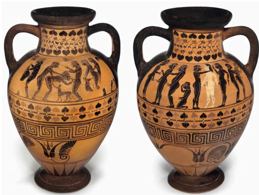
Figure 3. Amphore du peintre de Pâris, vers 530 av. J.-C., autrefois sur le marché des Antiquités, actuellement retiré de la vente.