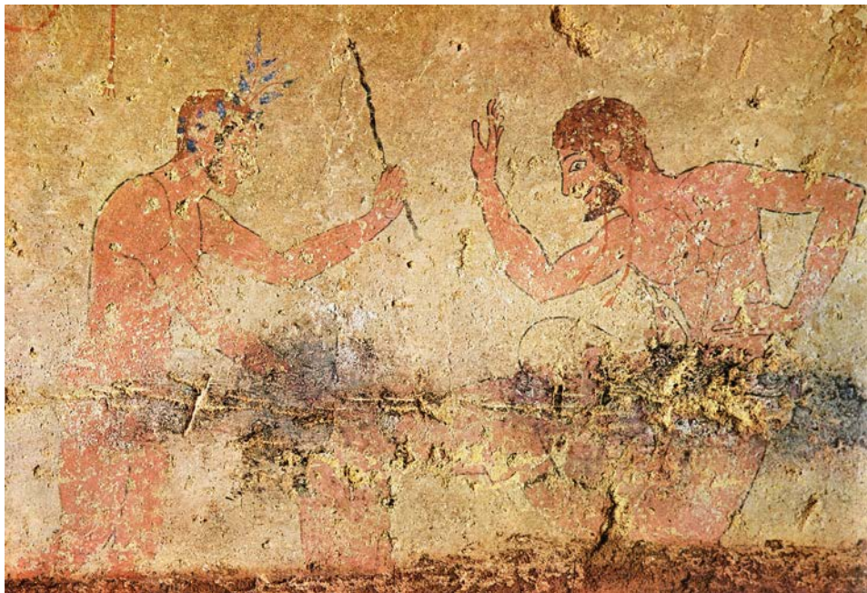
Figure 2. Tarquinia, nécropole de Monterozzi, tombe de la Fustigation, datée du dernier quart du VI e siècle av. J.-C., in-situ , paroi droite, gros plan, d'après M. Moretti, Nuovi monumenti della pittura etrusca , Milan, 1966, p. 138.

Outre la fonction symbolique du coït, la pratique sexuelle peut également être envisagée comme le reflet des realia des cérémonies funéraires étrusques, associant danse, jeux sportifs périlleux et actes érotiques mimés ou réels. Plusieurs auteurs 3 soulignent en effet le caractère burlesque de la scène érotique homosexuelle, contrariée par la charge du taureau. Le registre comique employé par les imagiers relèverait certes d'une fonction rituelle, correspondant à une volonté de tourner en dérision l'étape de l'ultime voyage vers l'au-delà, mais pourrait également refléter l'influence des procédés de mise en scène théâtrale, sur la pratique des peintres.