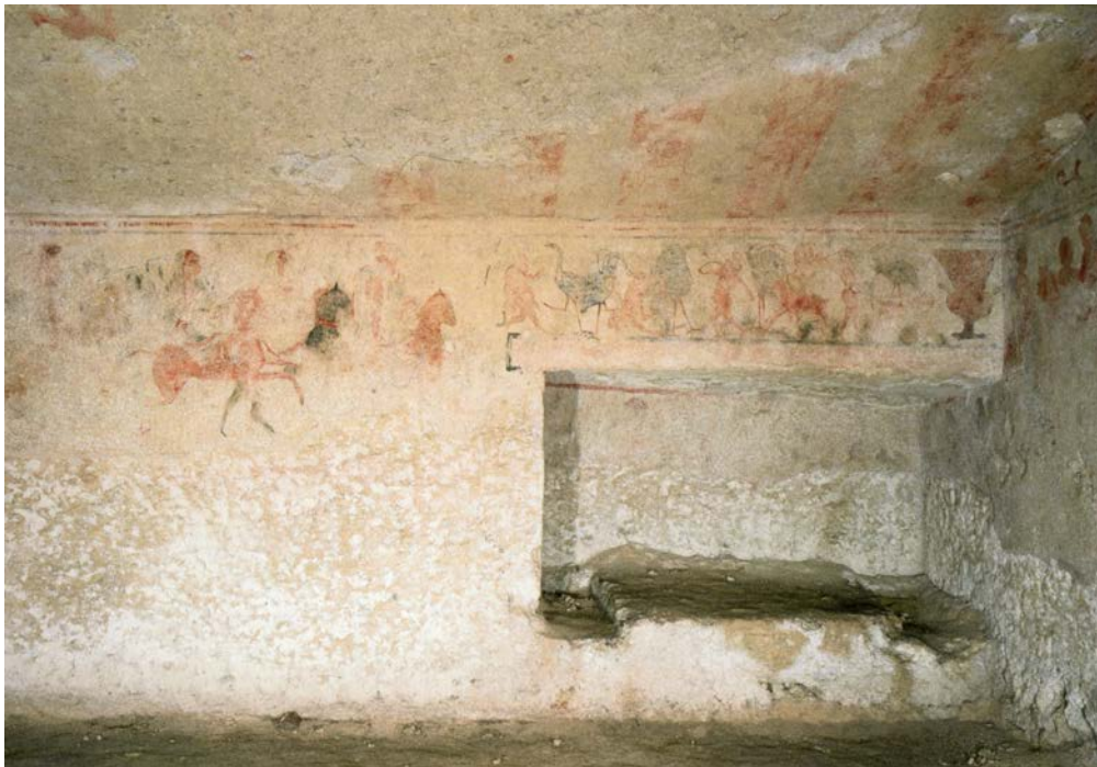
Figure 6. Tarquinia, nécropole de Monterozzi, tombe des Pygmées, première moitié du IV e siècle av. J.-C. Dessin d'après C. Weber-Lehmann, « La Tomba dei Pigmei: addenda et corrigenda II », Pittura parietali, pittura vascolare, Ricerche in corso tra Etruria e Campania , Atti della giornata di studio (Santa Maria Capua Vetere, 28 mai 2003), éd. F. Gilotta, Naples, 2005, p. 93-100, fig. 4, p. 96.

La paroi droite, à l'enduit peint très mal conservé devait comporter une scène de procession comme le suggère la présence d'un personnage vêtu d'un manteau pourpre précédé d'un desservant — scène qui constitue, pour M. Harari 21 , la plus ancienne représentation d'un porteur de faisceau. Le cortège est suivi d'une représentation scénique courant au-dessus d'un loculus quadrangulaire, qui devait recevoir une sépulture. La paroi gauche comprend la même structure, débutant par la représentation du cortège de cavaliers interprété comme une illustration de