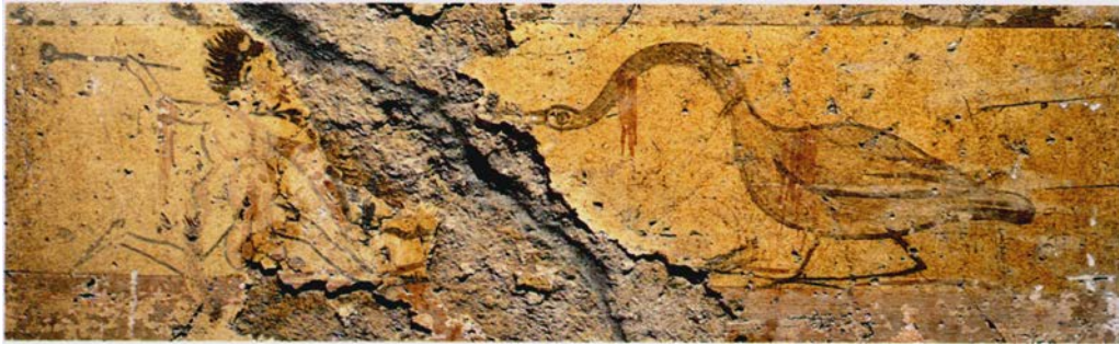
Figure 11. Poseidonia/Paestum, nécropole de Capaccio Scalo, tombe 1/1964, milieu du iv e siècle av. J.-C. D'après A. Pontrandolfo, A. Rouveret, Le tombe dipinte di Paestum , Modène, 1992, p. 276, fig. 3.

Le même thème apparaît d'ailleurs dans une tombe lucanienne de Poseidonia/Paestum, la tombe 1/1964 de la nécropole de Capaccio Scalo (Figure 11), datée du milieu du iv e siècle av. J.-C. Pour A. Rouveret 32 , ce type de scènes parodiques peut être mis en rapport avec des représentations scéniques préfigurant l'atellane ou la comédie phlyaque connues pour le monde italique. Le schéma choisi pour représenter la géranomachie adopterait des procédés de mise en scène empruntés à la comédie. A. Rouveret propose ainsi de voir dans certaines scènes de géranomachie le reflet de pratiques scéniques relevant de la parodie — parodie de chasse, de combat guerrier ou parodie de triomphes militaires. Dans la tombe tarquinienne, la géranomachie pourrait ainsi constituer un pendant parodique de la danse armée de la paroi droite.