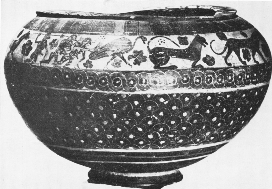
Figure 8. Dinos conservé à Bâle, Antikenmuseum, inv. Z194, attribué au Pittore della Fiasca del Pellegrino, dernières décennies du VII e ou du tout début du VI e siècle av. J.-C. D'après G. Camporeale, La caccia in Etruria , Rome, 1984, pl. XVIa

Le traitement parodique du mythe serait donc connu en Étrurie dès la fin du VI e siècle av. J.-C. Sur le vase François, plusieurs combattants sont figurés à terre et l'un d'eux est piqué par le bec d'une grue — deux formules de mise en scène reprises dans la tombe tarquinienne. La figure du Pygmée en elle-même est traitée par les imagiers étrusques comme un élément transgressif dès l'époque archaïque. Le décor du dinos conservé à l'Antikenmuseum (Figure 8) de Bâle, daté des dernières décennies du VII e ou du tout début du VI e siècle av. J.-C., constitue la plus ancienne attestation d'une représentation d'un combat collectif contre un oiseau géant. Cette chasse qui se déroule sur l'épaule du vase s'insère dans une scène de poursuite comprenant également des fauves, plus habituels dans les scènes cynégétiques de cette période. Si G. Camporeale rattache cette scène au répertoire chypriote, qui fournit un exemple de poursuite de volatiles, plusieurs détails paraissent néanmoins préfigurer les représentations postérieures du combat entre les Pygmées et les grues et notamment son traitement humoristique. Les poursuivants, ithyphalliques, semblent en effet pourvus d'un sexe postiche.