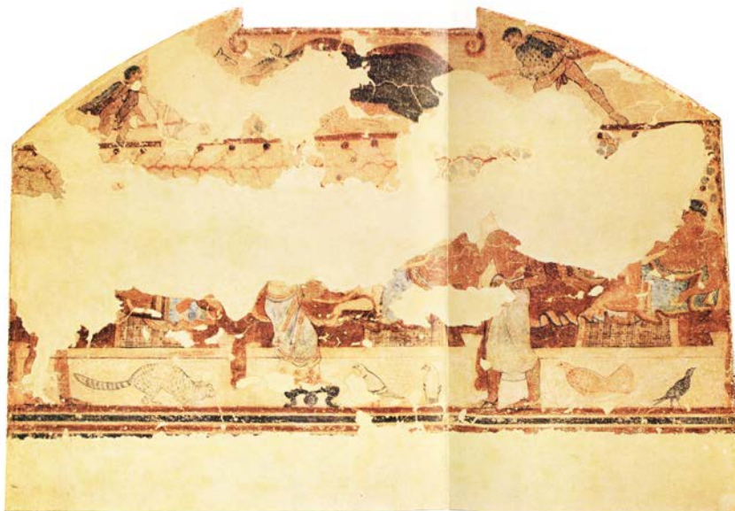
Figure 12. Tarquinia, nécropole de Monterozzi, tombe de la Laie noire, vers 460 av. J.-C., d'après S. Stopponi, La tombe della « Scrofa Nera » , Rome, 1983, pl. 3.

Une autre scène développée dans une tombe tarquinienne pose la question de la réinterprétation du mythe grec, ou plutôt d'un schéma iconographique emprunté au répertoire visuel grec, adapté en contexte étrusque, notamment en y ajoutant une dimension sexuelle exacerbée. Son identification et son interprétation moins aisées peuvent être éclairées à la suite des dossiers précédemment analysés.