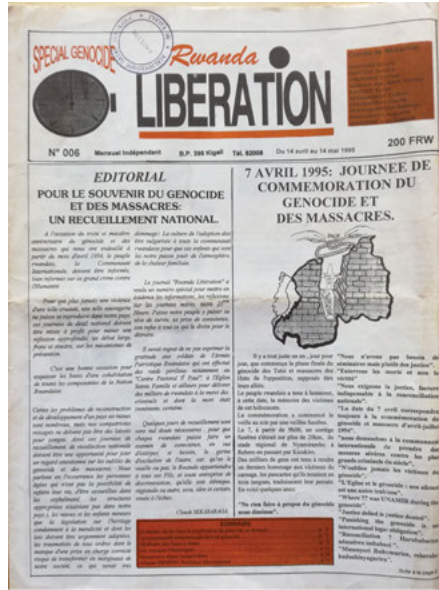
Fig. 2: Presse d'opposition et presse post-génocide.