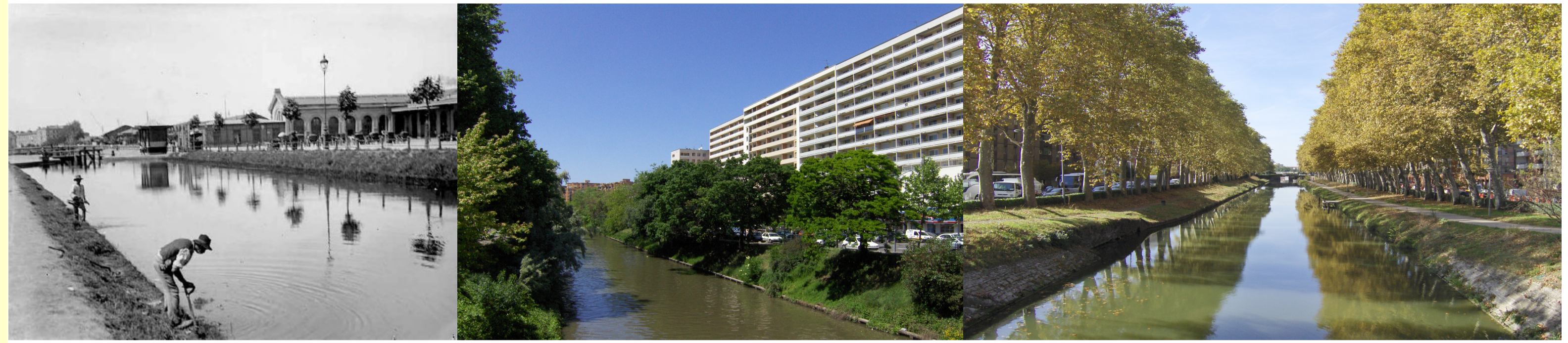
(Intro. a, b, c) - Le canal du Midi, entretien des berges en 1901 face à la nouvelle gare Matabiau – 2010, été, Pont de Lyon, Pont Jumeaux, un espace public touristique remarquable, aménagé par la main de l'homme depuis le XVIIe siècle par Pierre-Paul Riquet.

Il faut comprendre les relations complexes et parfois ambiguës entre les efforts d'une mairie pour réaliser des aménagements paysagers sur les berges du Canal du Midi à partir de la pratique de la gestion différenciée et le ressenti (perçu/vécu) de la population. Une nouvelle politique environnementale veut faire du Canal du Midi un corridor écologique et donc un nouveau paysage urbain de la vie quotidienne à interpréter et à évaluer. Sur plus de 2 kilomètres, notre enquête à partir d'interviews de 124 personnes porte sur le tronçon Pont des minimes/Pont Jumeaux entre les deux voies urbaines boulevard de l'Embouchure et de la Marquette, entre septembre 2009 et novembre 2010.