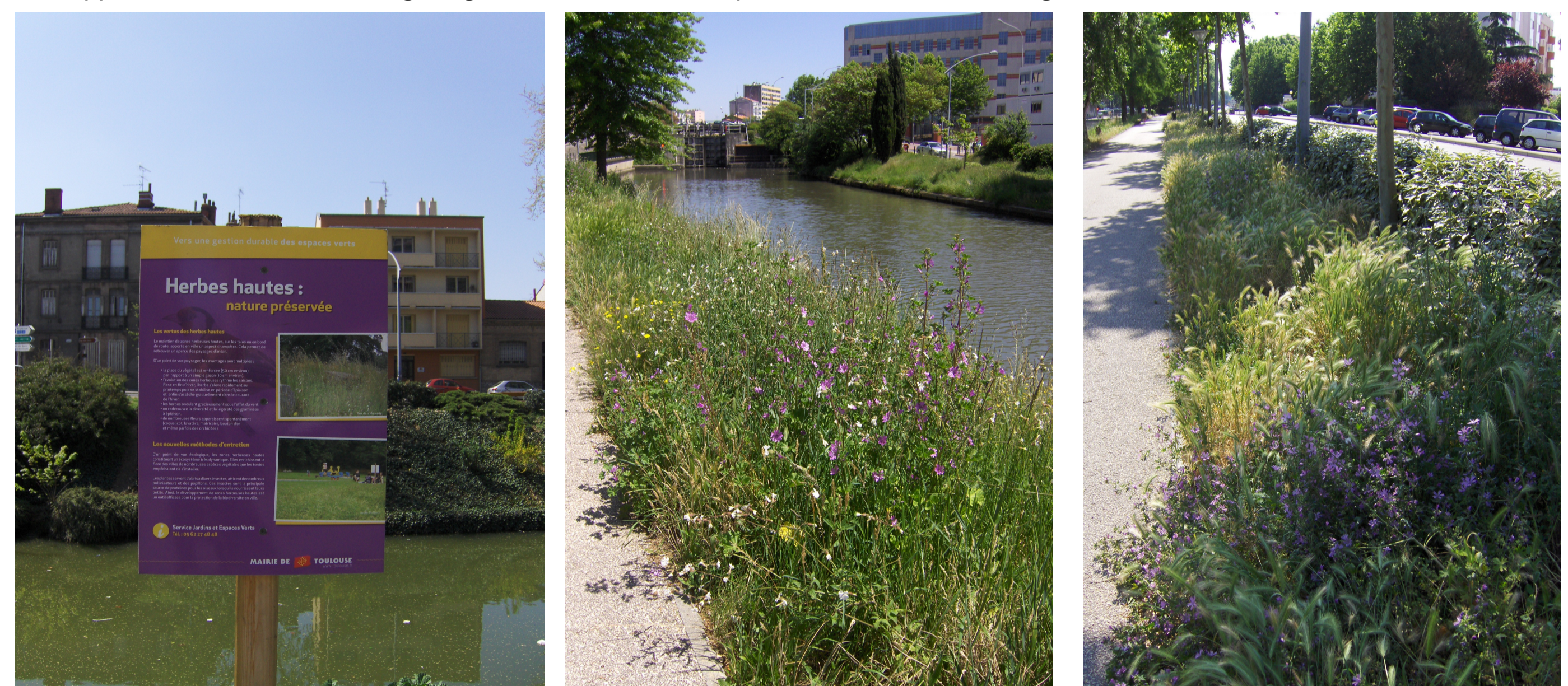
(II, a,b,c,d,e – été 2010) - Canal du Midi, panneau pédagogique, herbes hautes, sentiers et abords dégradés.

La gestion différenciée (2008) propose un nouveau paysage urbain pour une trame verte et bleue réunies le long du boulevard de l'embouchure. Il est pourtant plus de 35 % des personnes interrogées qui n'ont pas perçus le changement, la tonte unique, la floraison des herbes sauvages, le non ramassage des feuilles mortes et les panneaux d'affichages pédagogiques ainsi que les évolutions saisonnales. On constate depuis un an et demi l'apparition d'une prairie humide et la pousse de jeunes arbres comme les saules, ormes, aulnes le long des berges. Le sauvage et le régulier s'affrontent et pose problème aux citoyens qui font des corrélations à partir de leur connaissance ou non de la campagne avec cependant plus 40 % du panel qui estiment que ce n'est en rien un paysage agréable et préfèrent les anciennes configurations paysagées. Une opposition homme/femme sur la perception de ce paysage est à noter ; paysage champêtre et agréable pour les hommes, sale et anarchique pour les femmes (résultats à confirmer). Les pêcheurs du Canal du Midi se plaignent du manque d'information, de la curiosité de transformer radicalement, à leur yeux et propos un «biotope» qu'ils estimaient maîtrisé.