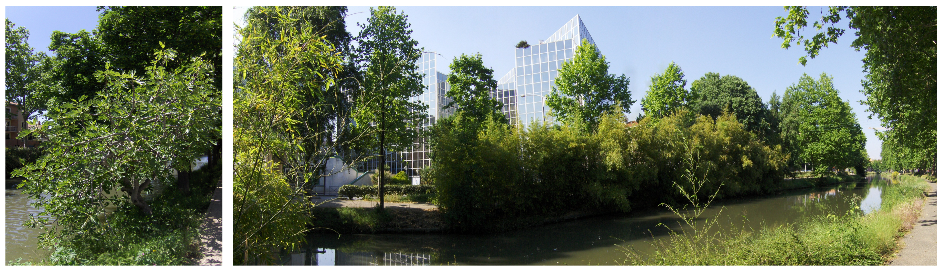
(III, a,b) Secteur Central Parc, 2010, que faire des haies de roseaux et des figuiers?

Mais alors, que faire des figuiers, des catalpas (espèces invasives), des murs de roseaux de plus de 4 mètres de haut (implantés pour cacher la circulation automobile/immeuble), des nombreuses feuilles mortes des platanes et herbes jaunies des premières prairies (végétaux protecteurs pour les insectes) ainsi que des cyprès, petits buissons, petites haies endommagées non remplacées et percées donnant le sentiment que le chemin de promenade latéral donne de plus en plus sur la route et la circulation? On procède au cas par cas en fonction des désirs du service espace vert tout en prenant en compte les retours critiques.