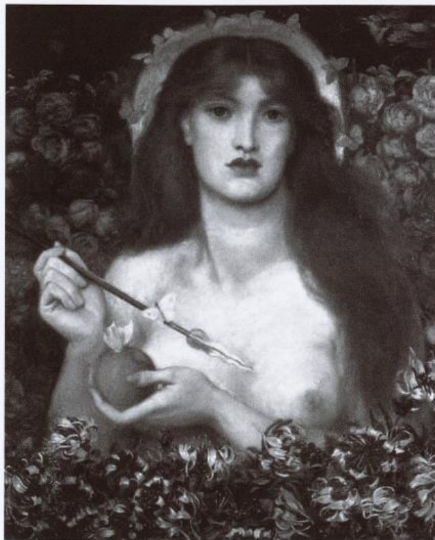
Dante Gabriel Rossetti, Venus Verticordia , 1864 Óleo sobre lienzo, Russell-Cotes Art Gallery & Museum, Bournemouth

L'image doit enfermer dans sa structure même une thèse néantisante. Elle se constitue comme image en posant son objet comme existant ailleurs ou n'existant pas . Elle porte en elle une double négation : elle est néantisation du monde d'abord (en tant qu'il n'est pas le monde qui offrirait présentement à titre d'objet actuel de perception, l'objet visé en image), néantisation de l'objet de l'image ensuite (en tant qu'il est posé comme non actuel) et du même coup néantisation d'elle-même (en tant qu'elle n'est pas un processus psychique concret et plein). 18