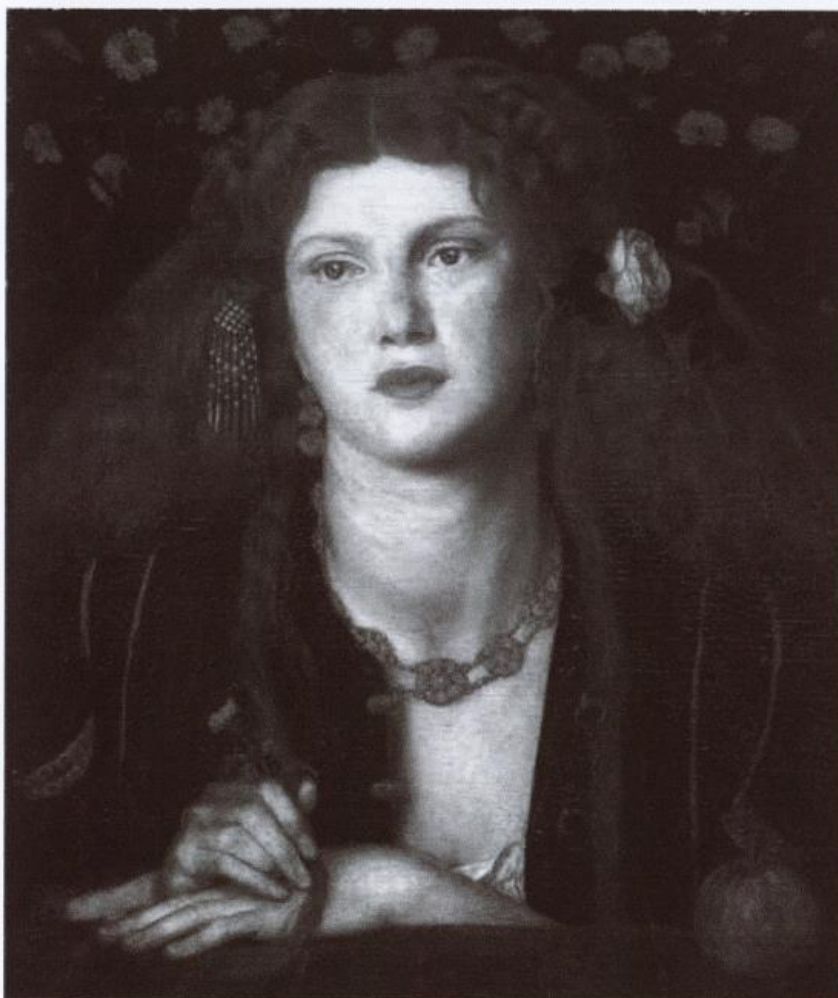
Dante Gabriel Rossetti, Bocca Baciata , 1859, Óleo sobre lienzo, 32 x 22 cm, Boston Museum of Fine Arts, Boston – D.R.

Pero la serpiente arrastra sus pies descalzos por la antesala de mi cuerpo antes de morir en mí (p. 43)