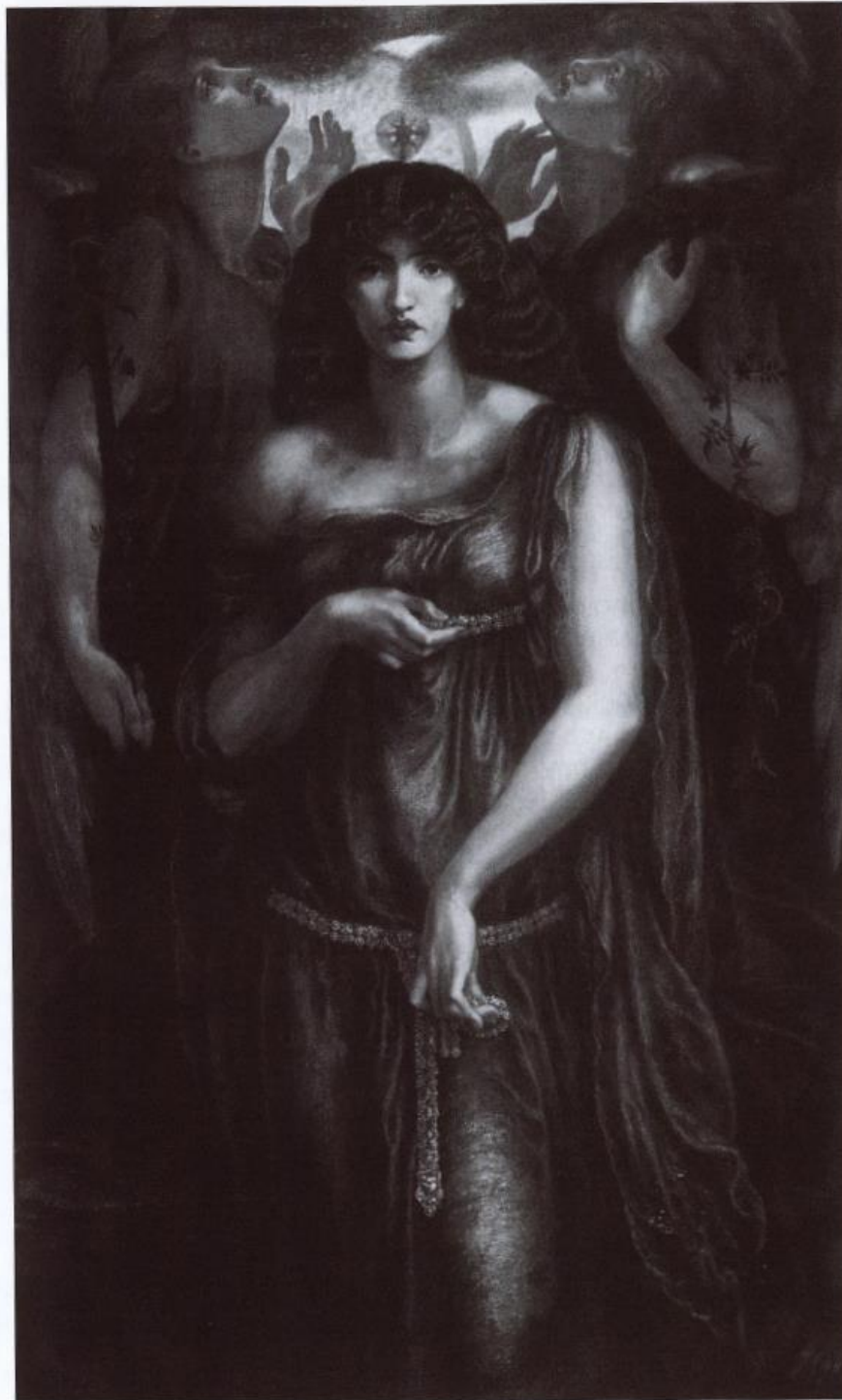
Dante Gabriel Rossetti, Astarte Syriaca , 1877, Óleo sobre lienzo, 183 x 107 cm, Manchester City Art Gallery

de los castos. Porque de todos modos han de inventarme los polígamos desvirgadores de la trinidad. Porque aún no sé quién soy he de embriagar mi cuerpo con el vino de los valientes. (p. 26)