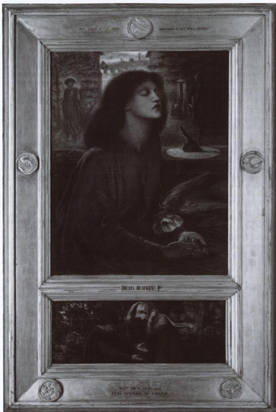
Dante Gabriel Rossetti, Beata Beatrix , 1863, Óleo sobre lienzo, 86 x 66 cm, Tate Gallery, Londres - D.R.

La prisión delicada de Beatriz Russo o el flujo de la seducción