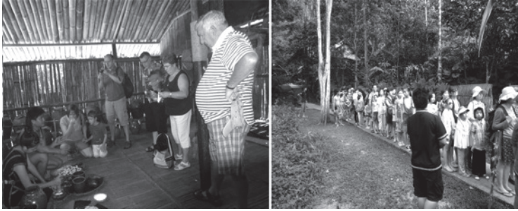
Figure 3. La production de l'alcool de riz. Figure 4. Les touristes attendent à l'entrée de la maison Murut.

L'accent mis par les guides sur la grande consommation d'alcool fort contribue à établir la distance entre un «eux» (primitifs, «alcooliques» et violents) et un «nous» (les touristes civilisés et pacifiques). Certains guides n'hésitent pas à jouer sur l'ambiguïté entre le passé et le présent, ajoutant que la bière a aujourd'hui remplacé l'alcool de riz, ce qui implique, avec la complicité amusée des touristes, que la consommation d'alcool n'a pas diminué 94 . Si les guides, le plus souvent Kadasan-Dusun eux-mêmes, ne s'émeuvent pas de cette présentation peu flatteuse c'est sans doute parce qu'ils aspirent à des emplois et un mode de vie urbain plutôt qu'à la défense des traditions. Ainsi, la typologie d'un affichage de «Soi» pour «Soi» définie par Bruner trouve ici une limite: le «Soi» du Passé et du monde rural peut être moqué par des membres du groupe qui aspirent à la «modernité» incarnée par un mode de vie urbain.