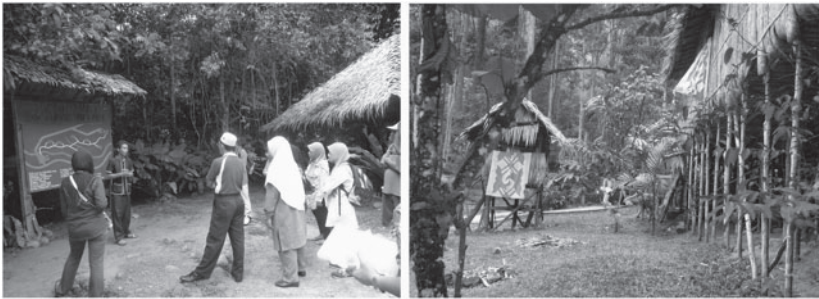
Figure 1 et 2: explications par le guide touristique et maison longue Murut.

Tout est fait pour que le village ressemble à un véritable village, où tout le monde participe à son activité quotidienne. Les acteurs ne vivent pas dans le village, mais arrivent le matin dans un bus collectif, avant les touristes. La plupart d'entre eux vivent dans un immeuble à la périphérie de Kota Kinabalu. La visite dure deux heures, suivie d'une pause d'une heure pour le déjeuner, avec un buffet. Il y a trois sessions par jour. Le voyage de Kota Kinabalu au village dure environ 25 minutes. Le village est situé sur le bord d'une rivière sur une pente, et n'est donc pas propice à l'agriculture. La taille du groupe de tourisme varie considérablement, de deux à plus de 35 personnes. Alors que les guides, tous des hommes, ont reçu un scénario à suivre pour chaque étape de la visite, les variations peuvent être très importantes d'un guide à l'autre. Vêtu d'une chemise traditionnelle Kadazan, le guide explique les règles de la visite aux touristes (il est interdit de fumer, de prendre des objets, de jeter des ordures, etc.) afin de ne pas contrarier les « esprits de la Nature ». Le guide choisit un chef de groupe parmi les touristes, un homme, la plupart du temps. Il doit montrer l'exemple et encourager les autres à participer aux activités du village. (cf. Figure 1 et 2).