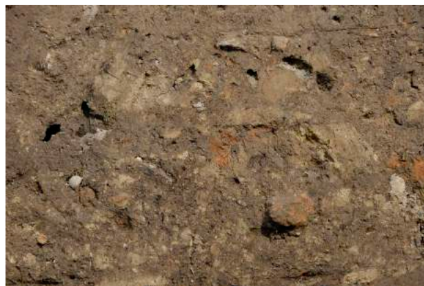
Figure 1 Taraschina, zone 2. Vue de détail du remplissage (essentiellement constitué de terre à bâtir) de la fosse 2010.

On observe donc l'existence, dans un environnement géologique très homogène en grande partie formé de lœss, d'une grande variabilité de témoins d'architectures en terre crue. Pour des raisons évidentes de conservation, notre étude porte uniquement sur les éléments rubéfiés et chauffés, les seuls ayant pu être prélevés et conservés après un séjour prolongé dans le milieu humide que constitue le delta du Danube.