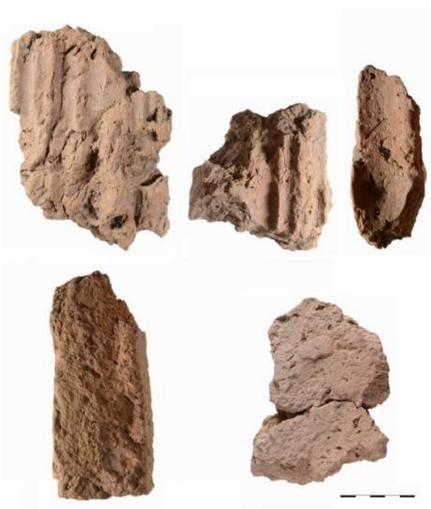
Figure 6 Taraschina. Fragments de divers types de terre à bâtir de la zone 2.

Sur la base de cette classification typo-fonctionnelle, nous avons quantifié l'ensemble des éléments de terre crue collectés dans chaque unité fouillée (tabl. 1). Les critères de collecte sont bien évidemment liés à la taille ; les éléments dont le module est inférieur à 2 x 1 x 0,5 cm n'ont pas été pris en compte. La fragmentation, et notamment la sur fragmentation au moment de la fouille et du conditionnement,