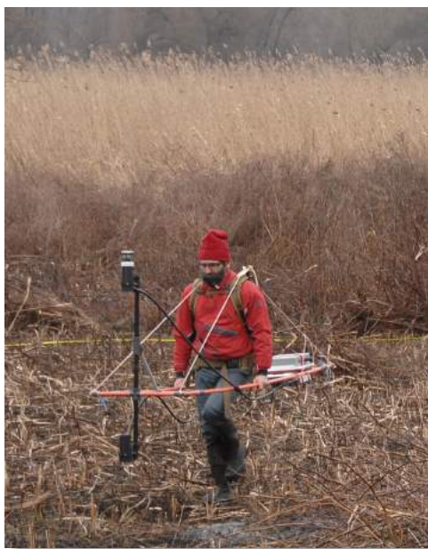
Figure 3 Prospections géophysiques sur le site de Taraschina (LIENSs).

Parallèlement à ces prospections, nous avons réalisé des mesures géophysiques in situ , par diagraphie, à l'intérieur des trous de carottage. On doit à François Lévêque et l'équipe Lienss de l'Université de La Rochelle d'avoir développé les matériels et la mise en œuvre de ce dispositif de mesure innovant. Le couplage entre cartographie de surface des anomalies magnétiques et évaluation de leur nature – nature des unités stratigraphiques, composition, texture... – a ainsi permis de caractériser les anomalies et de les interpréter. La systématisation des carottages tubés, prélevés sous forme de deux transects, a livré des informations essentielles tant sur la morphologie du milieu dans lequel la communauté chalcolithique de Taraschina s'était installée, que sur la dynamique de formation du site. La description systématisée des unités sédimentaires et leur interprétation fonctionnelle nous donne une image très précise de la dynamique de l'habitat et des étapes de l'édification du tell. Ces carottes fournissent également des informations paléo-écologiques permettant d'identifier des activités contribuant à mieux appréhender l'économie des communautés agro-pastorales de Taraschina. Elles constituent également une archive conservée pour partie en chambre froide, qui permettra dans les années à venir de poursuivre les investigations au fur et à mesure de l'évolution de nos questionnements.