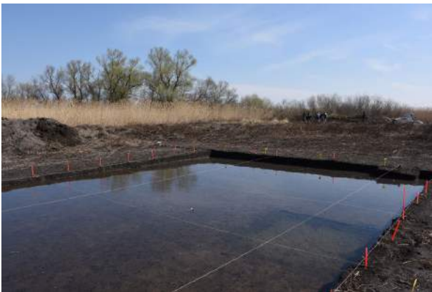
Figure 2 La zone 2 du site de Taraschina entièrement submergée.

En 2015, une fois la fouille de la zone 2 achevée, la réalisation d'une campagne de prospection géophysique extensive a permis de dresser une carte des anomalies magnétiques sur l'ensemble de la surface du site et ainsi de déterminer l'emplacement d'une nouvelle zone de fouille (zone 3). Les conditions environnementales de la prospection réalisée en 2015 ont été optimales et l'équipe a pu réaliser un débroussaillage intégral de la surface du tell. La méthode mise en œuvre en 2015 se caractérise par un couplage entre capteurs et station totale en mode « tracker » (fig. 3). Ce dispositif, calé sur Modèle numérique de Terrain (MNT) du tell de Taraschina, a permis de disposer d'une cartographie à très haute résolution spatiale.