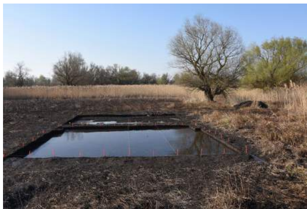
Figure 2 Vues des zones 2 et 3 de Tarschina, en cours de fouille.