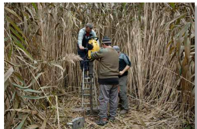
Figure 3 Carottage sur le site de Taraschina, à l'aide du Cobra TT.

En ouvrant la zone 2, notre objectif était la reconnaissance d'une aire où, comme sur la zone 1, se concentrent fosses et silos. Ces concentrations, correspondant à un espace fonctionnel non dévolu à l'habitat,