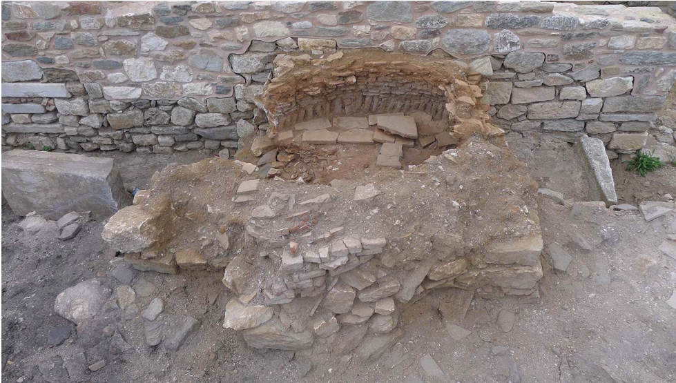
Fig. 10. DOM5, ESP23 : le four STU197, avec la réparation de son côté ouest.