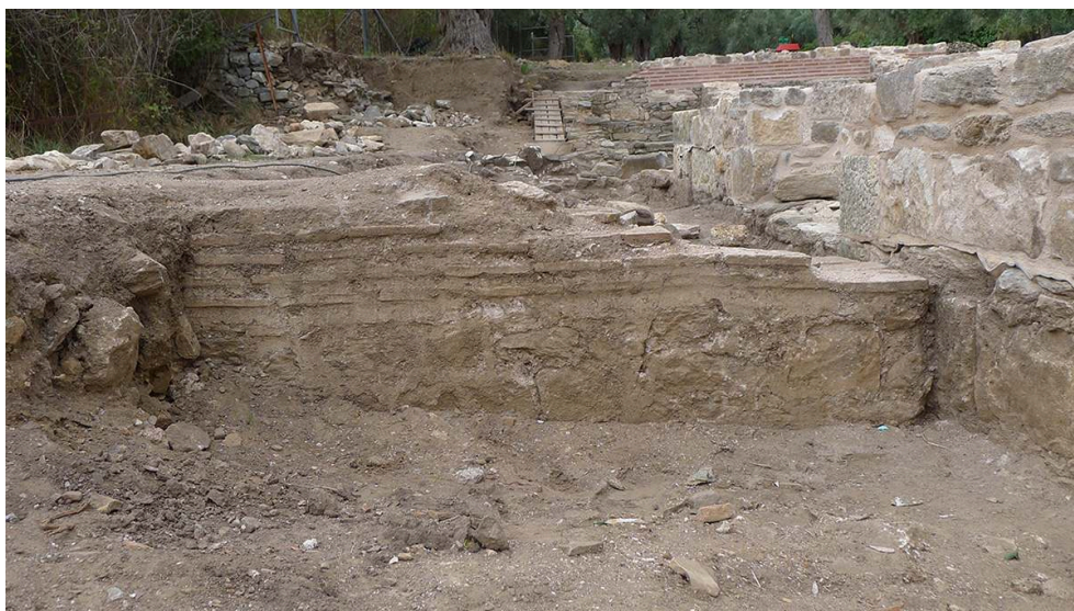
Fig. 16. MUR102, parement ouest ; à droite, MUR52.