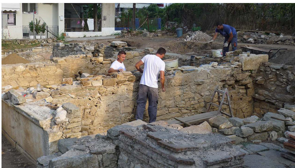
Fig. 17. Les maçons au travail : consolidation du refend MUR196 entre PCE55 et PCE20.