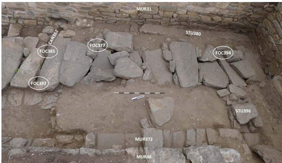
Fig. 6. RUE1 / ESP12 : situation des vestiges de l'atelier ATL81 et autres structures.