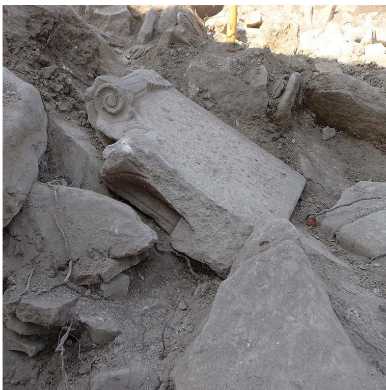
Cl. EFA/A. Muller.