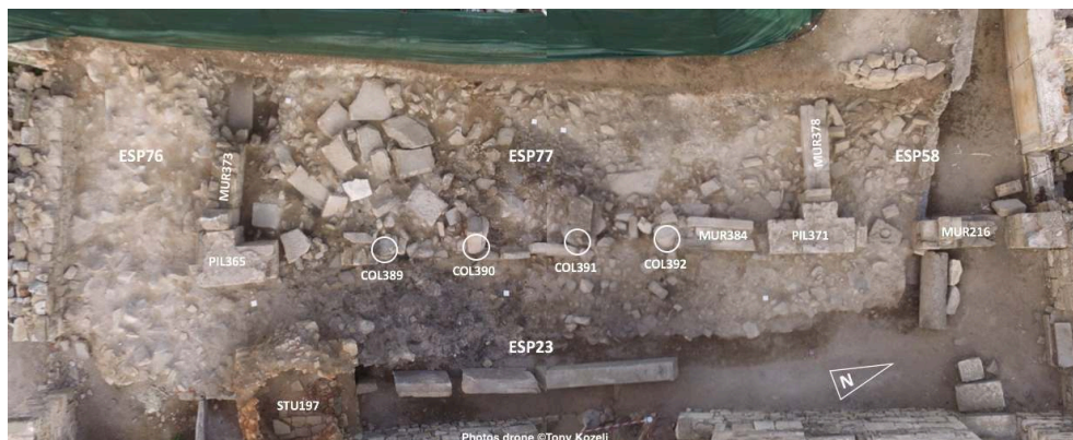
Fig. 7. DOM5, cour péristyle en fin de fouille.

sols des portiques et de la cour centrale ESP77. On pourra alors établir un phasage de la cour péristyle en relation avec les états successifs déjà connus de DOM5 (P3P2, P3P3 et P3P4).