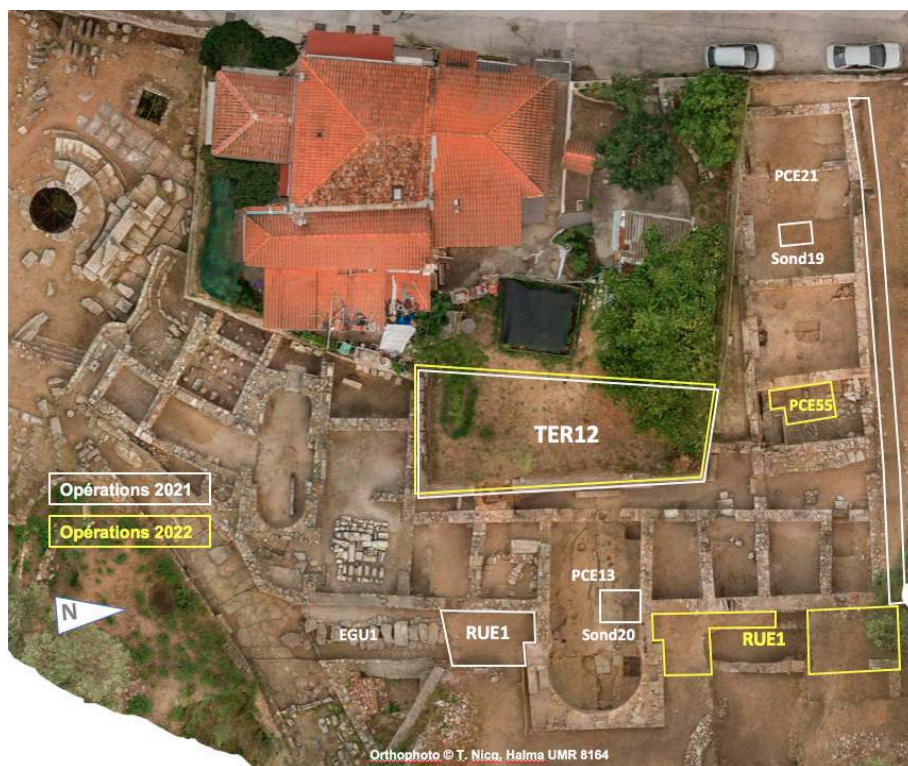
Fig. 1. Programme 2021-2022, implantation des travaux 2021.