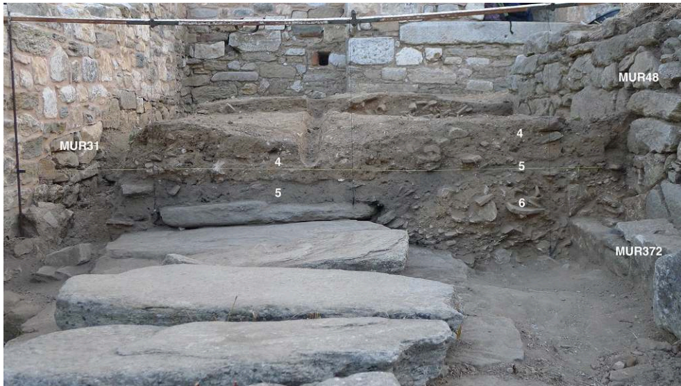
Fig. 5. RUE1. Coupe 2.