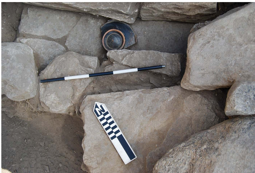
Fig. 4. RUE1. L'affluent CAN362 à sa jonction avec EGU1.