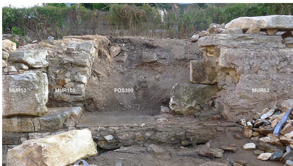
Fig. 15. Tête du MUR102 apparente dans la perturbation récente FOS399 qui a percuté MUR52.