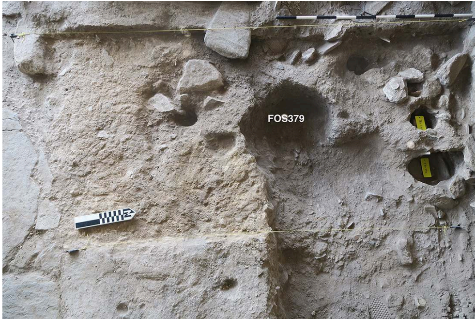
Fig. 9. Sondage 20 dans PCE13 : le creusement FOS379 entouré de trous de poteaux.

travaux d'agrandissement du triklinos PCE13 un profond décaissement qui l'a rabaissé de la cote \pm 7,20 m à \pm 6,60 (P3P2S3 ; BCH 138, 2014, p. 626). Des traces de ce chantier ont d'ailleurs été retrouvées en PCE13, dans les niveaux supérieurs du sondage 20 : des sols de travail recouvrent un trou de poteau TRO386 et sont eux-mêmes percutés par un grand trou rond FOS379 entouré d'une série de cinq trous de poteaux (TRO375, TRO376, TRO381, TRO382, TRO383) qui s'ajoutent aux trois déjà reconnus auparavant dans l'emprise du sondage (fig. 9) : on retrouve là les phases du chantier (P3P2S2-S1) analysées naguère (BCH 138, 2014, p. 626-632).