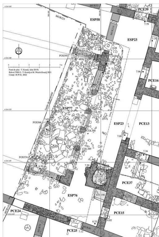
Fig. 8. DOM5, cour péristyle, plan, état à la fin de campagne 2021.