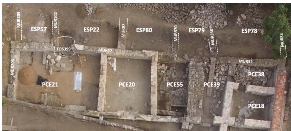
Fig. 14. Murs et espaces au nord de l'aile nord de DOM5.