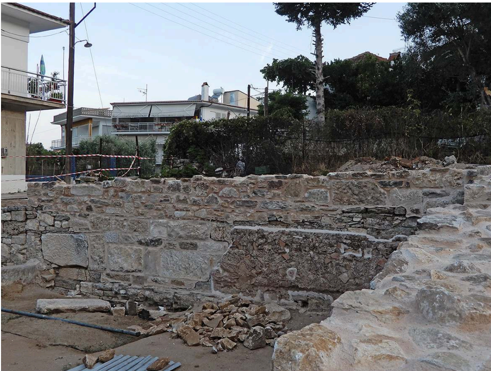
Fig. 21. PCE21, le MUR52 avec la lacune comblée et le mortier du placage consolidé.