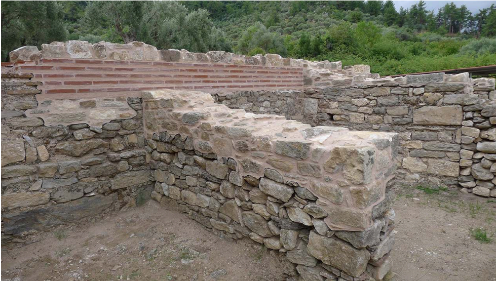
Fig. 20. Le MUR18 avec l'arase de briques reconstruite.