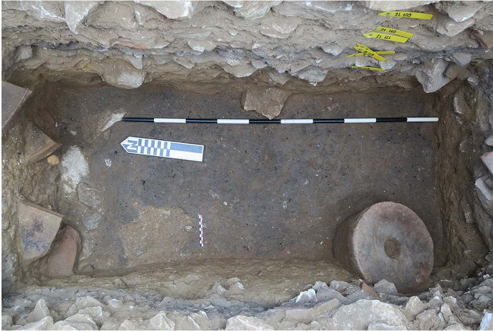
Fig. 2. Sondage 19 dans PCE21, le vase 21.116.004 à l'envers in situ , l'USI 21.117.