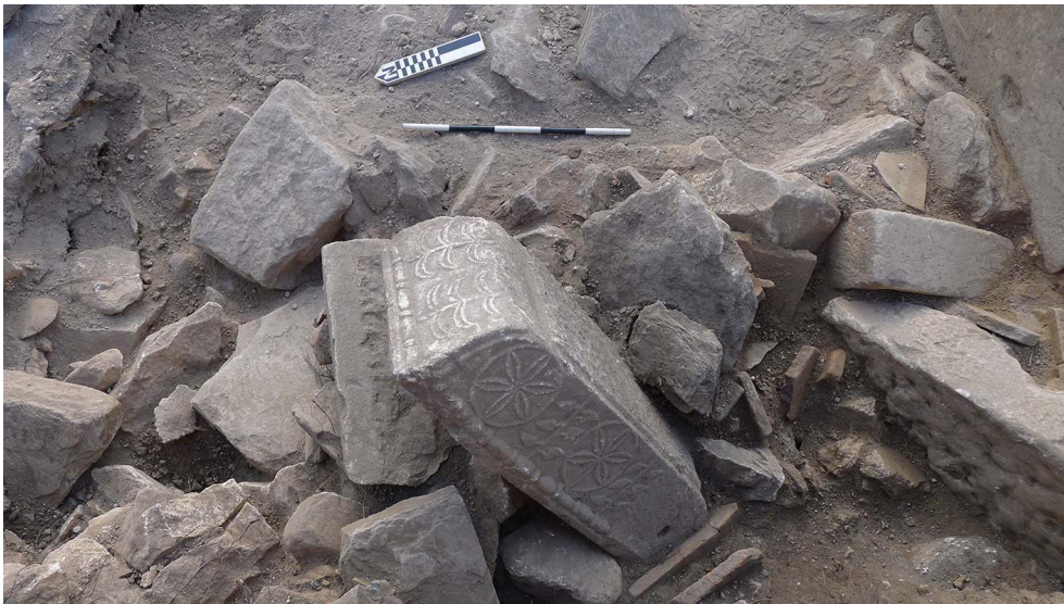
Fig. 13. Console à rosace et rameaux 21.014.007 dans la couche de destruction.