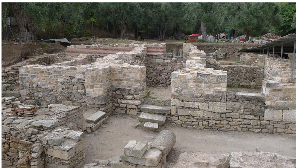
Fig. 18. DOM5, partie nord de l'aile est : façades consolidées de PCE16-PCE17-PCE18.