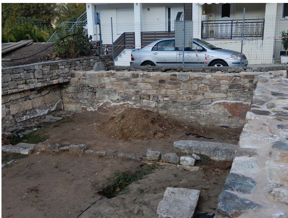
Fig. 19. PCE21, MUR208 consolidé, avec ses enduits.