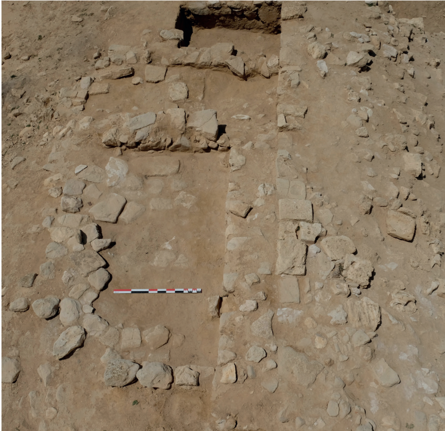
Figure 4. Plinthine/ Kôm el-Nogous, vue des pièces dallées PCE 602 et PCE 603 depuis le sud.

que sur 2 à 3 assises au maximum. Ils étaient construits en blocs de pierre locale (calcarénite) de 10 à 15 cm de côté, liés à la terre. Les murs mesurent 50 cm d'épaisseur, à l'exception de MR 606 et MR 608, épais de 40 cm seulement, et de MR 653, la limite ouest des pièces PCE 604 à 607, qui mesure 67 cm de large. En raison de ce qui est observé partout ailleurs à Plinthine, on peut restituer une élévation en briques crues au-dessus de ces soubassements en moellons. Même si la présence de voûte ne peut être exclue, les espaces de l'édifice recevaient certainement des toitures plates vue la faible épaisseur des murs 5 . Pour les mêmes raisons, le bâtiment en lui-même ne devait pas posséder d'étage.