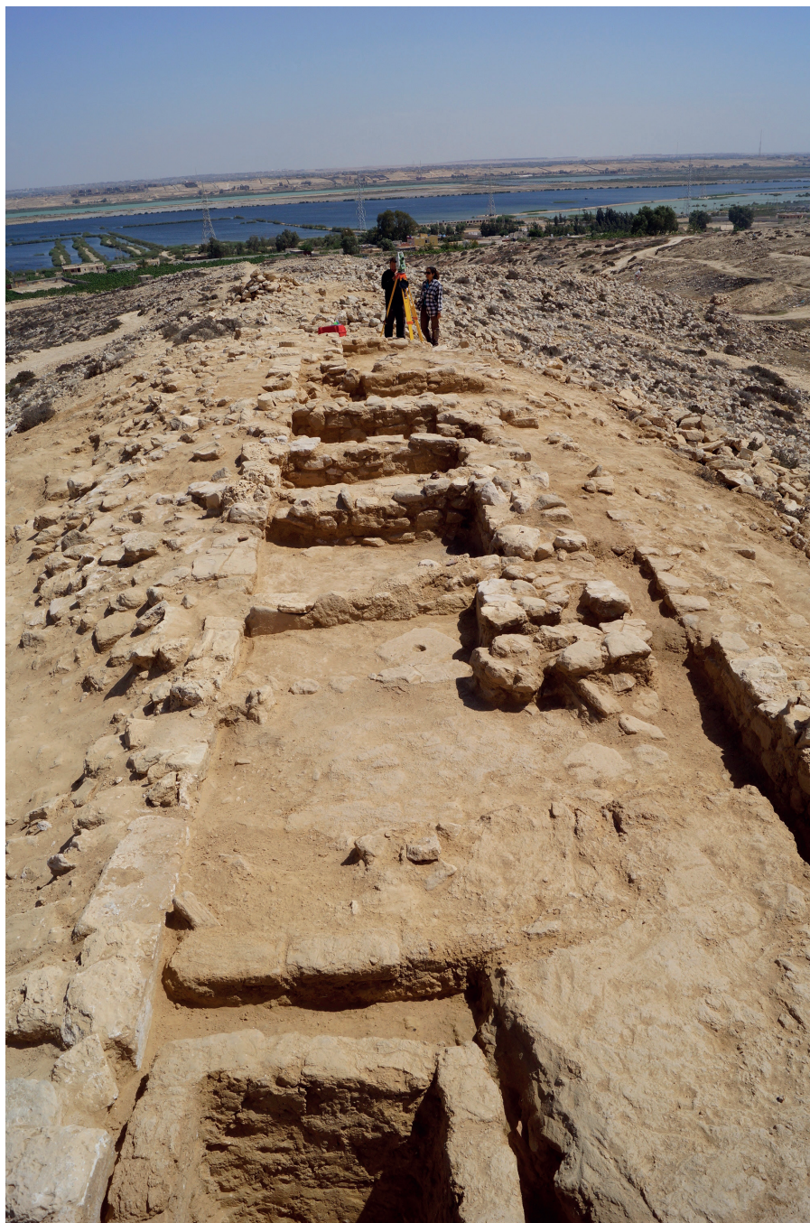
Figure 3. Plinthine/Kôm el-Nogous, vue d'ensemble de BAT 603, appuyé contre MR 601, depuis le nord.

la grande construction BAT 604 s'est installée directement contre les pièces PCE 604 à 609 à l'ouest, détruisant les constructions qui auraient pu y être localisées.