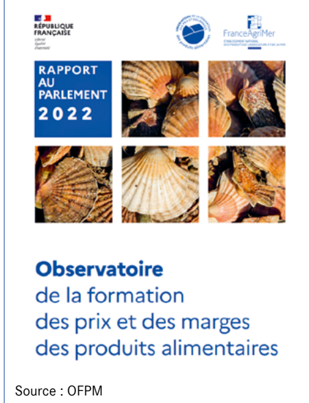
Figure 1 - Couverture du rapport au Parlement 2022

permanente de 4 équivalents temps plein et la contribution des spécialistes des filières concernées. L'établissement traduit en programme et méthodes de travail les attentes du comité de pilotage et de son président.