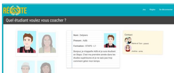
Figure 2 : Bibliothèque d'étudiants virtuels

Le jeu « Réussite » se singularise par l'exploration de l'apprentissage à travers la confrontation des points de vue divergents. En effet, il propose de décentrer la problématique de soi. Il ne s'agit pas directement de la réussite du jeune lui-même mais de la réussite d'un étudiant virtuel. Selon Wittorski, « professionnaliser un individu, c'est faire en sorte qu'il prenne de la distance par rapport à son action » (Wittorski, 2008, p. 31). L'étudiant virtuel est un interlocuteur capable d'opposer son point de vue au coach. Ainsi, le jeu offre un moyen de décentrer l'étudiant pour ensuite le centrer sur son projet de réussite. Il permet de le distancier de la problématique afin de mieux la circonscrire, et ainsi d'échapper à l'injonction à la réussite en laissant une place à l'erreur. Nous pensons également que c'est un moyen de favoriser la réflexivité et l'appropriation de la méthode.