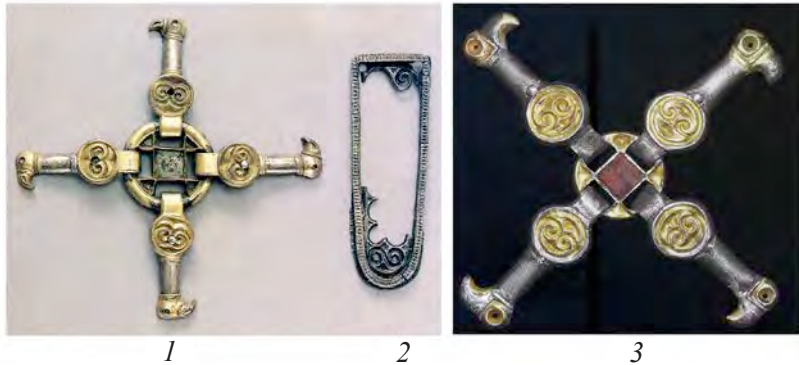
Ил. 3. Скандинавские находки со спиралевидным декором и их параллели: 1, 2 – Шёруп (по: Germanen, Hunnen und Awaren... Kat. XI, 9.c, e); 3 – происхождение неизвестно (по: Fabech C., Näsman U. Sösdala... Fig. 3)

место с престижными вещами середины – второй половины V в. 22 (ил. 3, 1, 2). Похожий соединитель с волнообразным декором происходит с аукциона в Англии 23 (ил. 3, 3).