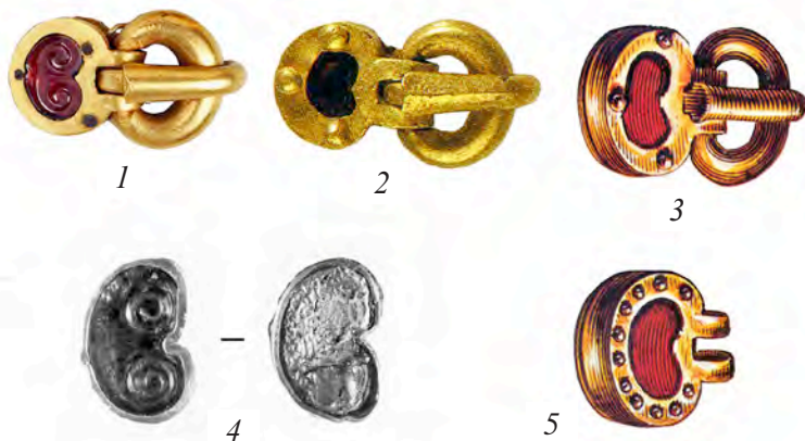
Ил. 1. Керченские вещи с резным инкрустированным декором и параллели: 1, 4 – Керчь (по: Eger C. Goldene Zeitalter... , Kat. 38; Damm I. Goldschmiedarbeiten... Abb. 214–215); 2 – Сегед-Надьсекшош (по: Kürti B. Fürstliche Funde... Kat. III, 25); 3, 5 – Турнэ, могила Хильдерика (по: A l'aube de la France. La Gaule de Constantin à Childéric. Paris, 1981. Cat. 410. Fig. 178)