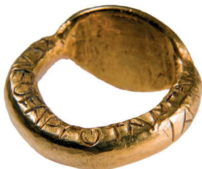
Fig. 3. Jonc de l'anneau (fin de l'inscription B) (© MNIR, Bucarest, inv. 10616).