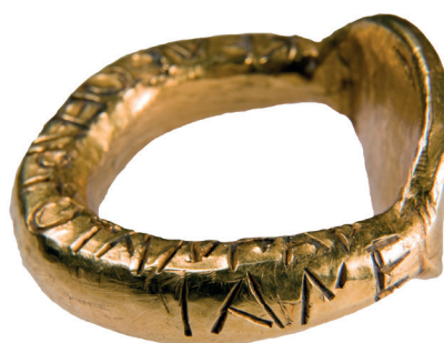
Fig. 4. Jonc de l'anneau (détail de l'inscription B) (© MNIR, Bucarest, inv. 10616).

Deux inscriptions en caractères grecs ornent l'anneau, indiquant par leur paléographie le milieu du V e siècle av. J.-C., ce qui est corroboré par le contexte historique: