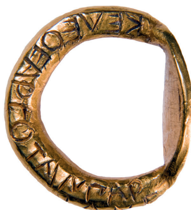
Fig. 2. Jonc de l'anneau (inscription B) (© MNIR, Bucarest, inv. 10616).