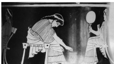
Fig. 7. Pyxis attique attribuée à Pistoxénos.

courante représente la femme de profil, tenant un miroir vu de face. Dans l'autre main, un autre attribut lui fait parfois écho (flacon/parfum, foulard brodé) – cf. dans notre cas une fleur; ce sont tout autant d'objets-signes montrés comme des prolongements du corps féminin, témoignant de son charme naturel, sa charis . 26