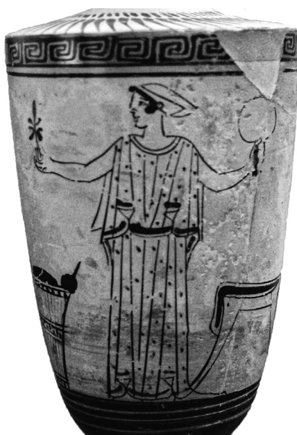
Fig. 6. Lécythe attribué au « Peintre d'Icare » (© AGORHA, cliché F. Lissarrague).

lamine d'or de Tarente de la fin du V e siècle présente l'inscription ΔΩΠΟΝ – renvoyant à la pratique du cadeau, δῶρον – à côté d'une figure féminine (en chiton et himation ), assise sur un diphros , qui soulève de la main gauche une couronne et tient un miroir dans sa main droite, tendue vers le bas. 20 Un lécythe attique de la première moitié du V e siècle, attribué au peintre Syriskos, figure une jeune femme désirable assise sur une chaise à décor floral avec pose-pied, en face d'un homme drapé; elle tient de ses mains une couronne, alors qu'un perdrix est posé sur ses genoux; autour d'elle, d'autres accessoires féminins complètent l'espace domestique: un alabastré, un panier et un miroir suspendu (Fig. 5). 21 Un autre lécythe attique à fond blanc, attribuée au « Peintre d'Icare », du milieu du V e siècle, montre une jeune fille debout dans un espace intérieur, délimité par une chaise et une corbeille à laine, regardant la fleur qu'elle tient dans la main droite, alors que dans la main gauche elle tient un miroir (Fig. 6). 22 Le parallèle le plus frappant apparaît sur une pyxis attique à figures rouges attribué à Pistoxénos (vers 480–470), figurant trois groupes de femmes; l'une des femmes est assise sur une chaise à dossier ( klismos ) et tient de la main droite un miroir, dont la manche se termine par une double volute, alors que de la main gauche elle tient une fleur (Fig. 7). 23 Pour ne donner que des exemples de