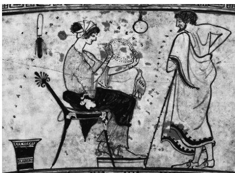
Fig. 5. Lécythe attribué à Syriskos.