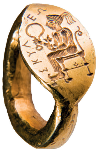
Fig. 1. Chaton de l'anneau (iconographie et inscription A) (© MNIR, Bucarest, inv. 10616).