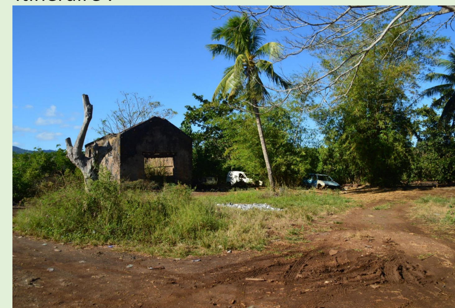
Début du parcours

Entrée de la pointe : vestiges d'une usine sucrière. Site patrimonial menacé par les déchets