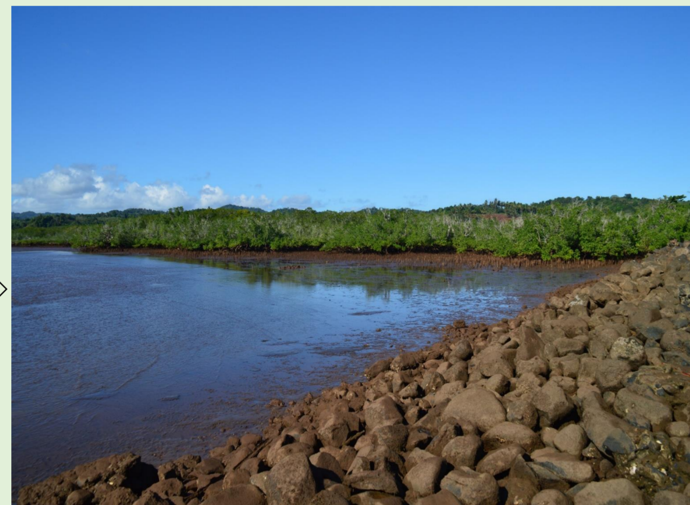
Fin du parcours

Entrée de la pointe : vestiges d'une usine sucrière. Site patrimonial menacé par les déchets