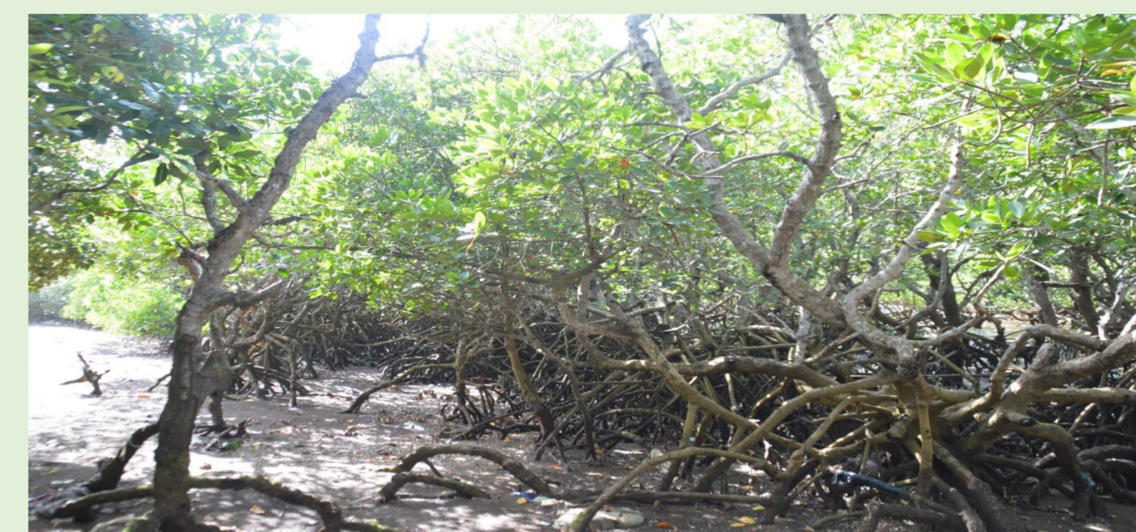
Passage par la mangrove de Passamainty

Forêt de M'pewka en cours de revégétalisation