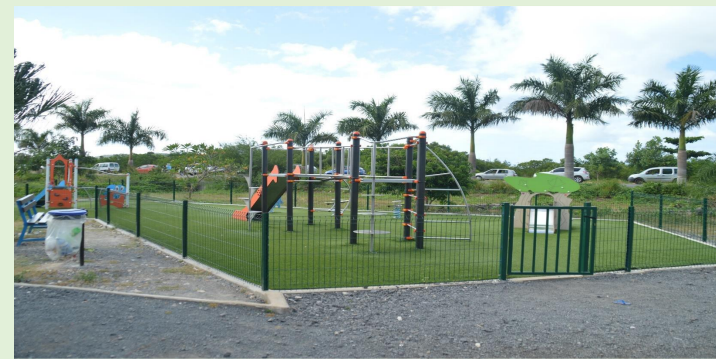
Début du parcours