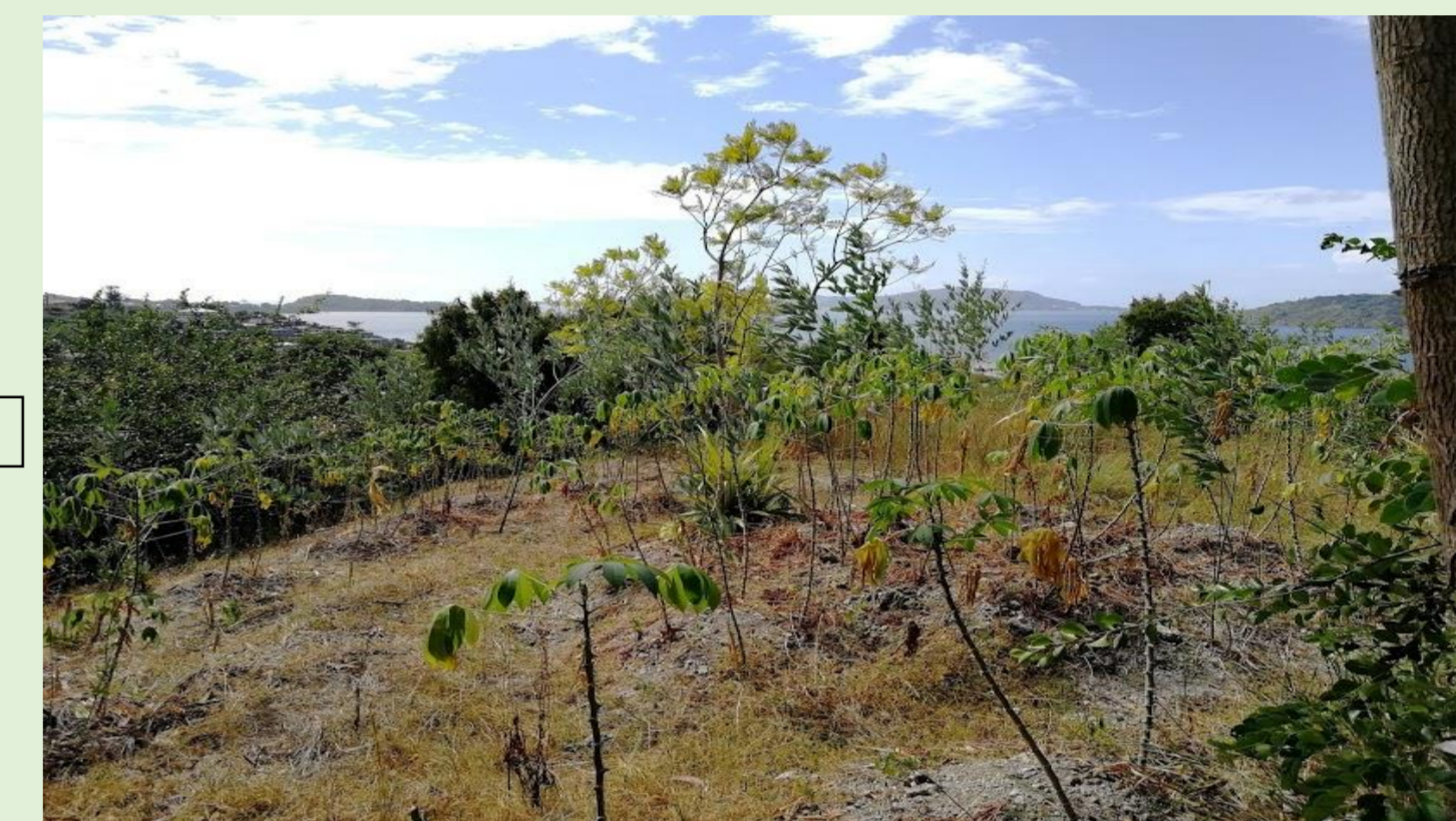
Fin du parcours

Forêt de M'pewka en cours de revégétalisation