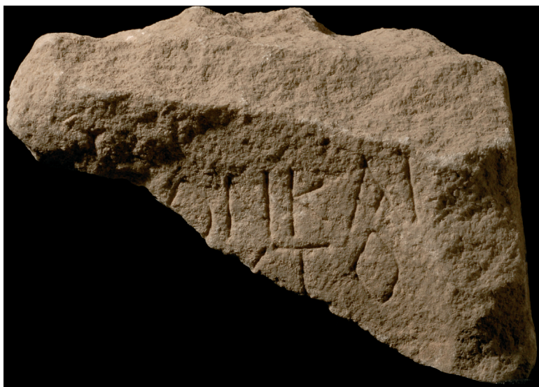
Fig. 6. Inscription n° 4

Ce fragment de marbre, brisé de toute part (fig. 6), sauf à droite, appartenait manifestement à une base de statue 22 . L'inscription est gravée dans un cadre en saillie, dont l'angle supérieur droit est conservé. Le bandeau formant la partie supérieure du cadre conserve également des traces de lettres avec apices . Le fragment fut découvert le 8 août 1951, devant le portique Sud-Est ( GTh 17 a).