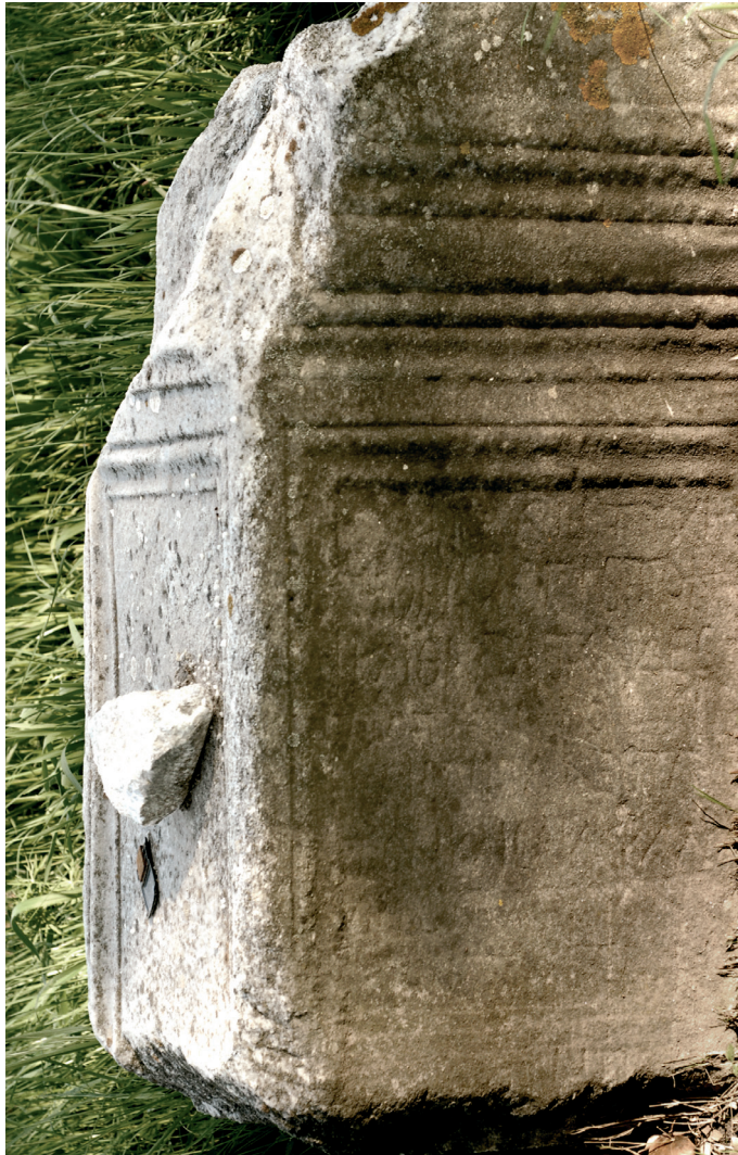
Fig. 2. Inscription n° 1

À la bonne fortune. Notre très grand et très divin maître, le très noble César Flavius Valerius Constance, la cité des Thasiens (l'a honoré).