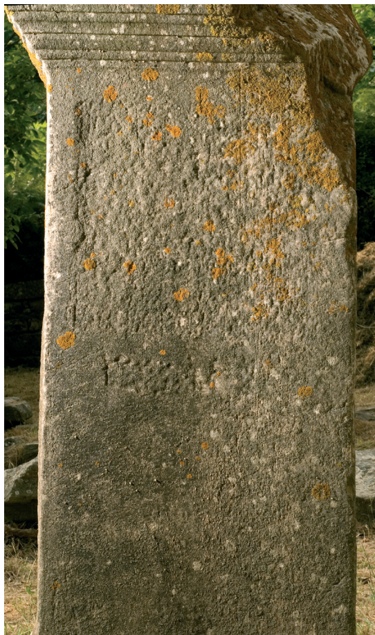
Fig. 5. Inscription n o 3

Seules les traces des deux premières lignes se devinent encore aujourd'hui, sur une surface dégradée par l'exposition à l'air libre depuis l'époque de la fouille. Croyant distinguer le nom Οὐαλέριον dans la partie basse de l'inscription, aux l. 8-9, Chr. Dunant et J. Pouilloux envisageaient qu'on y ait nommé plusieurs personnages, avant de juger que «la présence de cette