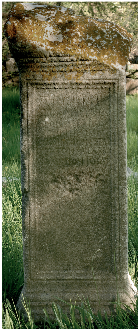
Fig. 3. Inscription n° 2

Cette grande base monolithe de marbre (fig. 3 et 4) est conservée presque intégralement 13 . Seule la face supérieure est partiellement endommagée. La base comporte des moulures évasées dans sa partie basse comme à son couronnement, sur la face antérieure comme sur les deux faces latérales. La face postérieure, non moulurée, devait être adossée à un édifice. L'inscription est disposée dans un cadre mouluré, reproduit également sur les faces latérales. La face supérieure comporte deux mortaises pour la fixation des pieds d'une statue en bronze, de taille naturelle ou légèrement plus petite.