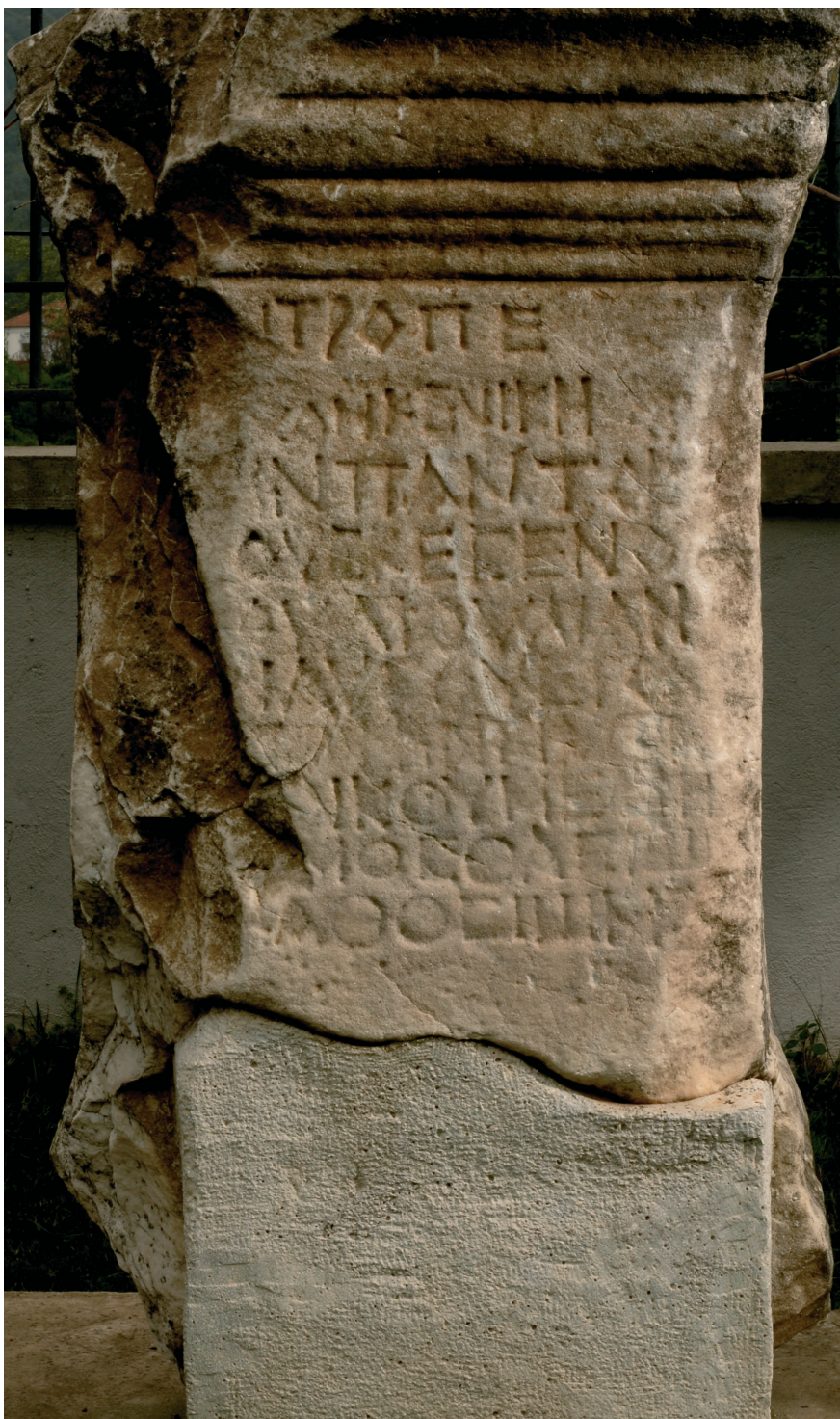
Fig. 7. Inscription n° 5