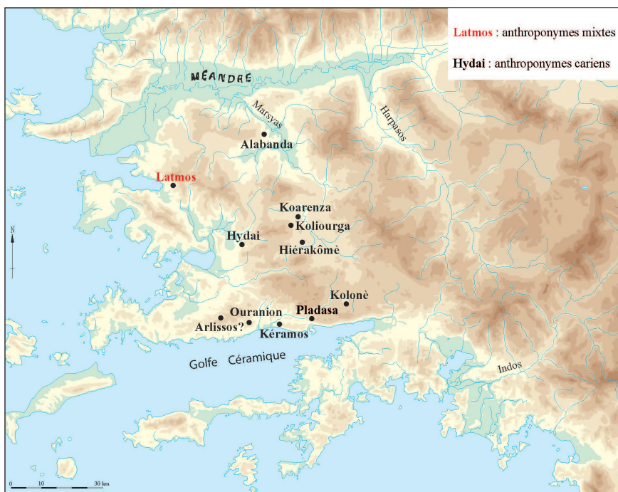
Carte 4. Communautés mentionnées dans HTC, 91

La seconde liste couvre un territoire plus vaste que la première, englobant une région bien moins maritime, allant de Latmos et Alabanda au nord jusqu'au golfe Céramique au sud avec pour centre de gravité Mylasa. La comparaison entre les deux listes est édifiante : la seconde ne livre, exception faite des premières lignes où le nom des communautés n'est pas lisible, que des noms à consonance indigène.