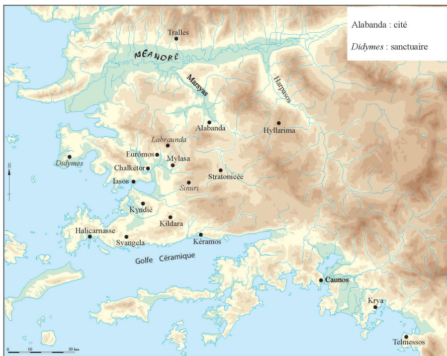
Carte 2. Lieux de découverte des inscriptions cariennes en Asie Mineure (hors Égypte)