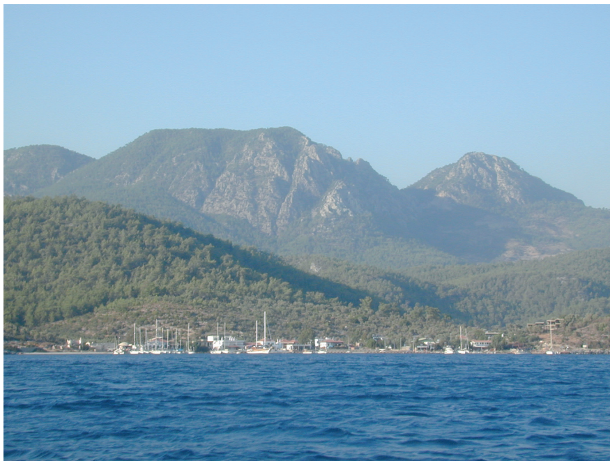
Fig. 1. À droite, le site élevé du Karaman Tepe, centre de l'habitat des Kodapeis .

est dominée par des montagnes souvent abruptes. Le pays passait d'ailleurs pour être peu praticable aux chevaux 20 . Depuis la mer et notamment depuis le golfe Céramique se dresse une barrière montagneuse, à peine échancrée par endroits. Certes, elle n'est pas infranchissable en tout point, mais ces falaises donnent une illustration pratique à l'expression d'Aristophane pour lequel les Cariens étaient des habitants des hauteurs 21 . Le site du Karaman Tepe (fig. 1), juché sur un piton dominant le golfe Céramique du haut de ses 773 mètres d'altitude à quatre kilomètres à peine à vol d'oiseau de la mer, impressionne par son aspect abrupt et inhospitalier. C'est pourtant là que la communauté des Kodapeis , tributaire des Athéniens, vivait à l'époque classique 22 .