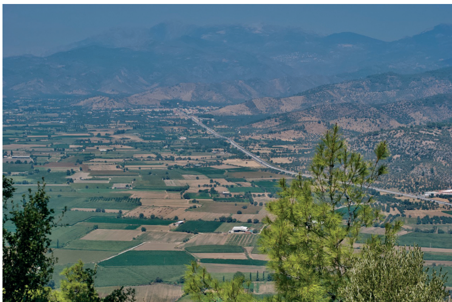
Fig. 2. La plaine de l'Eurômide.

La Carie est traversée par des rivières et des fleuves affluents méridionaux du Méandre (l'Harpasos, le Marsyas). Il en résulte un relief découpé en larges plateaux élevés (parfois de plus de mille mètres de hauteur) et terres basses rares, souvent réduites aux plaines alluviales lesquelles, tel le fond du golfe Céramique, étaient peu mises en valeur dans l'Antiquité. Mais il y avait des plaines intérieures fertiles comme celle autour d'Eurômios (l'Eurômide des textes hellénistiques 27 – fig. 2), ce qui explique l'énorme prélèvement de cent talents que fit Alcibiade en croisant dans le seul golfe Céramique et la réputation proverbiale de richesse de la région : selon Philostrate, dont l' acmè se situe au début du III e siècle de notre ère, les figues servaient à nourrir le bétail 28 . D'autre part, plusieurs cités cariennes ont, au moins dès le V e siècle av. J.-C., développé un monnayage d'argent et plus encore ont frappé au siècle suivant un monnayage de bronze en même temps que leurs homologues grecques 29 . Les plus importants sites habités étaient situés sur le bord de la mer ou dans son proche arrière-pays et, pour le sujet qui nous occupe, il est tout à fait certain que deux Carie s'opposent, la Carie maritime et la Carie intérieure : la question d'une hellénisation éventuelle ne se pose évidemment pas dans les mêmes termes pour l'une et pour l'autre.