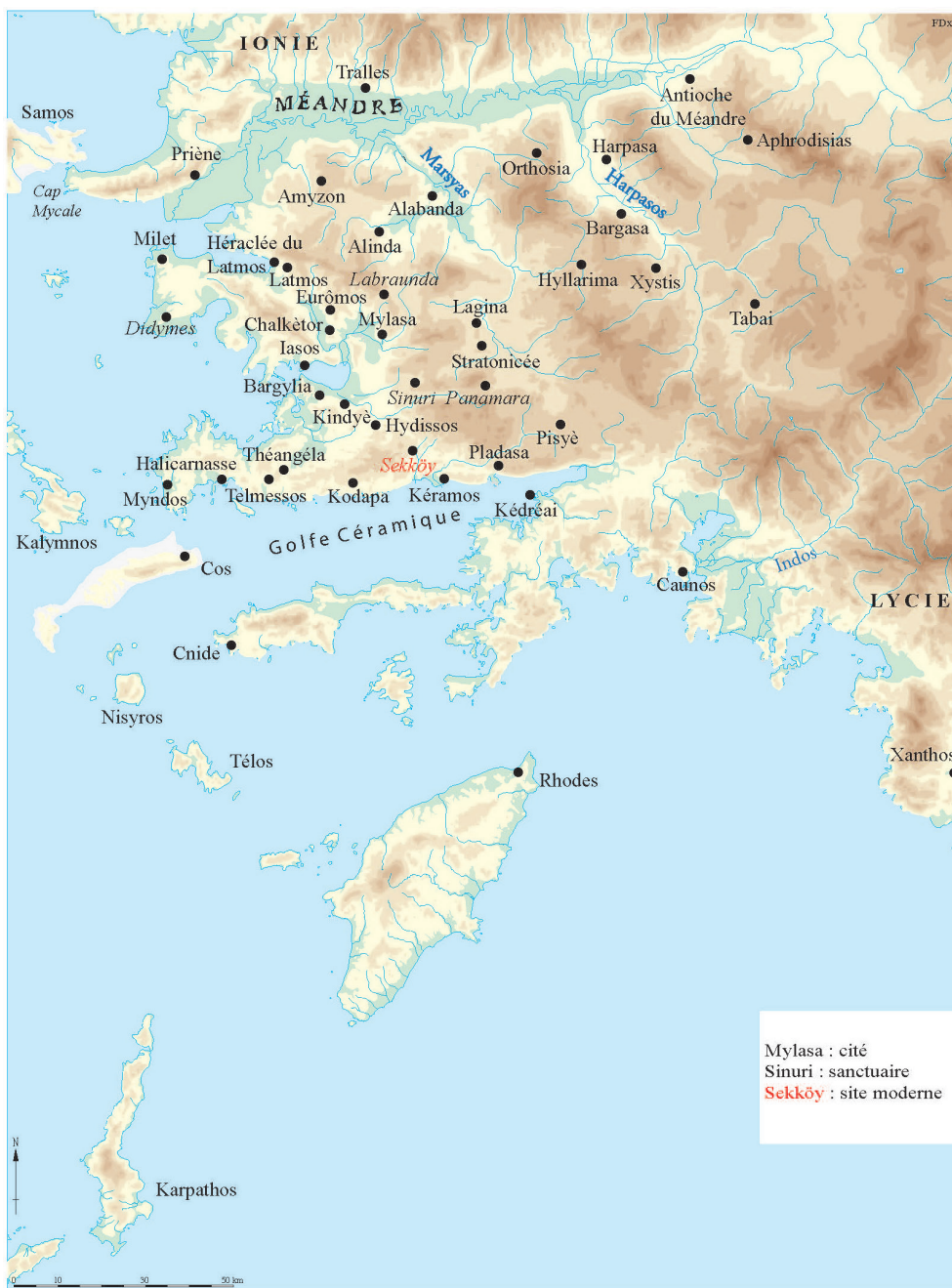
Carte 1. La Carie et les îles adjacentes

La Carie, telle qu'elle est constituée au IV e siècle en satrapie sous l'autorité de Mausole, est un monde passablement mal connu des Grecs à l'exception de la région côtière. Sa définition