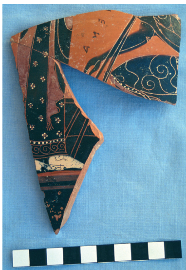
Fig. 2: Fragment d'amphore attique à figures noires: Achille et Ajax jouant en présence d'Athéna (ca 520 a. C.). Fouilles du palais d'Amathonte.

nom d'Aphrodite qui n'y apparaît qu'une seule fois 134 . Il en va de même des dieux masculins 135 . Tout laisse penser que l'assimilation des divinités cypriotes aux dieux grecs ne se réalise que très lentement et n'est définitivement acquise qu'à l'époque hellénistique. Des équivalences entre la Grande Déesse de Chypre et des divinités féminines grecques sont alors établies (Aphrodite, bien sûr, mais aussi Athéna, Artémis, Héra, etc.); c'est aussi le cas du Grand Dieu masculin 136 . Au demeurant, à l'époque des royaumes, ces phénomènes d'assimilation ne privilégient pas les dieux grecs puisqu'ils s'opèrent tout aussi bien avec des divinités phéniciennes (Apollon-Reshef, Héraclès-Milqart, Athéna-Anat, la Grande Déesse-Astarté). Dans sa monumentale étude, Anja Ulbrich est d'avis que, à l'exception d'Athéna, les différentes formes iconographiques d'une déesse féminine renvoient à une seule et unique divinité, sous ses divers aspects: la Grande Déesse de Chypre 137 . Il en va sans doute de même pour le Grand Dieu 138 .