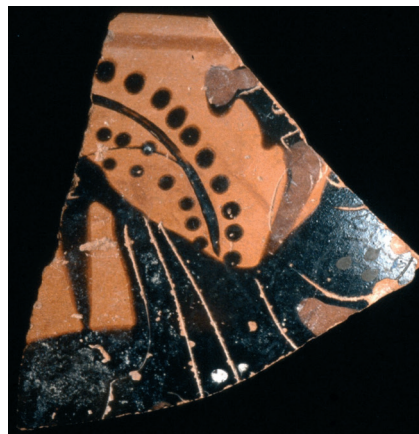
Fig. 5: Fragment de coupe attique à figures noires : Dionysos brandissant le keras (1 er quart du v e siècle a. C.). Fouilles du palais d'Amathonte.