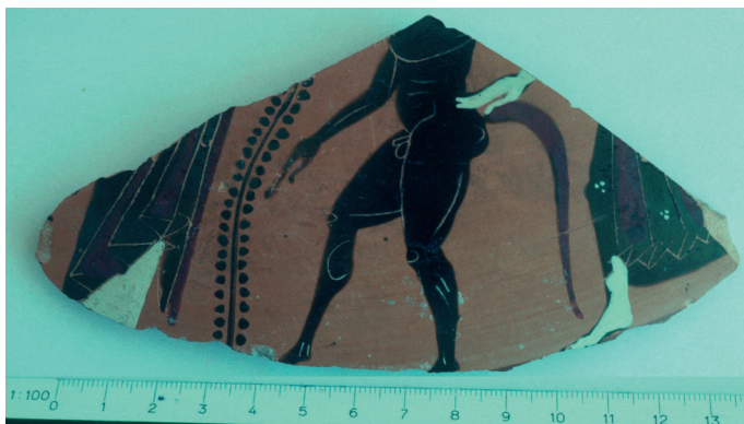
Fig. 6: Fragment de cratère (ou psykter?) attique à figures noires : satyre et Ménéades (?) (ca 520/10 a. C.). Fouilles du palais d'Amathonte.

Au terme de cette trop brève étude, comment résumer ces diverses considérations ? On constate que, si Chypre participe de plus en plus à l'hellénisme au cours des v e et iv e siècles, la situation diffère certes selon les royaumes, mais surtout selon chacun des plans de rationalité. Ainsi, à l'époque d'Eschyle, un certain Kyprios charaktér imprègne les divers plans : depuis le début de l'Âge du Fer, la langue grecque prédomine, mais dans sa variante arcado-cypriote, dont les spécificités devaient frapper les Grecs égéens ; c'est seulement à partir du v e siècle, et peut-être assez tardivement, que le grec attique conquiert l'île, en même temps que prédomine l'écriture alphabétique. Néanmoins, tous deux finissent par s'imposer même à des cités non hellénophones. Sur le plan technique, le style grec, les artefacts égéens, sont importés ou imités, mais la civilisation matérielle insulaire