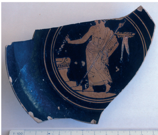
Fig. 4: Coupe attique fragmentaire à figures rouges : Apollon tenant une branche de laurier et déposant un rameau sur un autel (ca 450 a. C.). Fouilles du palais d'Amathonte.

que Dionysos et ses affidés ne sont pas absents de cette imagerie (fig. 5 et 6). Le phénomène de reconnaissance était donc en cours aux v e et iv e siècles au moins dans les cercles intellectuels ou théologiques proches du pouvoir 139 .