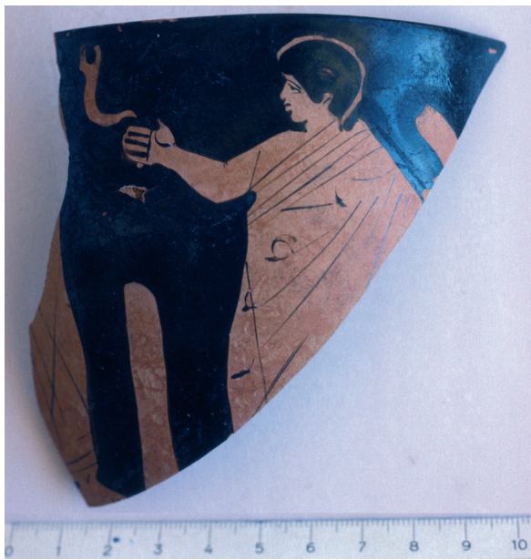
Fig. 1 : Fragment de skyphos attique à figures rouges : jeune homme au gymnase (ca 450 a. C.). Fouilles du palais d'Amathonte.

gout passionné pour la culture hellénique, mais parce qu'elles sont « à la mode », parce qu'elles constituent un signe de reconnaissance entre les élites politiques de Méditerranée orientale et que, par conséquent, elles relèvent d'un comportement de prestige nécessaire à l'affirmation de leur statut 85 . Chez Isocrate, le contraste entre une cité « barbarisée » que l'on observerait avant l'accession au trône d'Évagoras et la cité flambeau de l'hellénisme par la suite ( Évag. , 47-50) est artificiellement accentué et relève de l'emphase rhétorique ; de sorte que semble excessive et quelque peu empreinte