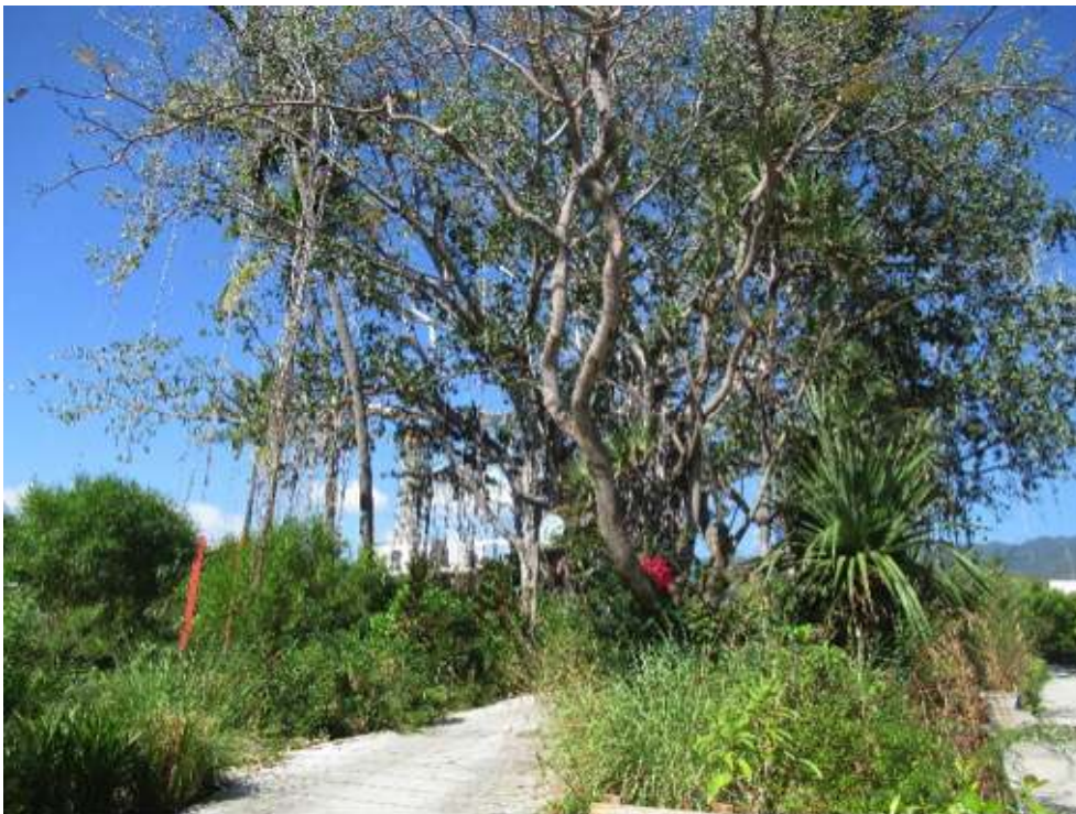
Photo 1. Promenade des Banians de l'écoquartier Cœur de ville à La Possession

Le centre-ville de Saint-André fait partie de la liste des quartiers prioritaires de la politique de la ville avec une concentration de ménages pauvres et de logements sociaux (Daudin et Lieutier, 2015). La commune est inscrite dans un programme national de renouvellement urbain, NPNRU, qui concerne 75 hectares de superficie (figure 5) (Groupement de MOE urbaine et al. , 2020). Dans ce contexte, la mairie a choisi de collaborer avec le même bureau d'études d'urbanisme et de paysage que celui du parc du Colosse, afin de retravailler plus qualitativement les espaces publics et de végétaliser le centre-ville jugé trop minéral. Les premiers travaux ont commencé en 2019 (photo 4).