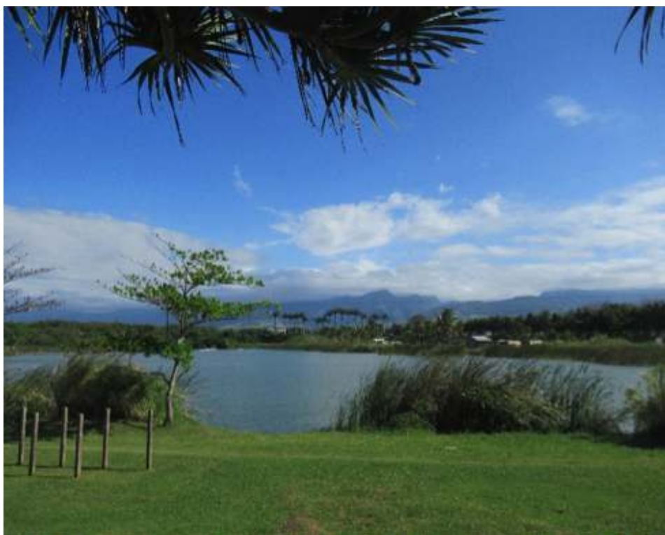
Photo 3. Étang principal du parc du Colosse avec vue sur les montagnes à Saint-André