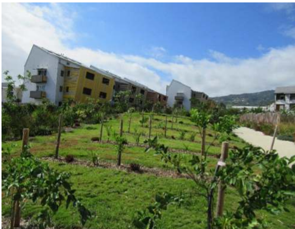
Photo 2. Une des coulées vertes de Beauséjour à Sainte-Marie