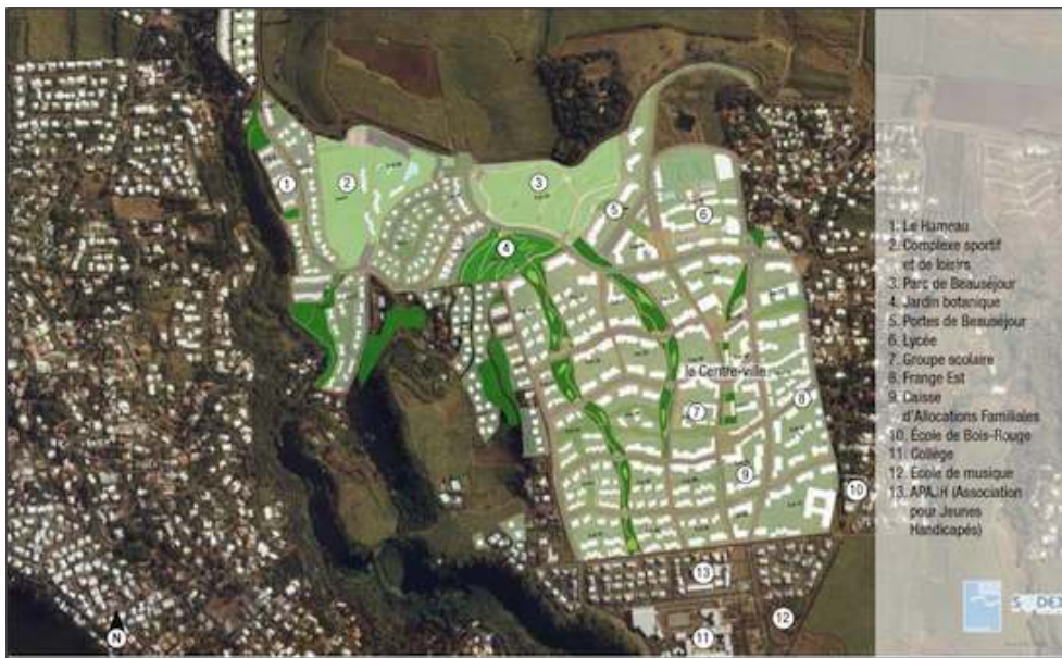
Figure 4. Premier master plan général du projet de Beauséjour, 2009