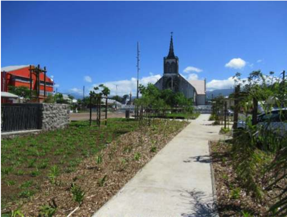
Photo 4. Transformation d'une zone de stationnement en place publique à Saint-André