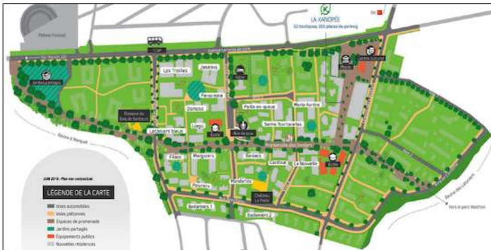
Figure 2. Plan de conception du projet Cœur de ville, 2018