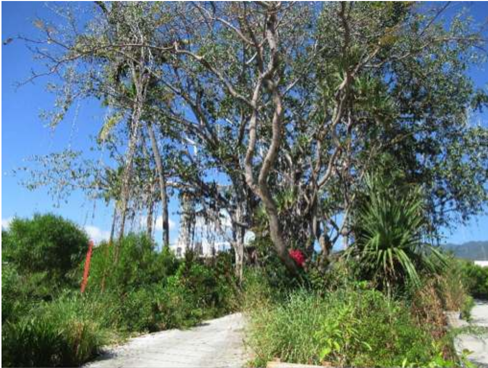
Photo 1. Promenade des Banians de l'écoquartier Cœur de ville à La Possession

Le centre-ville de Saint-André fait partie de la liste des quartiers prioritaires de la politique de la ville avec une concentration de ménages pauvres et de logements sociaux (Daudin et Lieutier, 2015). La commune est inscrite dans un programme national de renouvellement urbain, NPNRU, qui concerne 75 hectares de superficie (figure 5) (Groupement de MOE urbaine et al. , 2020). Dans ce contexte, la mairie a choisi de collaborer avec le même bureau d'études d'urbanisme et de paysage que celui du parc du Colosse, afin de retravailler plus qualitativement les espaces publics et de végétaliser le centre-ville jugé trop minéral. Les premiers travaux ont commencé en 2019 (photo 4).