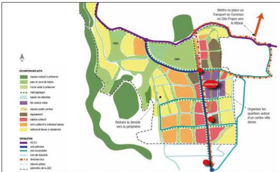
Figure 3. Plan de synthèse de l'AEU du projet de Beauséjour, 2008