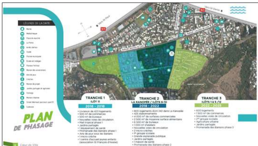
Figure 1. Plan de phasage du projet Cœur de ville