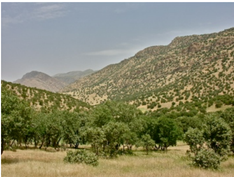
Illustration de la couverture :

Olivier Montreuil & Denis Keith ..... 1 – 10