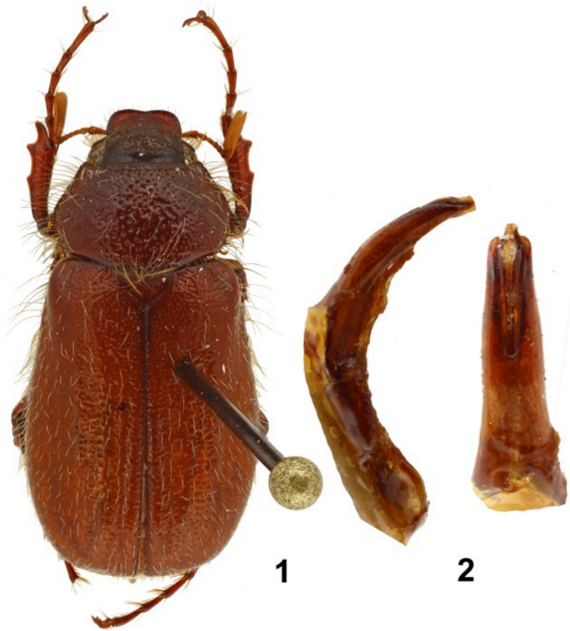
Fig. 1-2. Lasiexis ebrahimii n. sp.

1. Habitus vue dorsale. 2. Paramères, vues latérale et dorsale.