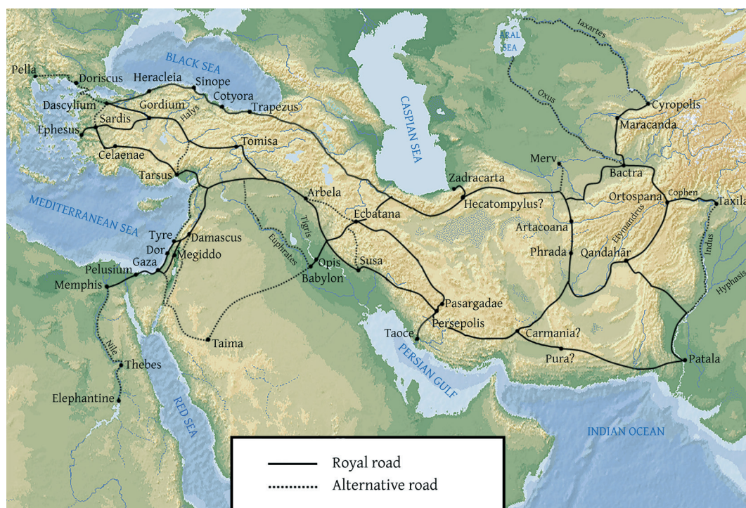
Fig. 1. Les routes de l'empire achéménide. Dessin de Joaquín Velásquez Muñoz, Wouter Henkelman et Bruno Jacobs, reproduit avec l'aimable autorisation de ses auteurs.

Une fois obtenue la protection d'un satrape, le danger prenait fin 99 , pour l'essentiel 100 , si bien que la partie la plus risquée du voyage était, paradoxalement, la première, celle qui s'effectuait dans le monde grec ou à ses abords 101 . Le trajet s'effectuait ensuite le plus souvent en empruntant sous escorte la Route royale qui allait de Sardes à Suse (fig. 1), et qui était ponctuée de relais espacés d'une journée de voyage, où le voyageur muni d'un document officiel pouvait, on l'a dit, être hébergé et