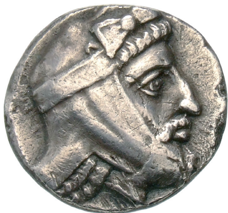
Fig. 2. Tétradrachme d'argent représentant le satrape Tissapherne coiffé de la tiare perse (397-396 av. J.-C., 14,92 gr., diam. 21 mm, Münzkabinett, Staatliche Museen zu Berlin, 18201162).

leur première visite chez un satrape, des éléments typiquement perses, telle la tiare qu'il portait sur la tête et dont témoignent, par exemple, les monnaies de Pharnabaze ou de Tissapherne (fig. 2). Néanmoins, de même que le faste n'atteignait pas celui de la cour royale, le satrape était moins distant que le souverain suprême, il partageait repas et boisson avec les envoyés et discutait avec eux de manière informelle 111 ; rien ne porte à croire que ses visiteurs aient eu à effectuer devant lui le geste d'hommage de la proskynèse 112 .