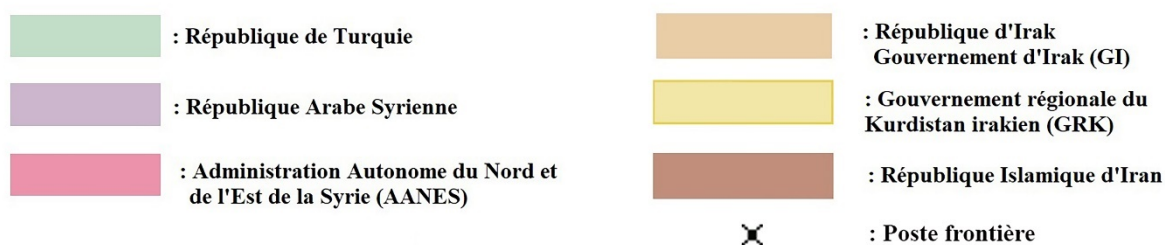
Carte 1 : Moyen-Orient : États et territoires Sources : Fond de carte : Qgis ; Données : Nation Unies 2021 Crédit : T.Rublon