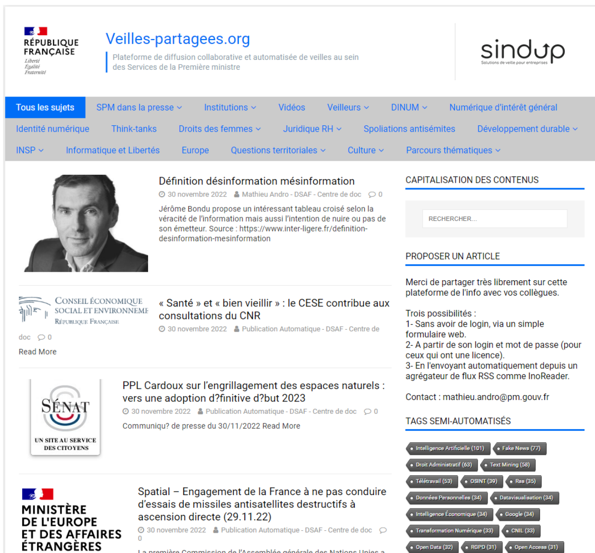
Figure 1 : capture d’écran de la plateforme

Concernant les contenus publiés sur la plateforme, seuls sont publiés des synthèses ou des résumés d’articles ou encore de courts extraits de textes entre guillemets et en mentionnant systématiquement les auteurs et les sources. Les images publiées sur la plateforme sont des images libres de droits trouvées via https://search.creativecommons.org ou via la filtre Google image « Licence Creative Commons ». Les contenus originaux publiés sur cette plateforme sont diffusés sous licence CC BY. Les contenus crawlés via KB Crawl ou Sindup ont fait l’objet d’une redevance payée au Centre Français d’exploitation du droit de Copie. Ces contenus, utilisés pour la seule surveillance, ne sont jamais republiés. Pour maintenir un bon niveau de qualité de la plateforme, tous les contenus qui sont publiés sur la plateforme ont été intégralement lus, sélectionnés, catégorisés, étiquetés et, de préférence, analysés par des veilleurs.