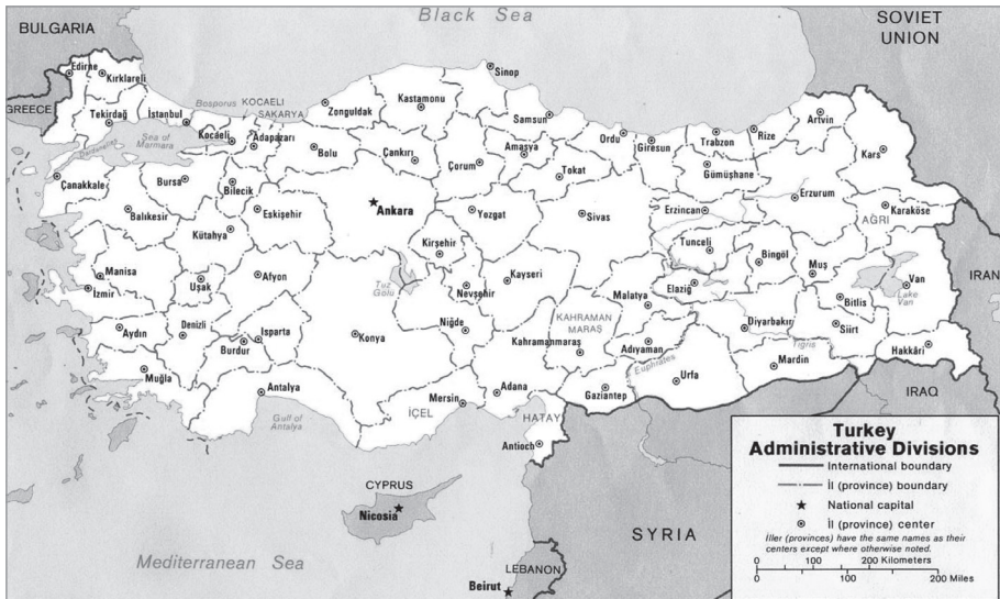
Carte 1 : La République de Turquie en 1923