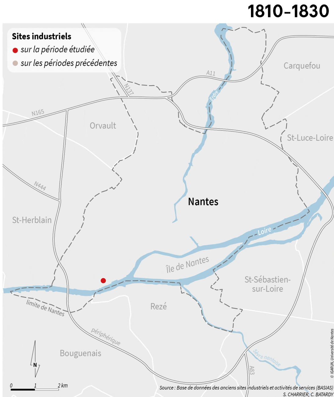
Figure 3 - Évolution de la création des sites industriels sur la commune de Nantes entre 1850 et 2014

Les anciens sites industriels ont pu induire des pollutions des sols. L'inventaire historique national BASIAS (base des anciens sites industriels et activités de service) recense ainsi sur la commune de Nantes la création de 1 935 sites industriels et activités de service entre 1850 et 2014, la période 1951-1990 concentrant les plus nombreuses créations de sites (figure 3). Cet inventaire est complété par la base de données BASOL (Base de données sur les sites et sols pollués), qui recense les sites pollués suivis par les pouvoirs publics. Sur l'île de Nantes, espace central qui a fait l'objet d'un grand projet d'aménagement engendrant de nombreuses opérations d'un projet d'aménagement emblématique, 543 sites ont été recensés sur BASIAS et 4 sur BASOL.