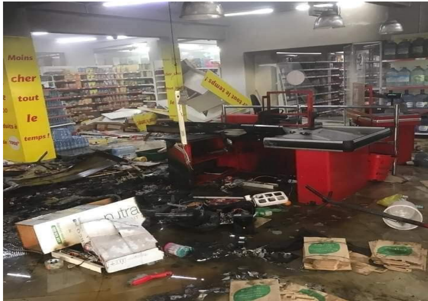
Un supermarché Auchan saccagé et brûlé à Dakar, mars 2021

(Dakar, mars 2021. Crédit : Auchan Sénégal avec autorisation de diffusion)