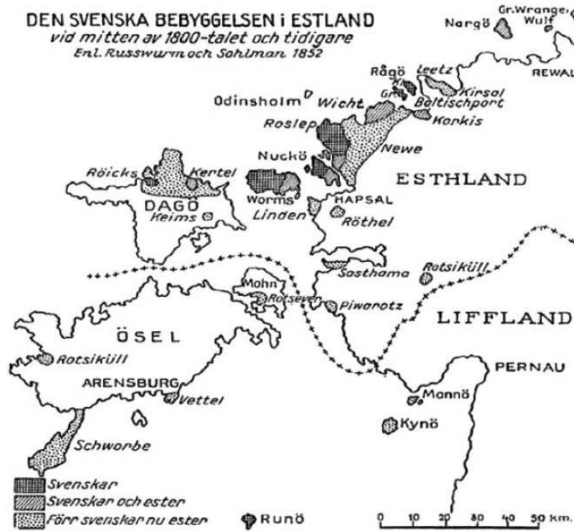
Figure 1 – Répartition de la population suédophone en Estonie au XIX e siècle.

Cela étant posé, nous allons appliquer ces définitions critérielles de l'autochtonie à la population des Estlandssvenskar .