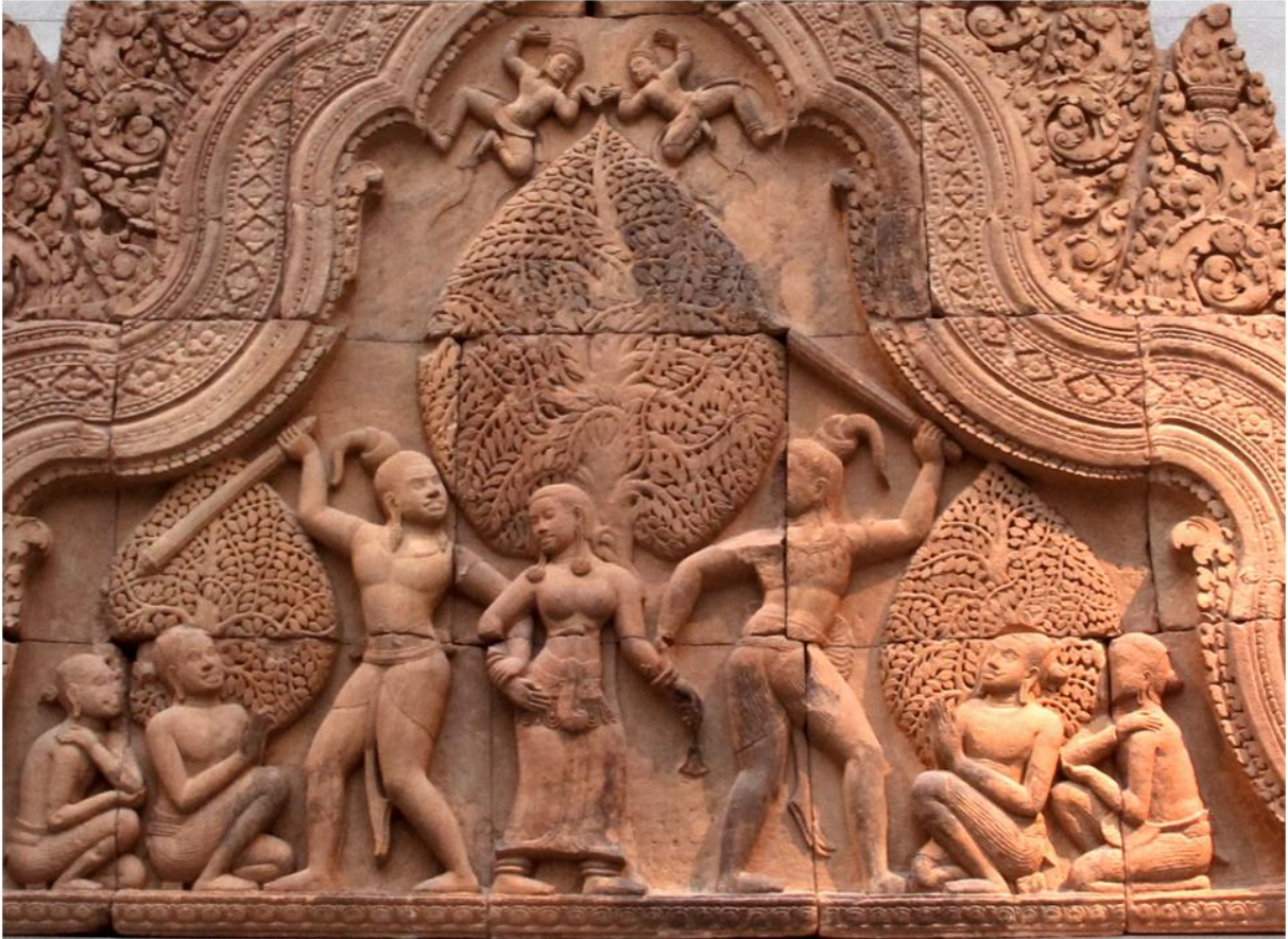
fig. 7 Enlèvement de la nymphe Tilottamā par deux démons, photo Vassil, Wikimedia Commons.