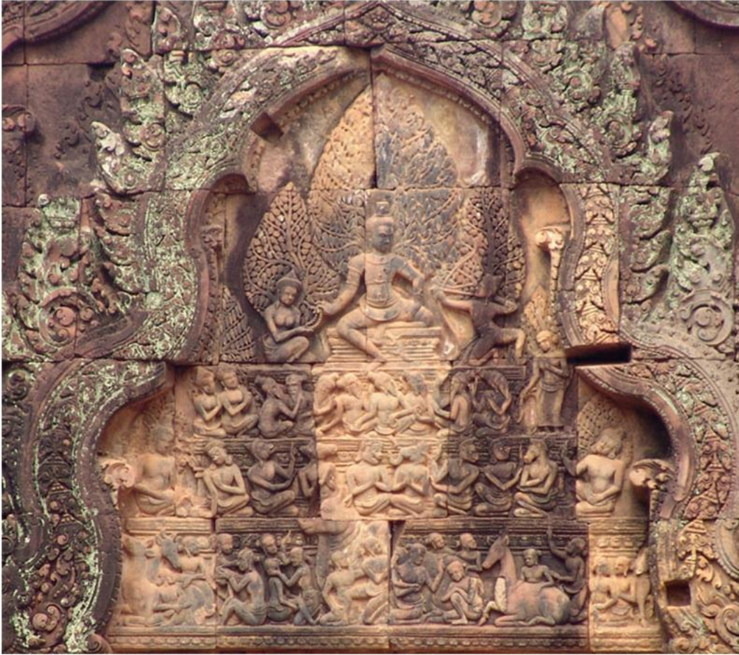
fig. 14 Mise à mort de Kāma par Śiva.