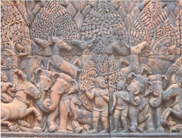
fig. 12 L'incendie de la forêt Khāṇḍava, détail, photo Anandajoti, Wikimedia Commons.