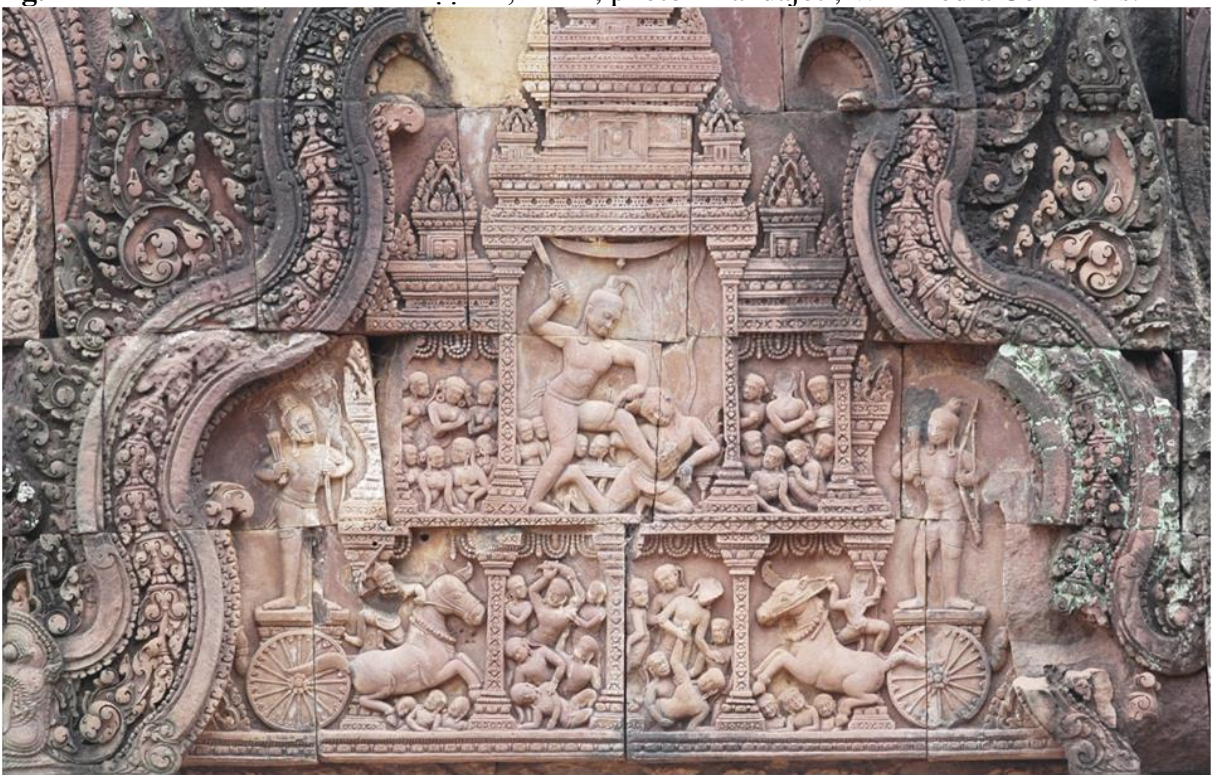
fig. 13 La mise à mort de Kamsa.