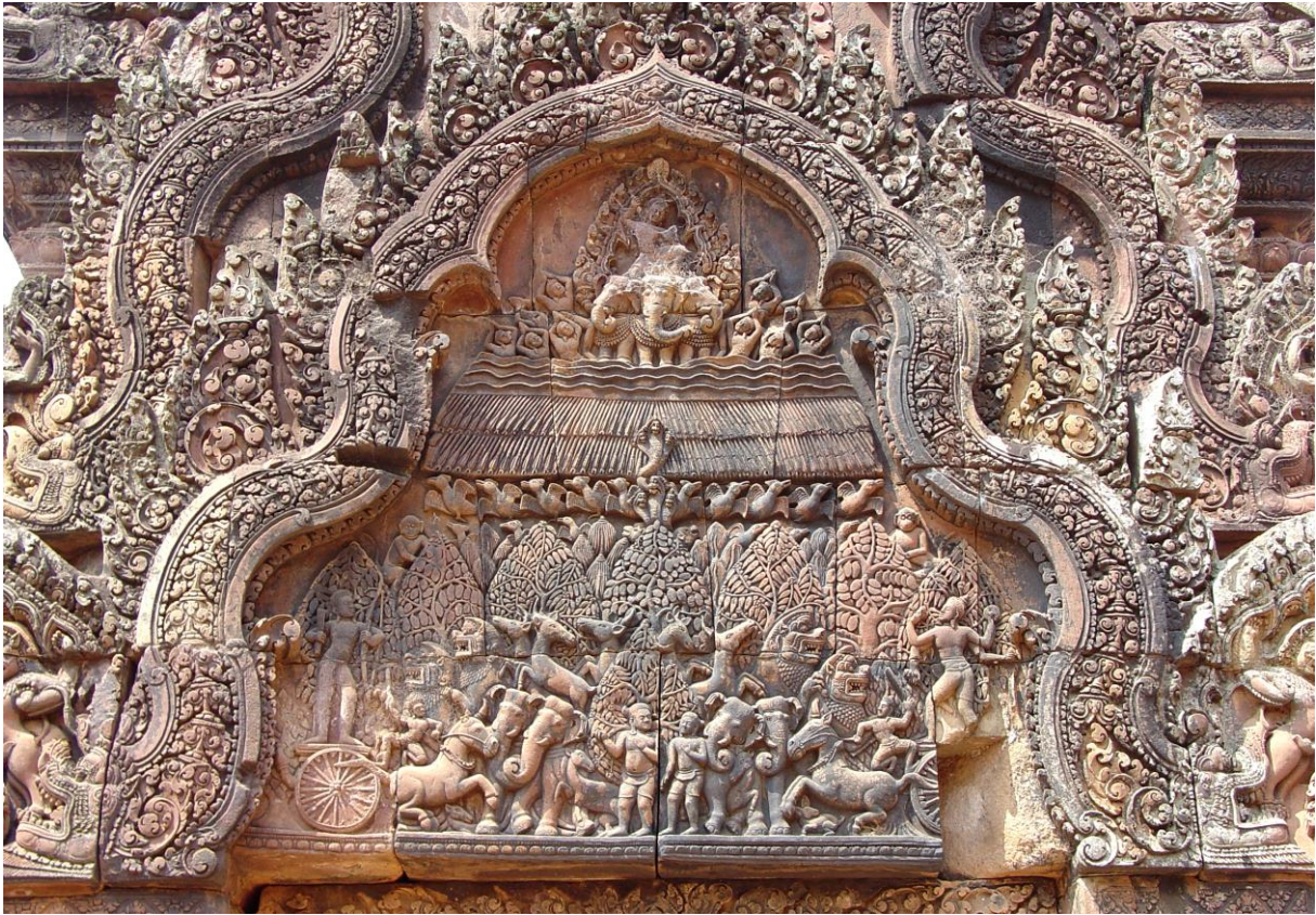
fig. 11 L’incendie de la forêt Khāṇḍava, photo Michael Gunther, Wikimedia Commons.