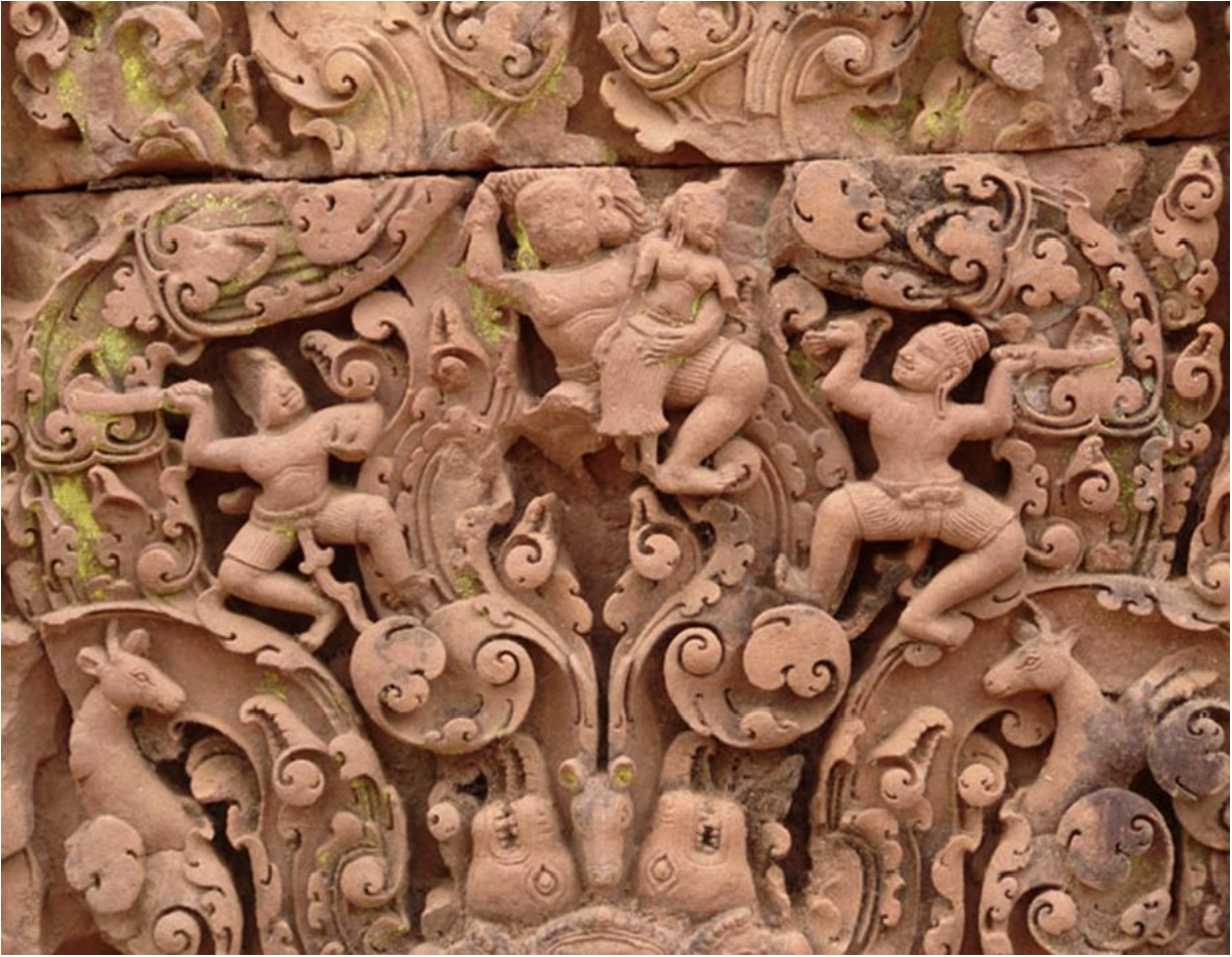
fig. 8 Enlèvement de Sītā.