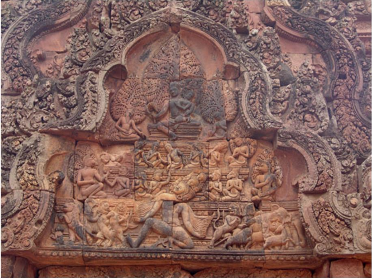
fig. 15 Ébranlement du Kailāsa par Rāvaṇa, photo Olaf Tausch, Wikimedia Commons.