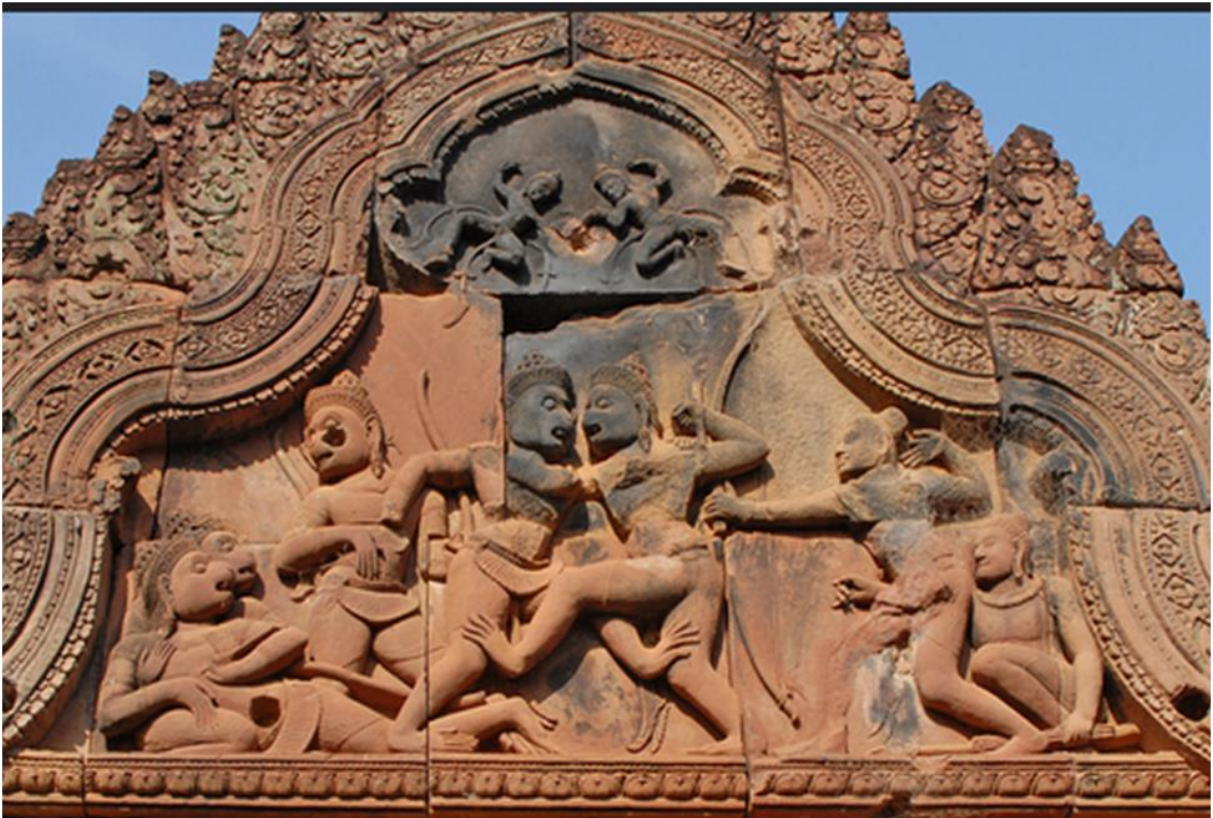
fig. 5 Combat de Bhīma et Duryodhana.