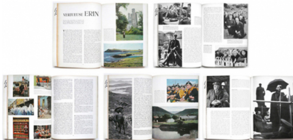
Photographies d'Henri Cartier-Bresson © Henri Cartier-Bresson/Magnum Photos.