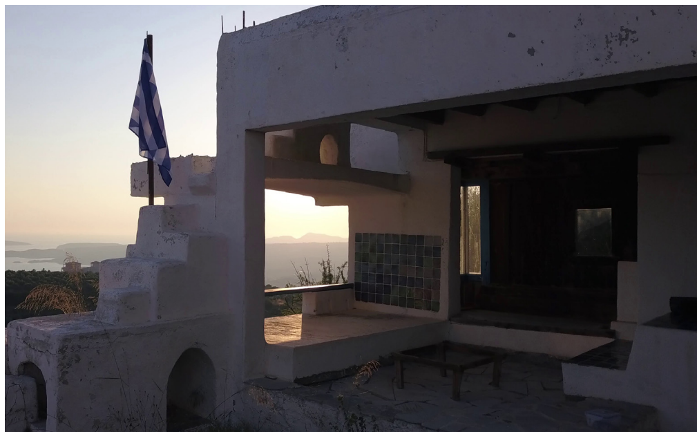
Fig.5 – La stoa ouvrant sur l'ouest, avec les îles de Schiza et de Sapienza.