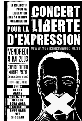
Document 4 – Affiche du concert de soutien aux 14 musiciens emprisonnés