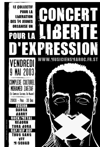
Document 4 – Affiche du concert de soutien aux 14 musiciens emprisonnés