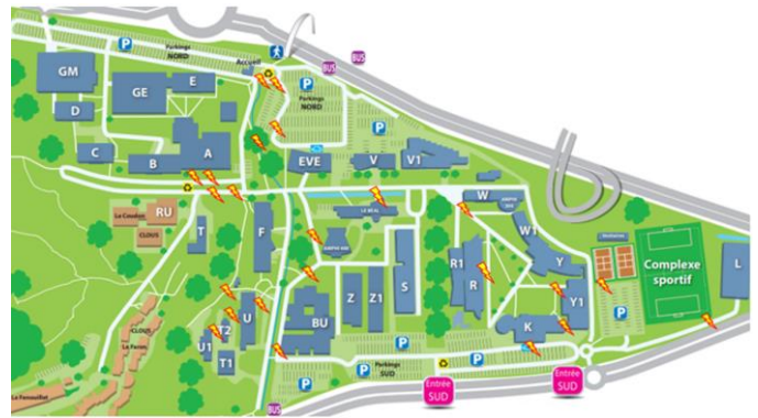
Figure 2 : Localisation des obstacles à l'université de Toulon sur le plan du campus de La Garde.