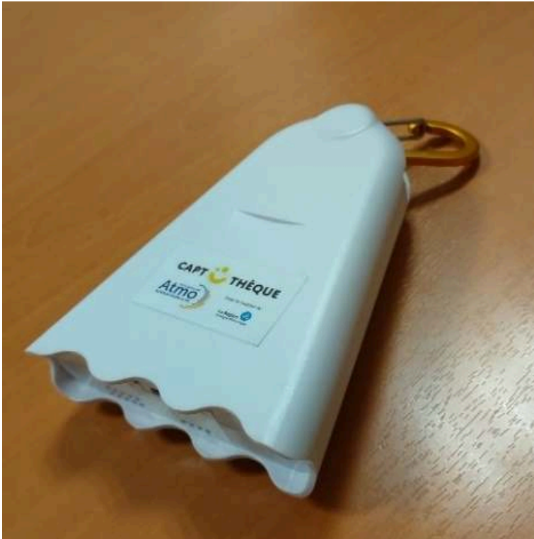
Figure 2 : photo de l'Airbeam V2

enthousiasmes (cas d'Annonay). Ci-dessous est présentée une photo de l'Airbeam 2, le microcapteur distribué qui est en open source et développé par une ONG nord-américaine Habitat Map.