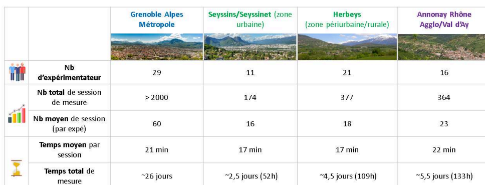
Figure 4 : tableau synthétique de l'inclusion des personnes impliquées et de leur pratique

Ce choix a été payant puisque les personnes sélectionnées ont globalement joué le jeu en réalisant de nombreuses sessions de mesure.