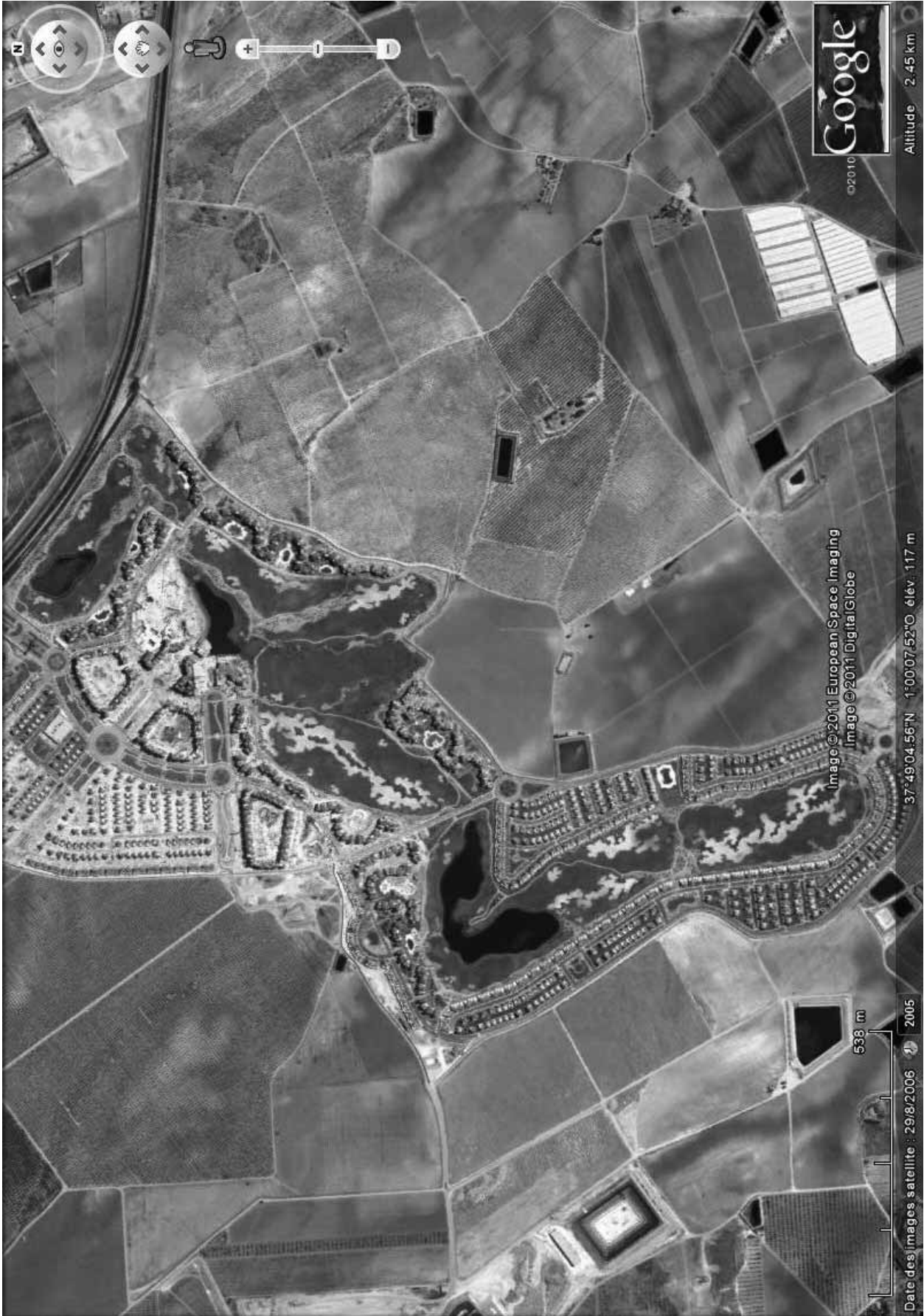
Fig. 2 – Vue aérienne du Torre Golf Resort de la société Polaris.