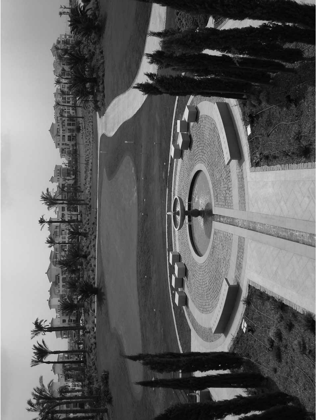
Fig. 3 – Le Torre Golf Resort de la société Polaris.