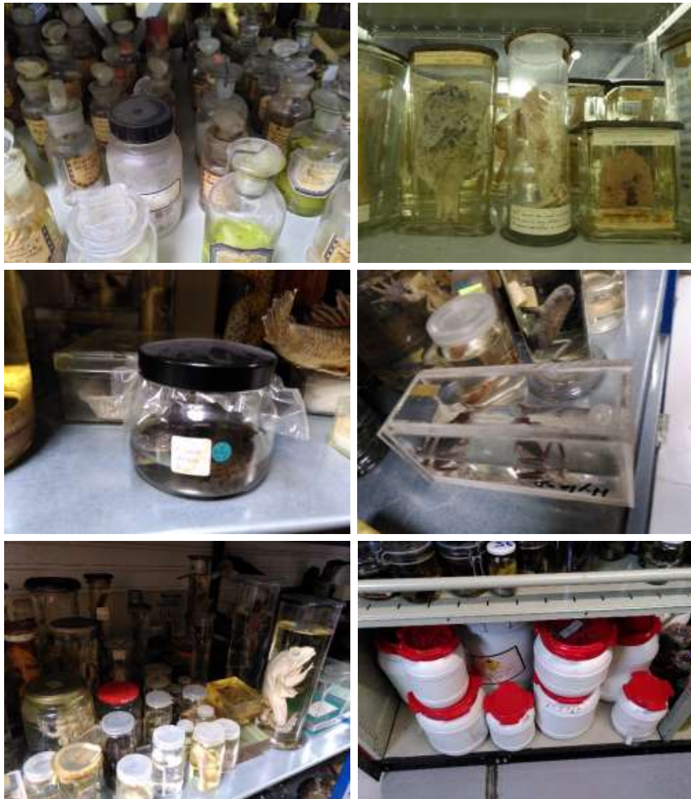
Figure 2 : Diversité des collections en fluide : Photos des différentes collections participant aux recherches sur la conservation-restauration des collections en fluide. Collections d'Anatomie comparée et Mammifères-Oiseaux du MNHN © M. Herbin MNHN, © S. Cersoy, Collections d'Anatomie pathologique Dupuytren de Sorbonnes Université © M. Aladini, Collections universitaires de l'université de Paris. © S. Cersoy.