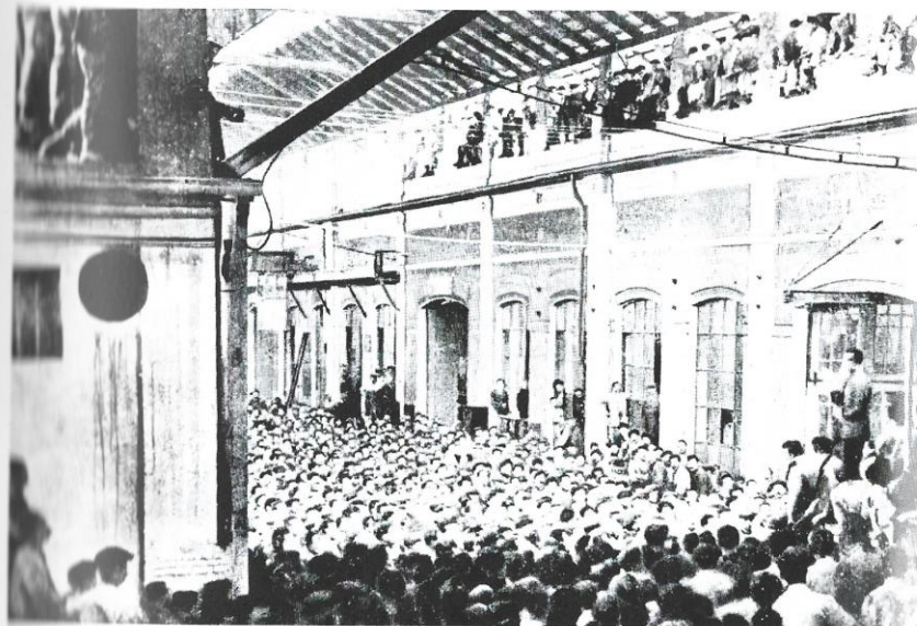
Comizio all'interno della Fiat durante l'occupazione delle fabbriche del 1920

Proprio socialisti e cattolici ottennero più del 50% dei suffragi, sottraendo ai liberali e ai gruppi tradizionali di governo gran parte della loro forza elettorale e del loro predominio politico. Nel frattempo, alla sinistra del Partito socialista era invece sorto a Torino, intorno al periodico «l'Ordine Nuovo», fondato e diretto da Antonio Gramsci, un nuovo movimento