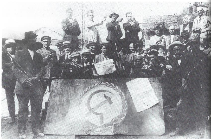
Guardie rosse (Torino, settembre 1920)

Quattro giorni dopo il patto di pacificazione, il 7 agosto 1921, un comunicato dell'Esecutivo del Pcd'I recava, infatti, una solenne diffida ai propri militanti, minacciando anche i «più severi provvedimenti» contro quelli che avessero voluto entrare negli Arditi. La giustificazione addotta si basava su una presunta posizione di principio, secondo cui i comunisti avrebbero dovuto inquadrarsi soltanto in formazioni militari del partito. A questa, i dirigenti del partito aggiungevano una differenza, diciamo così, programmatica: il fine degli Arditi sarebbe stato soltanto quello di difendersi dal fascismo, mentre la lotta proletaria andava rivolta verso la vittoria rivoluzionaria.