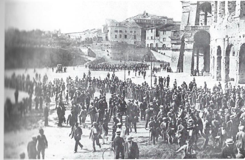
Arditi del popolo manifestano a Roma (1921)

del popolo erano già in grado di tenere un grande raduno: 2.000 uomini inquadrati militarmente in centurie, al comando di Argo Secondari, sfilarono con randelli, pugnali e anche pistole e bombe a mano, fra migliaia e migliaia di persone che erano accorse per acclamarli.