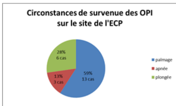
Figure 2. Ce graphique met en évidence les circonstances dans lesquelles survient un OPI. Les exercices de palmes représentent la majorité des cas sur l'ECP.

Certains exercices ont été arrêtés prématurément à cause de la survenue de l'OPI.