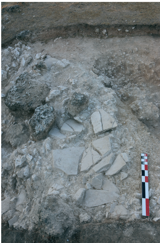
Fig. 4. Kition-Mound, couche d'effondrement du rempart, fouille 2019.

Some of the individuals who appear in the new fragment and who can be identified as members of the Macedonian aristocracy on prosopographical grounds might well have been anxious to position themselves favourably in the changing political circumstances of the early Hellenistic period. The various kings might simply have been pursuing prestige and/or attempting to acquire political influence. Rather ironically, Cassander's initiative was endorsed by his rivals in that typical Hellenistic fashion of royal patronage.