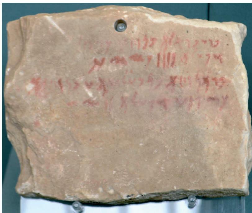
Fig. 2. Ostracon inscrit en phénicien, de Kition- Bamboula , début du IV e siècle av. J.-C. British Museum, 1880,0710.43.

Un document comptable contemporain en donne l'illustration. Un ostracon trouvé à Bamboula lors des travaux d'assainissement menés par l'administration coloniale britannique au XIX e siècle porte, inscrites en phénicien sur les deux faces, deux listes de paiements à des personnels variés 29 : si certains sont certainement préposés ou employés lors d'activités de culte, d'autres semblent en revanche avoir été employés lors de travaux de construction, dans lesquels on voit volontiers avec M. Yon (sans en avoir la preuve) un écho des réaménagements de la première moitié du IV e siècle 30 . Il semble en tout cas hors de doute que ce document, avec d'autres (fig. 2) 31 , prouve l'existence