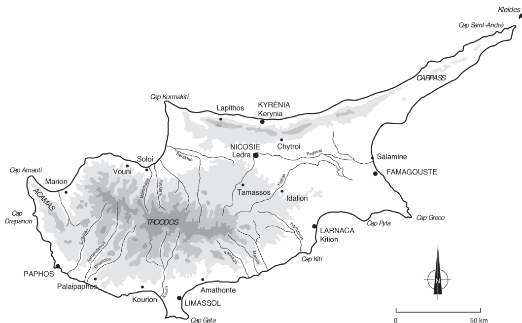
Fig. 1. Carte de Chypre avec les principaux sites du premier millénaire av. J.-C. (A. Flammin, Y. Montmessin, A. Rabot / HiSoMA, MOM).

L'époque classique constitue une phase d'épanouissement du royaume de Kition, dont on suit les étapes principales, grâce à l'archéologie et à des sources historiques relativement abondantes. La fin du royaume, qui marque le passage de la ville et de l'île tout entière sous l'emprise des Lagides, s'accompagne de transformations majeures. Si celles-ci ne sont pas aussi abruptes qu'on pourrait le croire, elles sont tout de même durables, surtout du point de vue politique, institutionnel et civique. À Kition, la transformation en cité hellénistique est à la fois bien évidente, dans le changement de langue et d'acteurs institutionnels, et extrêmement discrète, surtout du point de vue archéologique. On se propose de retracer le parcours ayant conduit Kition à devenir, de royaume chyro-phénicien, une cité hellénistique, en suivant un fil conducteur: la présence d'une élite locale, chyro-phénicienne, assumant des rôles administratifs et institutionnels de premier plan à la fois au sein du royaume et de la cité.