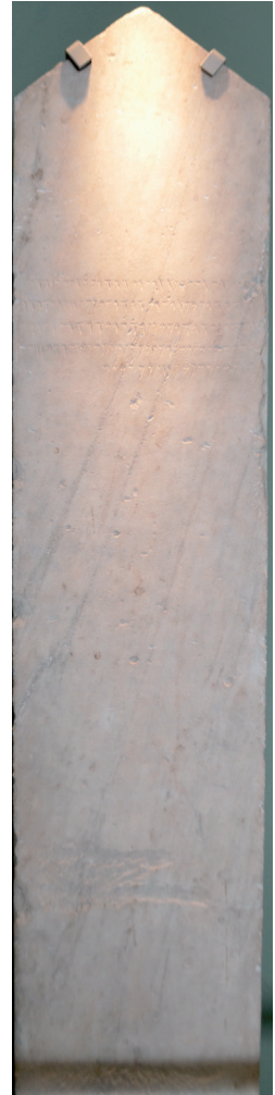
Fig. 3. Stèle-obélisque en marbre avec épitaphe en phénicien, de la nécropole de Kition-Tourapi. IV e siècle av. J.-C. British Museum, SOC.93 (A. Cannavò).

Ces témoignages épars montrent l'existence d'un ensemble de personnages, dont les monuments suggèrent l'appartenance à une élite, qui avaient des responsabilités religieuses et administratives sous le contrôle du roi (et de sa famille). Les parallèles manquent dans la documentation syllabique chypriote pour établir des équivalences ou même des rapprochements, au-delà des titres de wanax-wanassa déjà mentionnés. Les sources littéraires suggèrent toutefois qu'à la cour des rois chypriotes des charges de responsabilité étaient confiées aux élites. Une notice de Cléarque de Soloi, transmise par Athénée (VI 68, 255f-256b), atteste de l'existence de « nobles adulateurs » (εὐγενεῖς κόλακες) jouant le rôle d'espions de cour comparables aux « yeux et oreilles » du Grand Roi perse: s'il attribue cette coutume à l'ensemble des royaumes de Chypre,