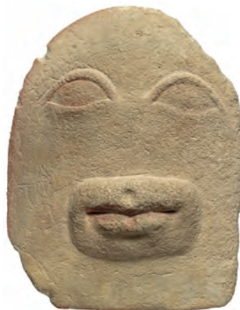
Figure 7 — Plaque votive présentant deux yeux et une bouche, calcaire, Metropolitan Museum of Art 74.51.5171. The Cesnola Collection, Purchased by subscription 1874-76.