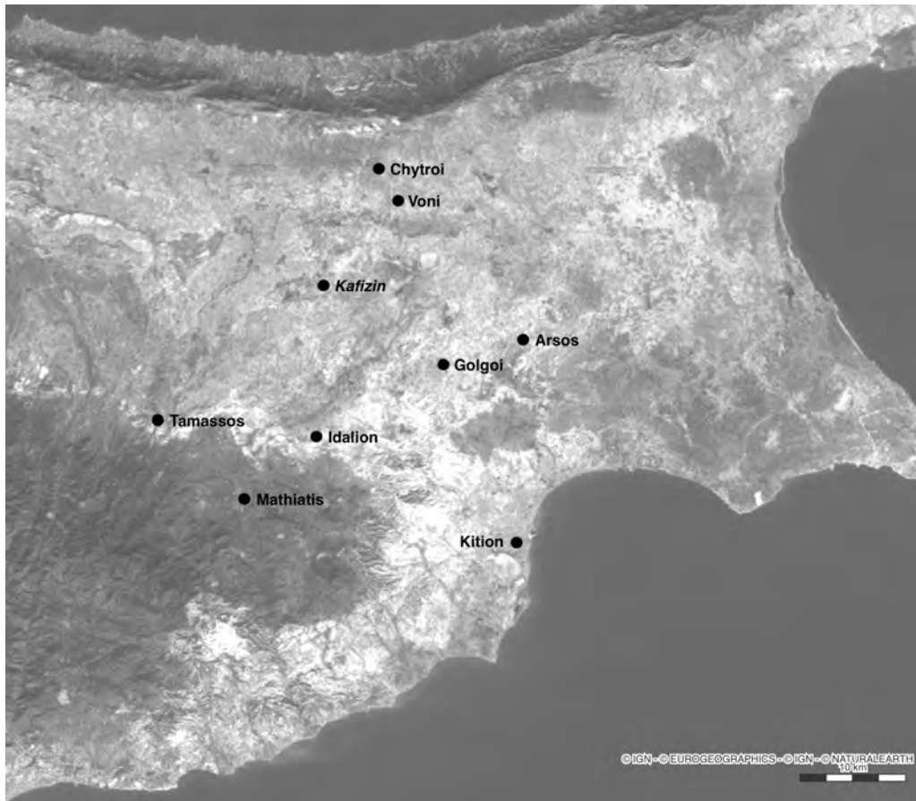
Figure 12 — Carte de l'île avec l'emplacement des principaux sites mentionnés. A. Cannavò sur fond satellite IGN.

Il semblerait en conclusion que l'attention portée par la formulation phénicienne à l'écoute de la divinité ne trouve pas de correspondant dans la pratique et dans la formulation du grec à la même époque, si ce n'est lorsque le grec se rapproche explicitement du phénicien. Il faut également souligner que la région où les ex-voto anatomiques (yeux, oreilles) et l'épiclèse ἐπήκοος sont documentés à Chypre (la région de la Mésooria centrale : sanctuaires de Golgoi, Arsos, Voni, Kafizin ... : fig. 12) n'est pas spécialement caractérisée par une présence phénicienne aux époques antérieures.