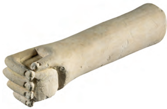
Figure 13 — Bras droit votif tenant un fruit dans sa main, calcaire, musée du Louvre, AM 3344.

En écho, les images d'oreilles pourraient se substituer aux formules « puisse-t-elle/il écouter (sa/ma) voix », « parce qu'elle/il a écouté (sa/ma) voix », soulignant le souhait et le remerciement pour un acte accompli. À travers ces représentations, les fidèles manifesteraient leur espoir d'être entendus, sous une forme métonymique comme c'est le cas notamment à Carthage 91 où se combinent, sur certaines stèles provenant du tophet, l'iconographie des oreilles et la mention épigraphique.