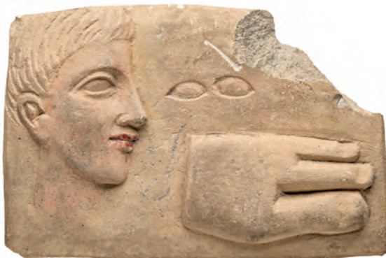
Figure 8 — Plaque votive, calcaire, musée du Louvre, MNB 324.

Deux plaques dont la partie supérieure est légèrement arrondie décorées d'une oreille droite au lobe allongé et d'une paire d'oreilles en haut relief.