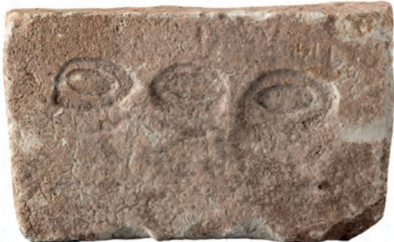
Figure 5 — Plaque votive présentant trois yeux, calcaire, musée du Louvre, AM 3351.