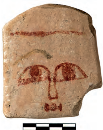
Figure 4 — Plaque votive peinte présentant les traits d'un visage, calcaire, Cyprus Museum, 1951/IV-6/17f.