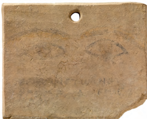
Figure 1 — Plaque votive peinte dédiée à Theos Hypsistos , calcaire, musée du Louvre, AM 565.

Plaque trapézoïdale et arrondie présentant deux yeux sculptés en relief aux paupières bien marquées qui se rejoignent, une ligne de peinture de couleur rouge marque la bordure supérieure.