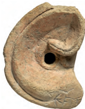
Figure 9 — Oreille votive inscrite, Metropolitan Museum of Art 74.51.2357. The Cesnola Collection, Purchased by subscription 1874-76.