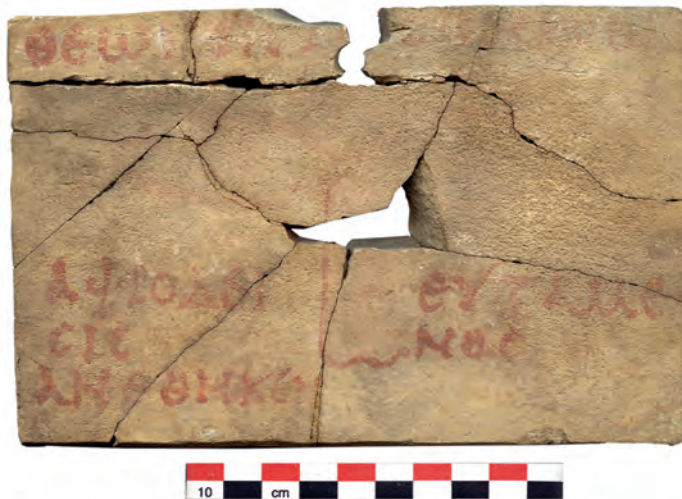
Figure 3 — Plaque votive peinte dédiée à Theos Hypsistos epékoos , musée du Louvre, AM 669.