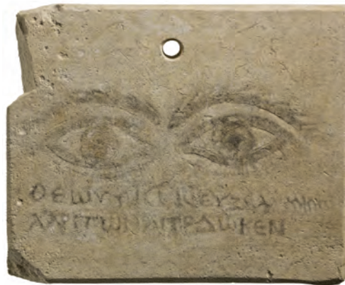
Figure 2 — Plaque votive peinte dédiée à Theos Hypsistos , calcaire, musée du Louvre, AM 670.