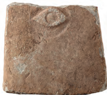
Figure 6 — Plaque votive décorée d'un œil, calcaire, musée du Louvre, AM 3352.