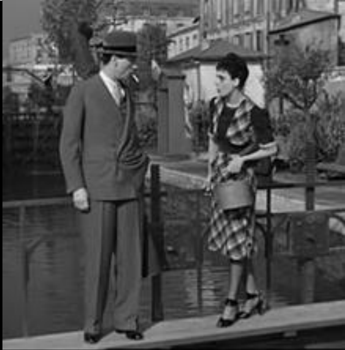
1938 Hôtel du Nord Marcel Carné, d'après le roman d'Eugène Dabit Dialogues : Albert Simonin

Mme Raymonde : C'est la première fois qu'on me traite d'atmosphère ! Si je suis une atmosphère, t'es un drôle de bled ! Oh là là... les types qui sont du milieu sans en être et qui crânent à cause de ce qu'ils ont été, on devrait les vider ! Atmosphère ?! Atmosphère ?! Est-ce que j'ai une gueule d'atmosphère ?! Puisque c'est ça, vas-y tout seul à La Varenne, bonne pêche, et bonne atmosphère !