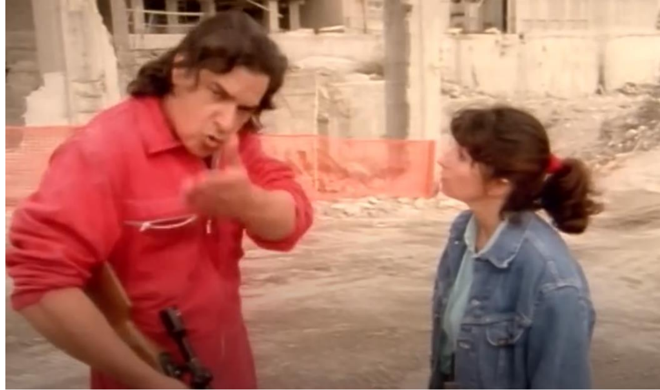
1997 Marius et Jeannette Robert Gu  diguian

Jeannette : Et en plus, tu vas me dénoncer aux flics ! Bé, garde tes pots et lâche-moi, elle est pas à toi cette usine, tu viens de le dire ! J'ai pas de sou pour la peinture. Je vais pas aller en tôle pour ça ! Je suis pas la fille de Jean Valjean, moi. Alors, je te rends tes pots et je