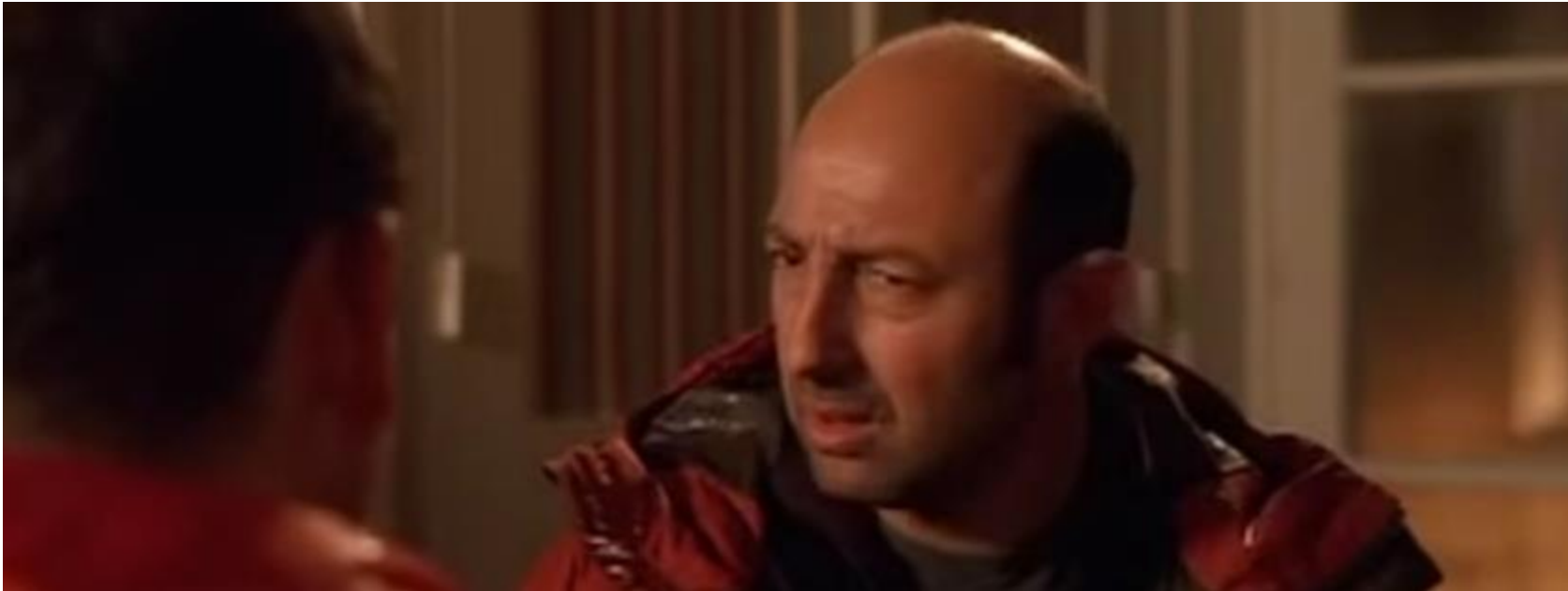
2008 Bienvenue chez les Ch'tis Dany Boon